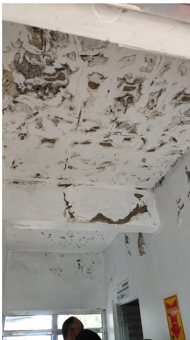
Corredor com infiltrações