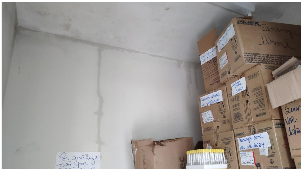
Depósito com infiltrações