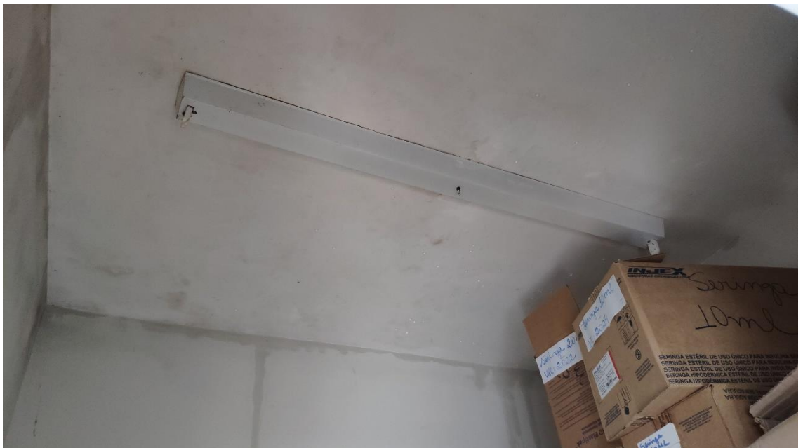
Depósito sem iluminação