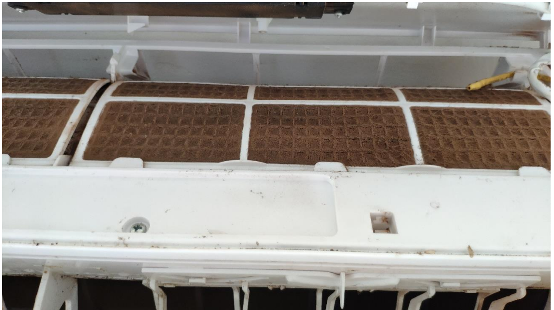
Ar Condicionado – Filtro Sujo