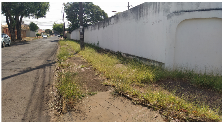
Foto 3 Calçada sem acessibilidade