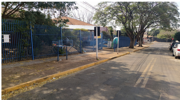
Foto 2 Sinalização de área escolar