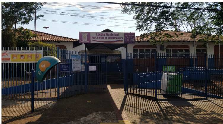
Foto 1 Fachada conservada