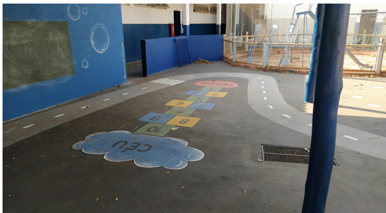
Foto 13 Parquinho revitalizado