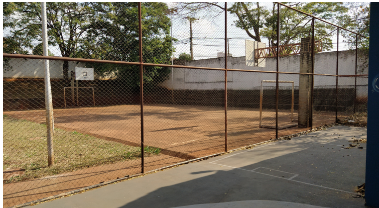
Foto 12 Quadra sem cobertura