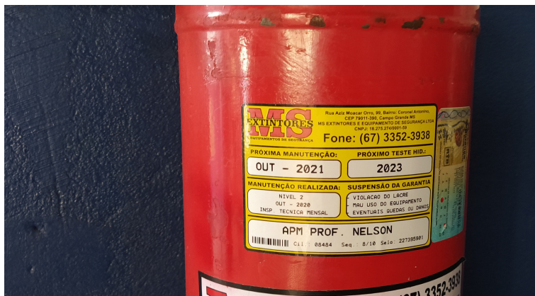
Foto 14 Extintor de incêndio