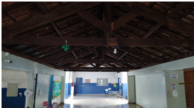
Foto 10 Corredor central