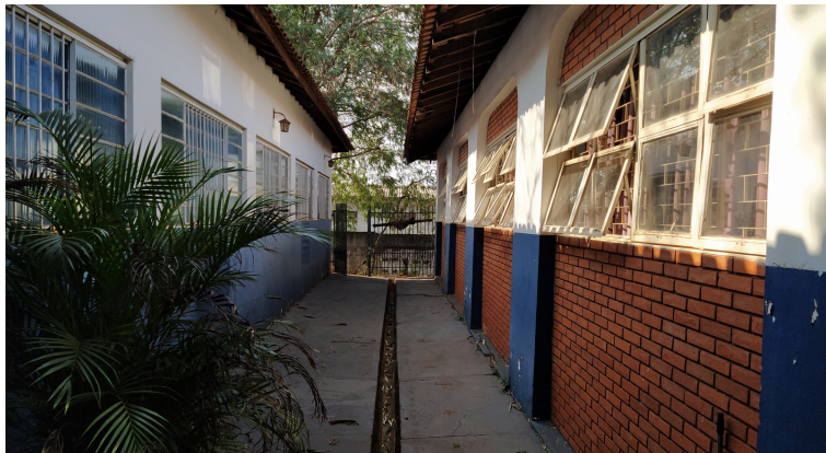
Foto 11 Corredor