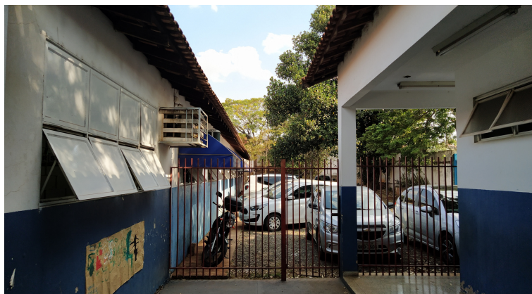
Foto 16 Estacionamento