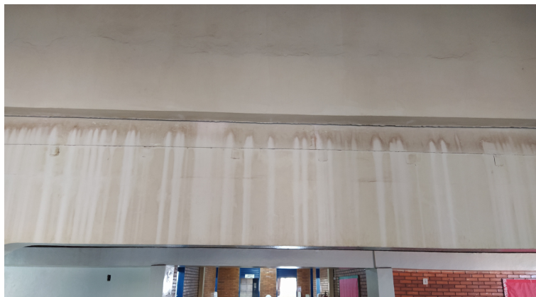
Foto 8 Parede com infiltração