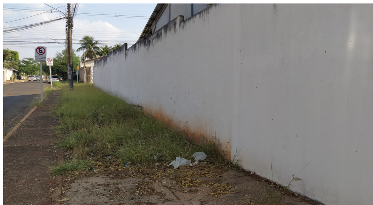
Foto 4 Falta de manutenção da área verde externa