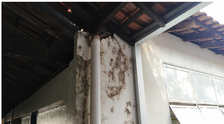
Foto 7 Parede com infiltração