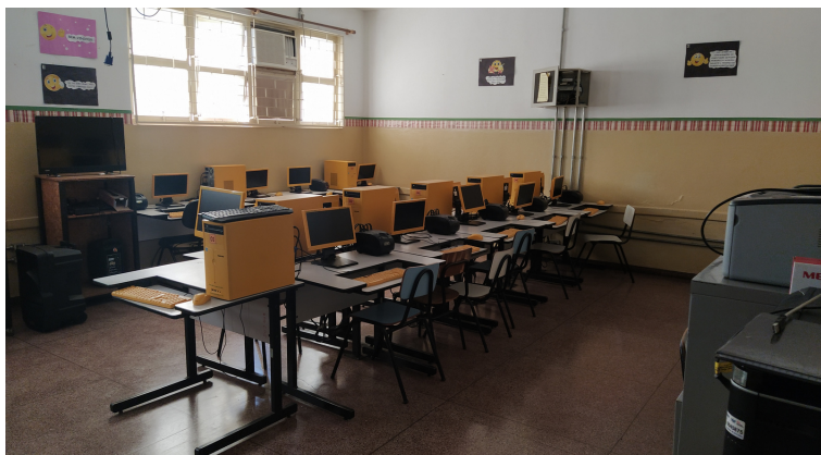
Foto 15 Sala de informática