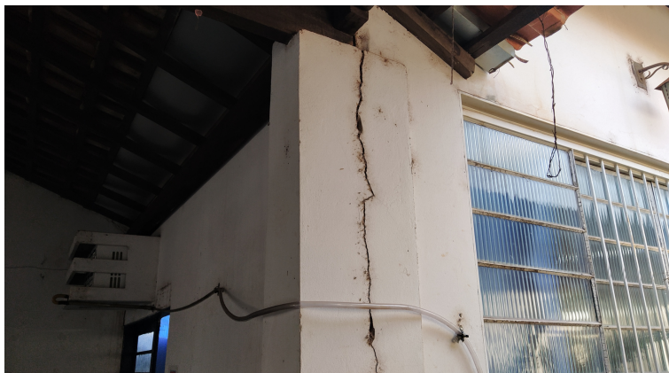
Foto 9 Rachadura na parede