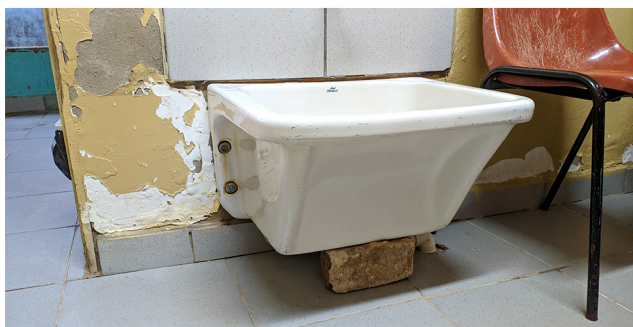
Foto 15 Lavatório quebrado