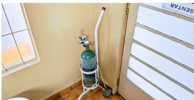
Foto 3 Falta de oxigênio na unidade