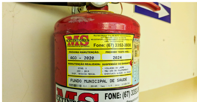
Foto 9 Extintor com manutenção vencida