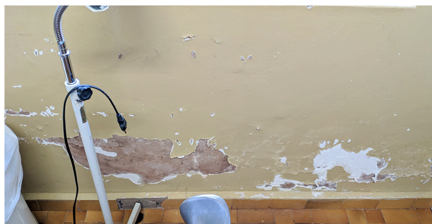
Foto 10 Parede com infiltração