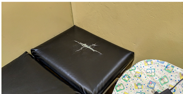
Foto 11 Macas deterioradas