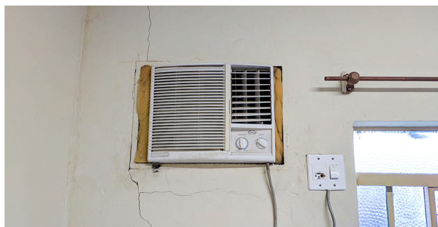
Foto 7 Ar-condicionado antigo e rachaduras