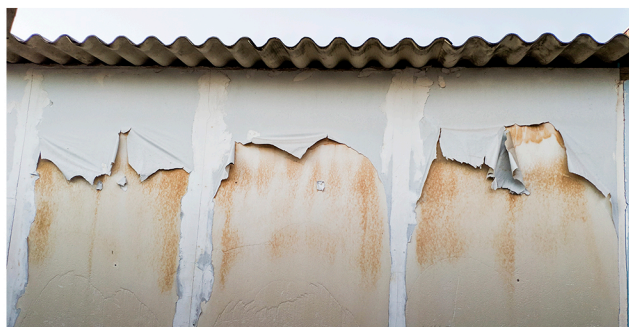
Foto 17 Parede Infiltração