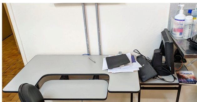
Foto 8 Falta de computadores