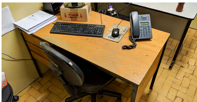
Foto 12 Móveis antigos