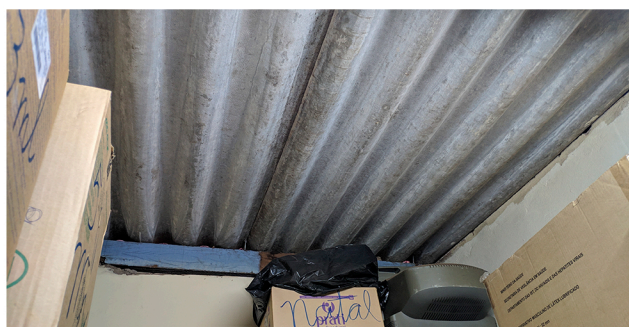
Foto 18 Almojarifado sem forro