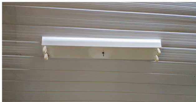
Foto 6 Falta de iluminação