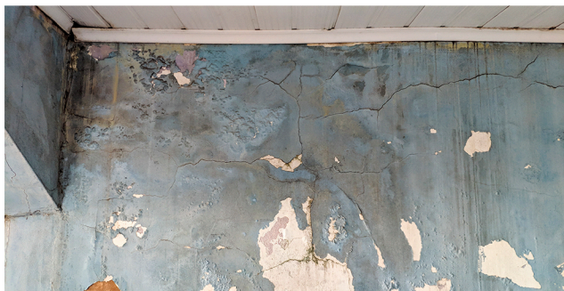
Foto 1 Parede com infiltração na recepção