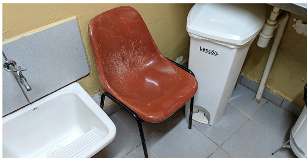
Foto 14 Cadeiras antigas