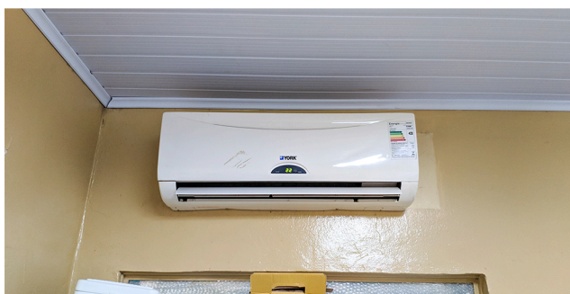
Foto 13 Ar-condicionado com defeito