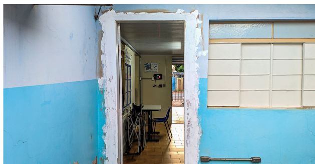
Foto 20 Paredes com rachadura