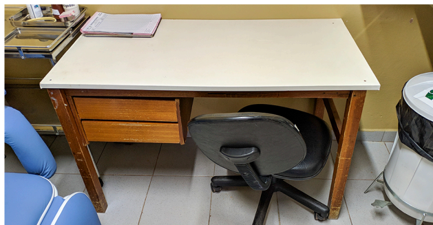
Foto 16 Cadeiras deterioradas