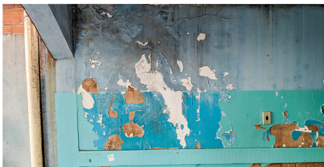
Foto 2 Parede com infiltração na recepção