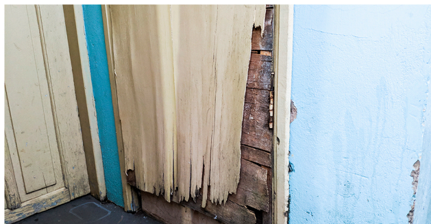
Foto 19 Porta deteriorada pela umidade