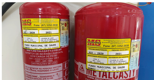
Foto 8 Extintor com manutenção vencida