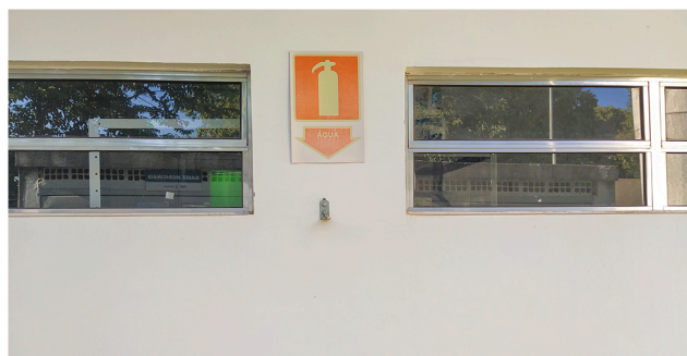
Foto 9 Falta de extintor