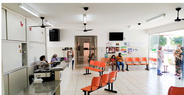
Foto 5 Unidade bem conservada