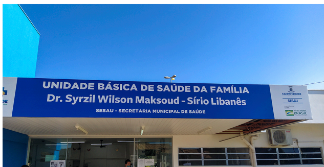
Foto 2 Unidade bem conservada