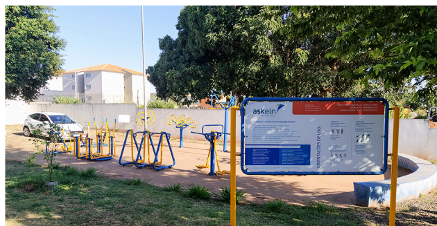
Foto 7 Unidade bem conservada