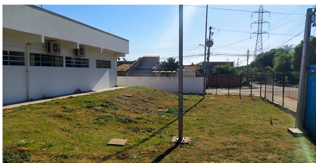
Foto 3 Unidade bem conservada