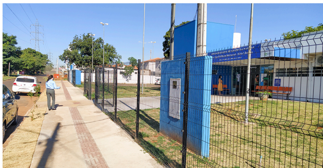
Foto 1 Unidade bem conservada