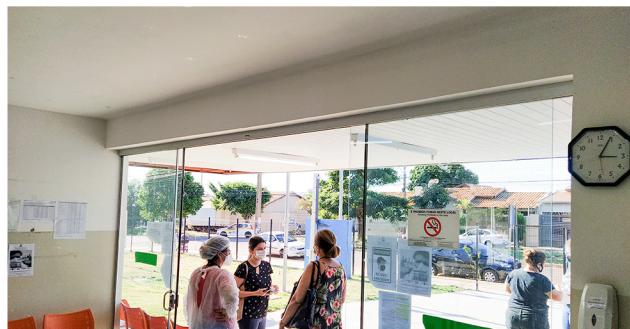
Foto 6 Unidade bem conservada