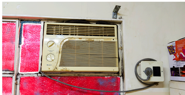
Foto 17 Ar-condicionado antigo