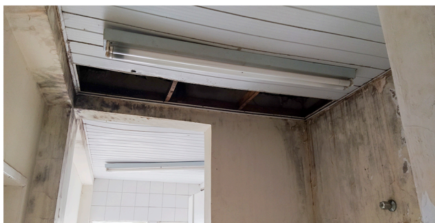
Foto 15 Infiltração e teto sem forro na copa