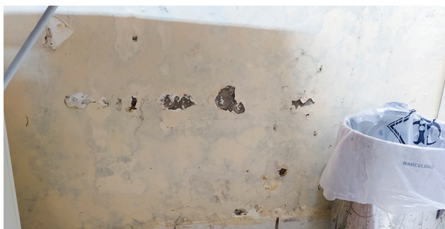
Foto 5 Paredes com infiltração