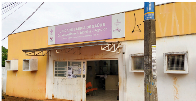
Foto 1 Fachada mal conservada