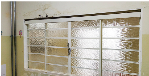
Foto 3 Janela de frente para parede