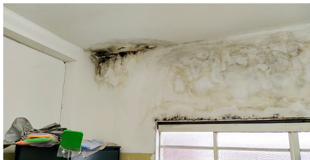
Foto 9 Paredes com infiltração