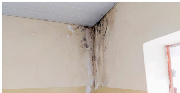
Foto 7 Paredes com infiltração