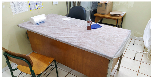
Foto 18 Consultórios sem computadores