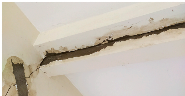
Foto 6 Estrutura com rachaduras