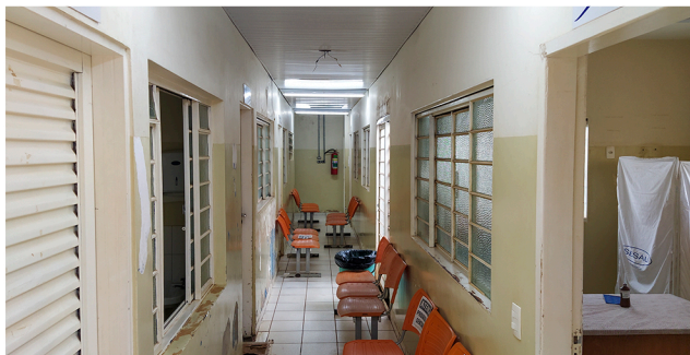
Foto 2 Corredor sem acessibilidade