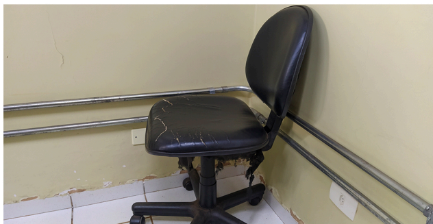
Foto 11 Móveis deteriorados