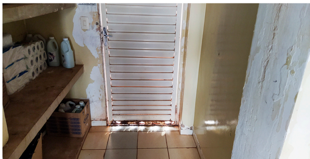
Foto 14 Porta enferrujada