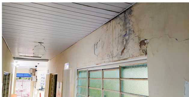
Foto 10 Paredes com infiltração