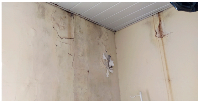
Foto 4 Paredes com infiltração