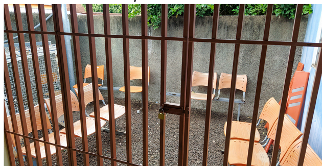
Foto 20 Área destinada a pacientes com suspeita de Covid-19