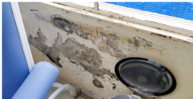
Foto 8 Paredes com infiltração