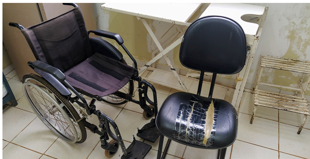
Foto 12 Cadeira de rodas doada