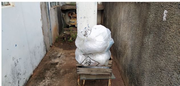
Foto 13 Armazenamento indevido de lixo contaminado