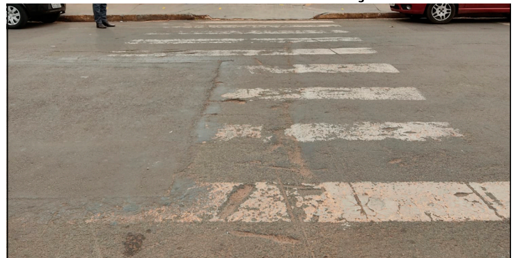
FOTO 18 NECESSIDADE DE FAIXA ELEVADA