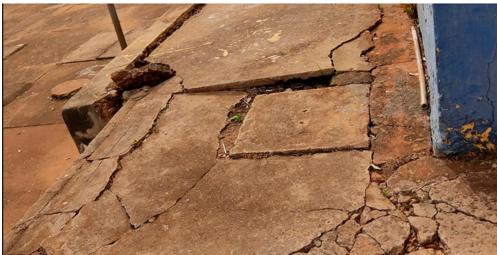
FOTO 17 CONSTRUÇÕES DESABANDO