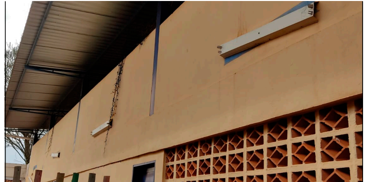
FOTO 16 FALTA DE ILUMINAÇÃO