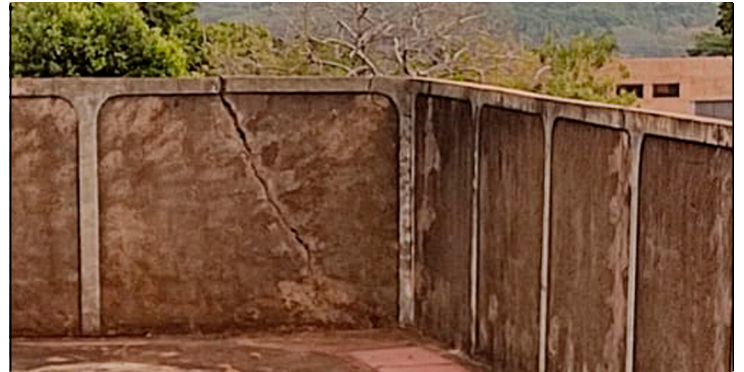
FOTO 14 MUROS QUEBRADOS