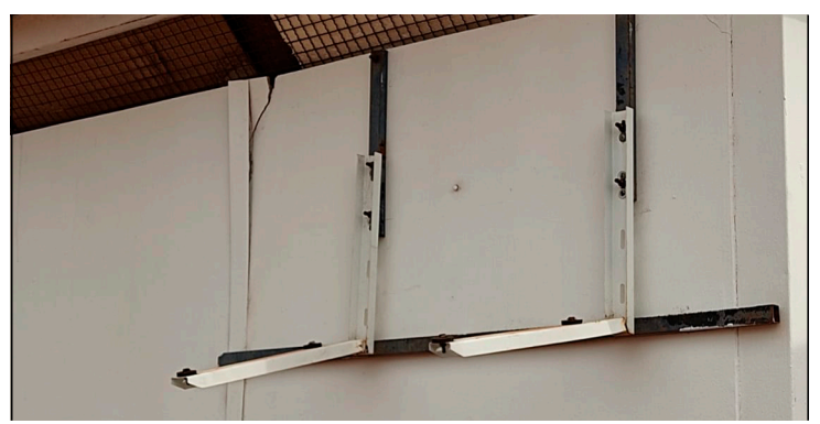
FOTO 12 ROUBO DE EQUIPAMENTOS