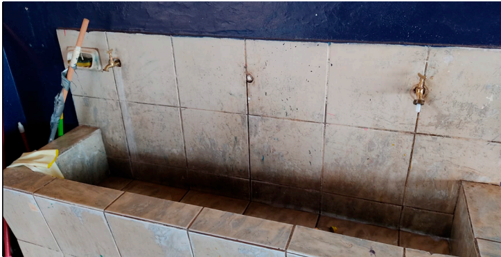
FOTO 13 LAVABO PRECÁRIO