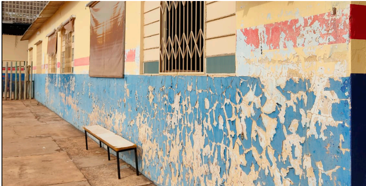
FOTO 15 PINTURA ANTIGA