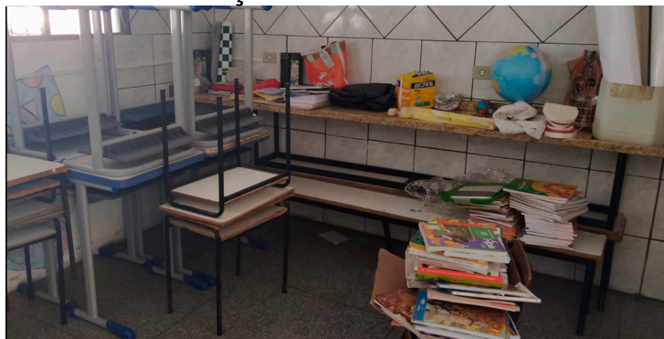
FOTO 23 SALAS DESATIVADAS