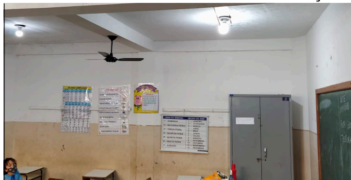
FOTO 24 SALAS COM POUCA OU NENHUMA VENTILAÇÃO, 2º ANDAR