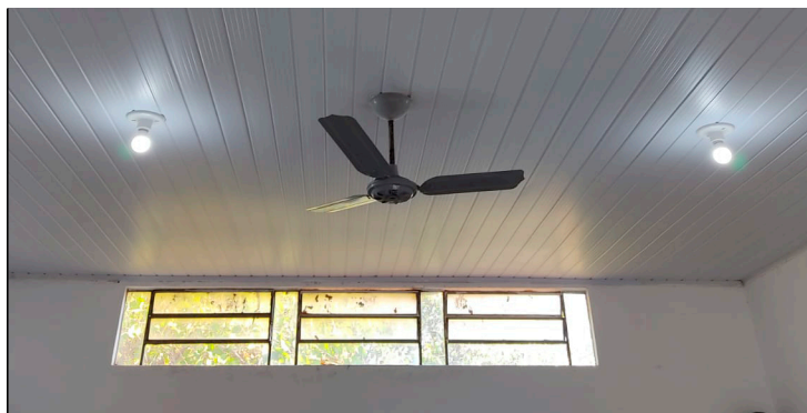
FOTO 25 VENTILADORES QUEBRADOS