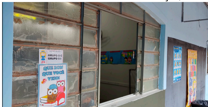
FOTO 26 JANELAS EM PÉSSIMO ESTADO