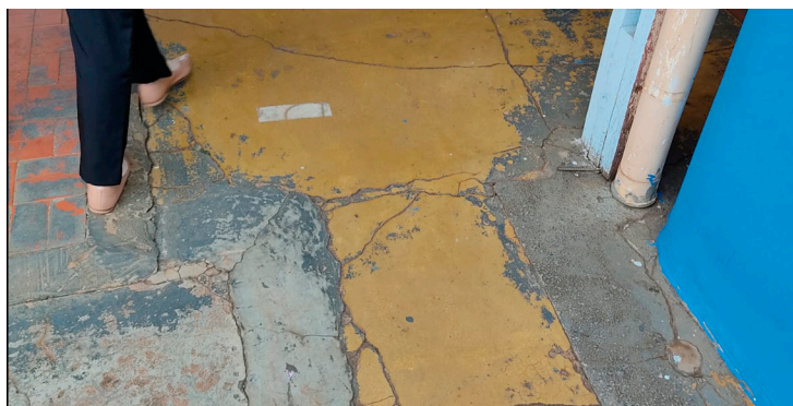
FOTO 27 PISO COMPROMETIDO