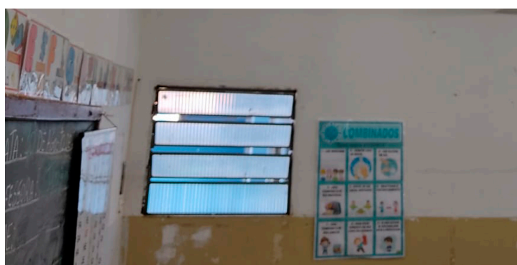
FOTO 20 SALAS COM POUCA OU NENHUMA VENTILAÇÃO, 1º ANDAR