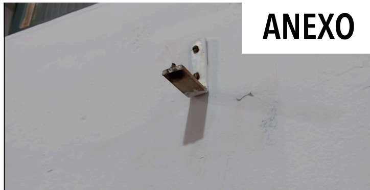
FOTO 22 TODOS OS EXTINTORES EM MANUTENÇÃO