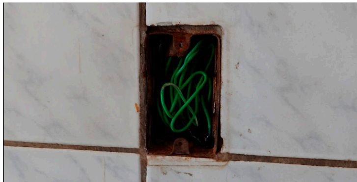
FOTO 21 FIAÇÃO EXPOSTA POR TODO ANEXO