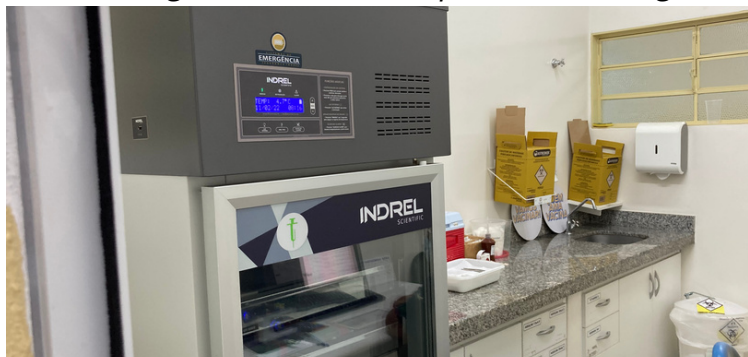
Foto 5 Sala de vacinas