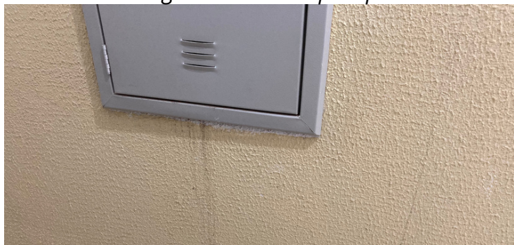
Foto 3 Água escorrendo no padrão de energia