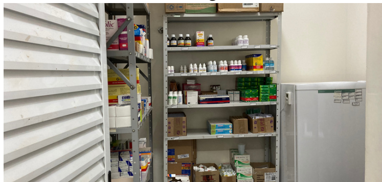
Foto 6 Farmácia da unidade