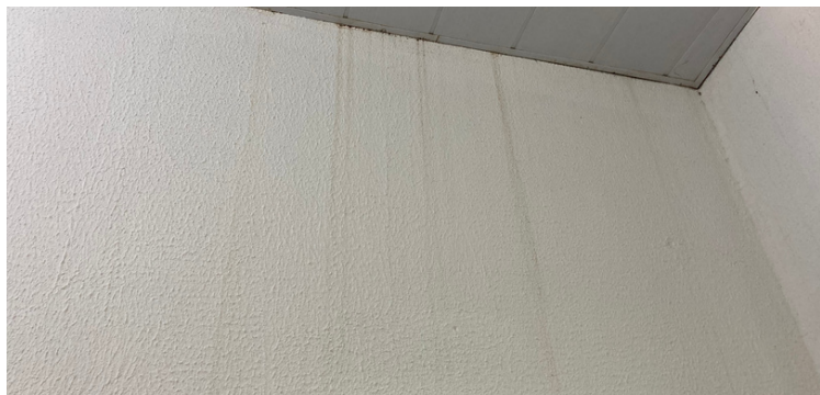
Foto 1 Água escorrendo pela parede