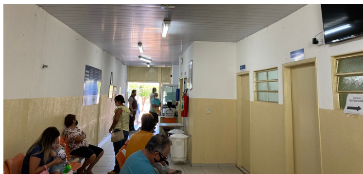
Foto 8 Público na recepção