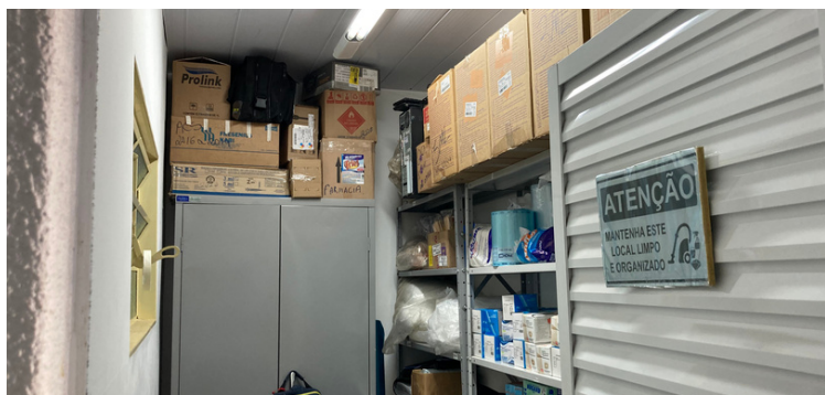
Foto 7 Almoxarifado com falta de espaço