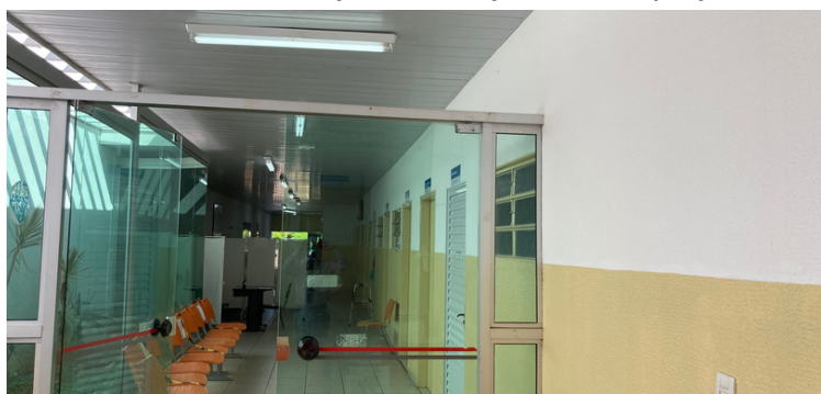
Foto 9 Recepção para teste de COVID