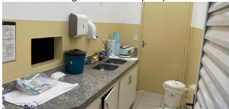
Foto 4 Sala organizada