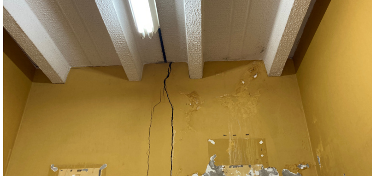
Foto 5 - Rachaduras comprometendo a estrutura do prédio