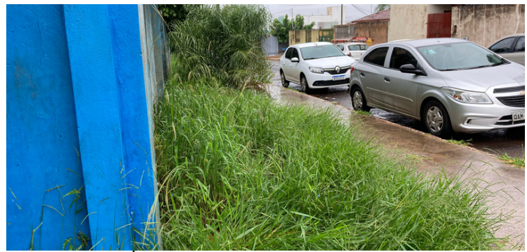
Foto 2 - Área externa da unidade com a grama alta