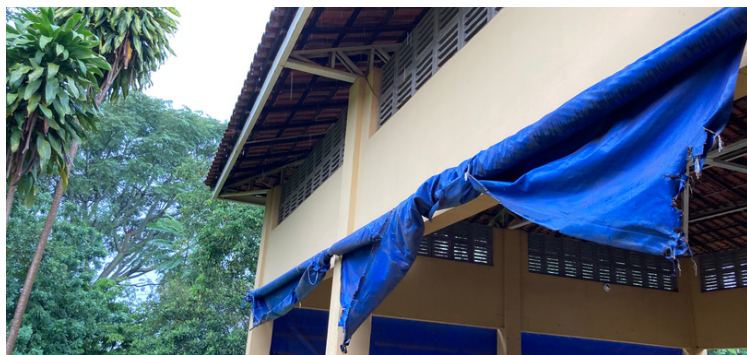
Foto 9 - Toldo deteriorado