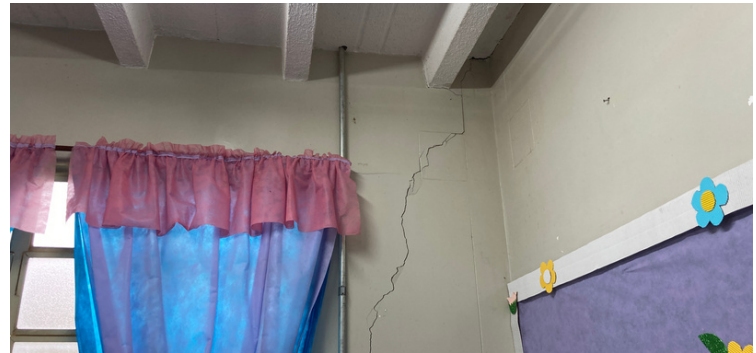
Foto 8 - Salas de atendimento acometidas por rachaduras