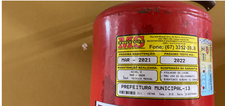
Foto 3 -Extintores com a data de validade expirada