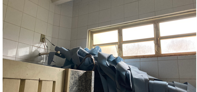
Foto 6 - Banheiro desativado usado como depósito