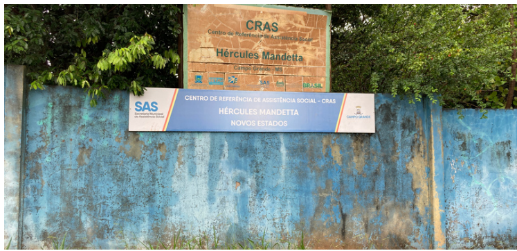
Foto 1- Fachada do CRAS Hércules Mandetta