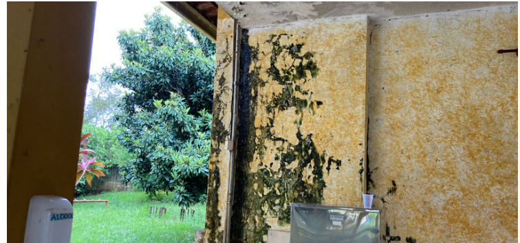
Foto 4 - Mofo alastrado na maioria das dependências do CRAS