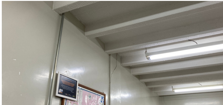
Foto 7 - Fissuras nas paredes do CRAS