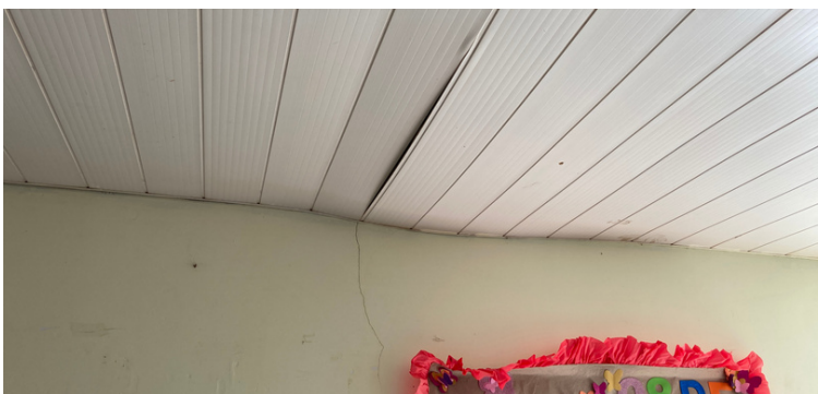
Foto 5 - Forro empenado na recepção da unidade