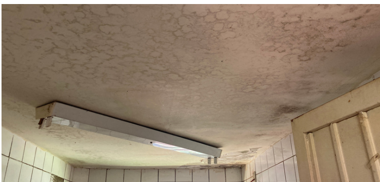
Foto 7 - Banheiros isentos das devidas condições de utilização