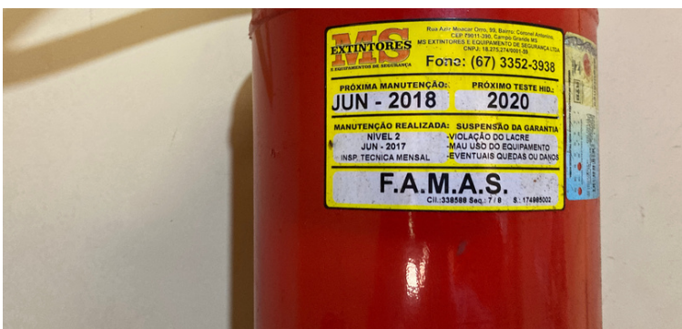
Foto 4 - Extintores com as datas de validade expiradas