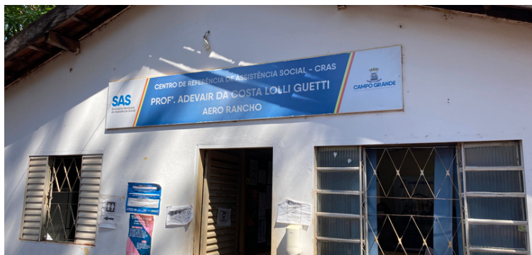
Foto 1 - Fachada do CRAS Professora Adevaír Costa Lolli Guetti