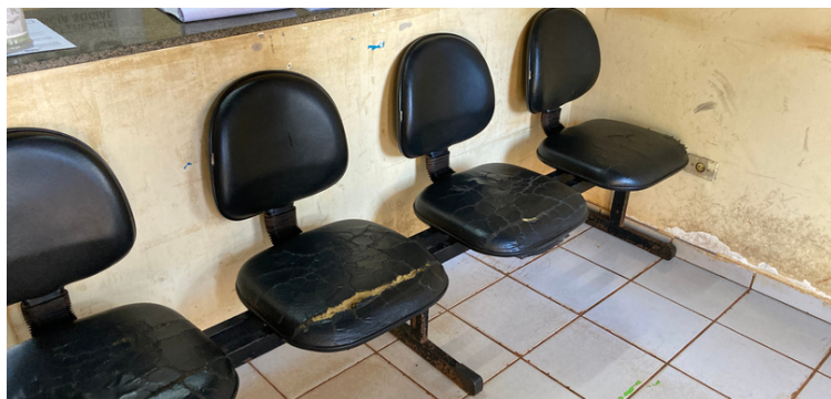
Foto 2 - Móveis da unidade avariados e insuficientes