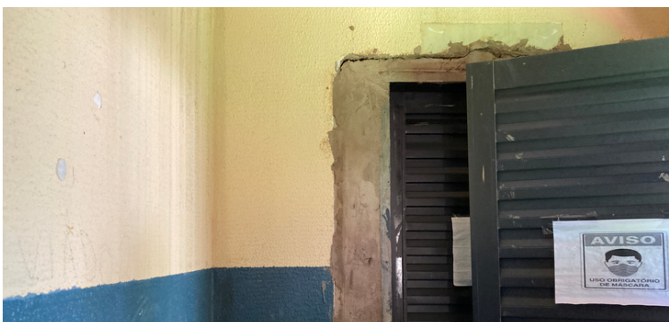
Foto 6 - Rachaduras indicativas da malfeita instalação das portas