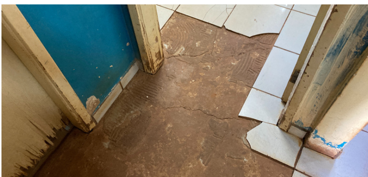
Foto 3 - Pisos quebrados e portas danificadas no setor de cadastro dos usuários