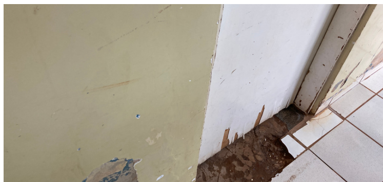
Foto 8 - Assoalhos com pisos quebrados