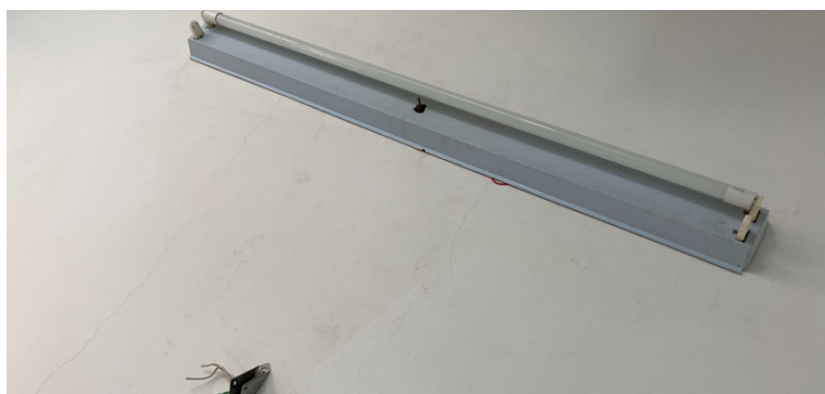
Foto 9 - Luminárias sem lâmpadas e fiação exposta