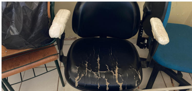
Foto 3 - Mobiliário da unidade precário