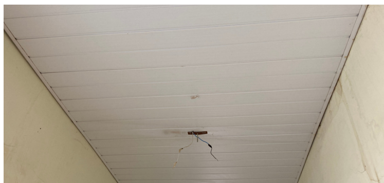
Foto 10 - Rede elétrica sem a devida instalação