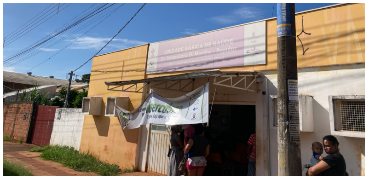
Foto 1 - Fachada da UBS Dr.º Vespasiano B. Martins