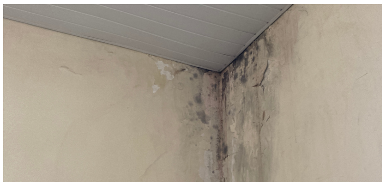
Foto 5 - Paredes da unidade repleta de mofo