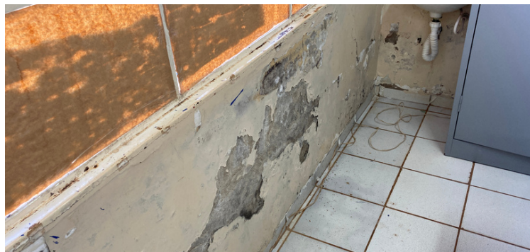
Foto 4 - Infiltrações alastradas pelas dependências da UBS