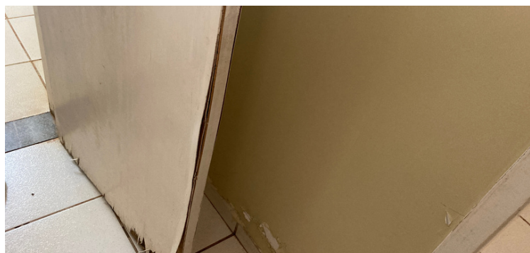
Foto 6 - Portas da repartição encontram-se deterioradas