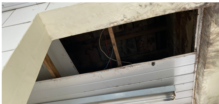
Foto 7 - Forro da UBS avariado