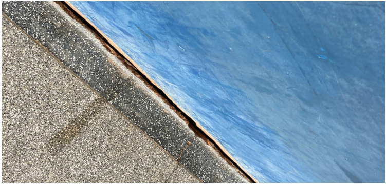
Foto 11 Rachadura causada pelo deslocamento do piso.