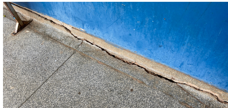
Foto 6 Fissura entre a parede e o piso no corredor.