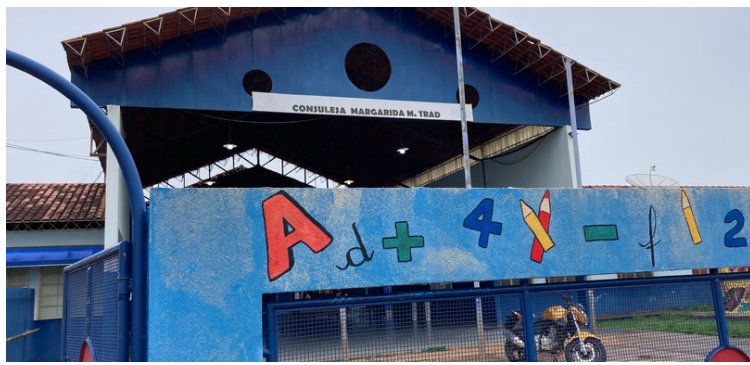
Foto 1 Fachada da Escola Municipal Consulesa Margarida Maksoud Trad.