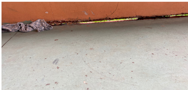
Foto 18 Fissura de grandes proporções no muro da quadra de esportes.