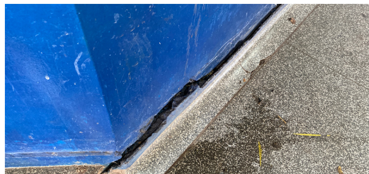
Foto 8 Fissura espessa no rodapé.