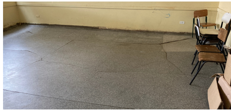
Foto 10 Sala de aula desativada por conta do piso estar cedendo.