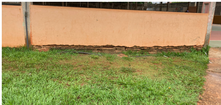
Foto 15 Desnível na quadra de esporte causada pelo deslocamento do chão da escola.