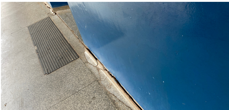
Foto 5 Estrutura do piso cedeu e causou fissura no rodapé.