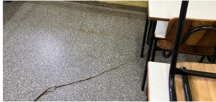
Foto 4 Sala de aula com rachura.