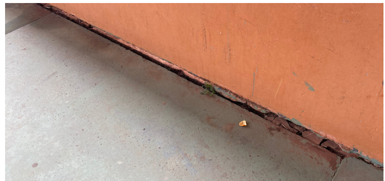
Foto 16 Fissura na quadra de esportes.