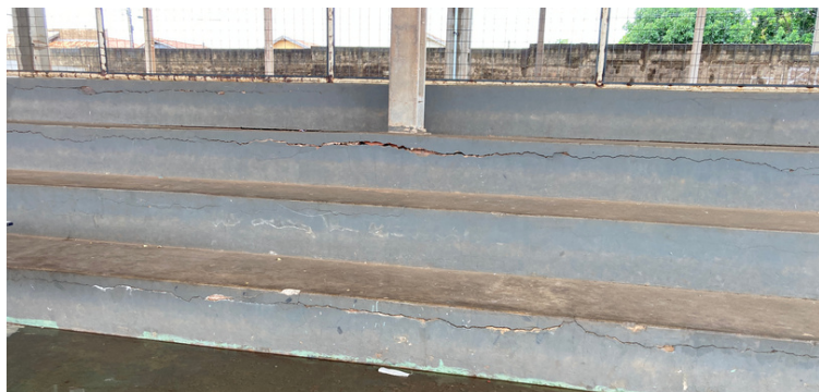
Foto 17 Rachadura na arquibancada da quadra de esportes.