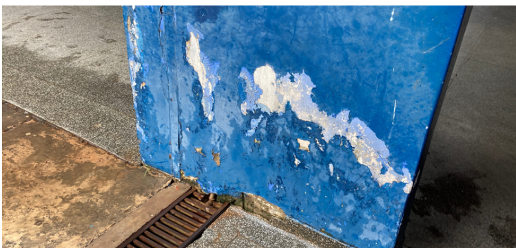
Foto 22 Infiltração na coluna de sustentação próximo ao pátio da escola.