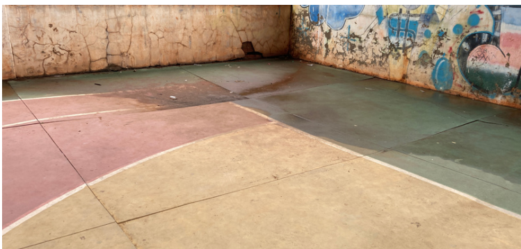
Foto 20 Piso cedendo na quadra de esportes.