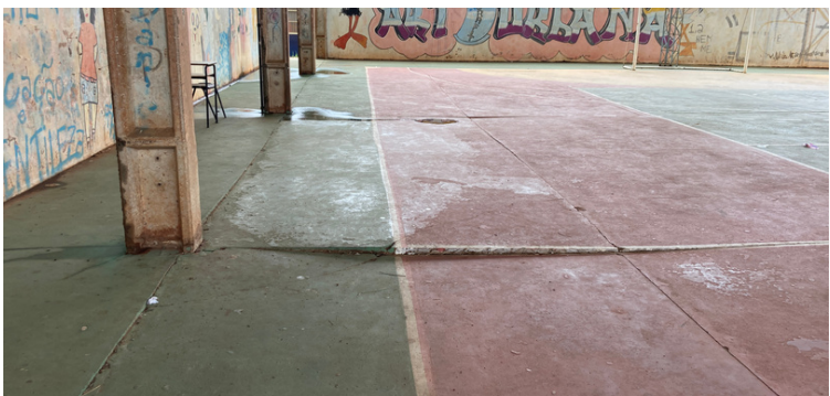
Foto 19 Desnível na quadra de esportes.