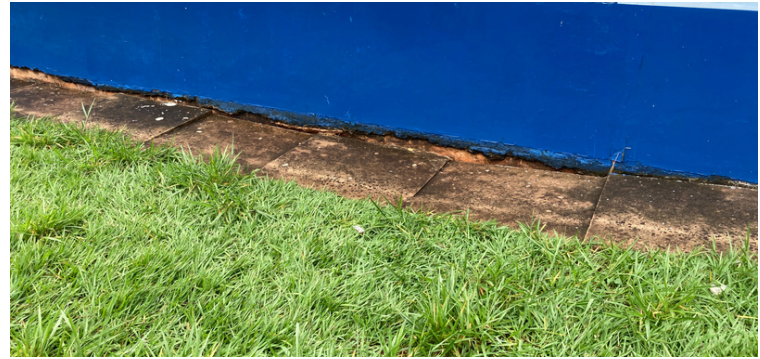
Foto 12 Chão afundando e abrindo fissura na parede próximo a sala de aula.