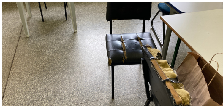
Foto 23 Cadeiras antigas e danificadas.