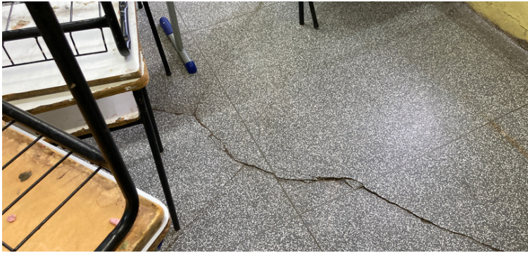
Foto 3 Piso da sala 24 cedeu e causou rachaduras.