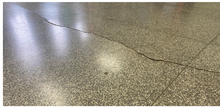
Foto 2 Piso da sala 24 com rachadura.