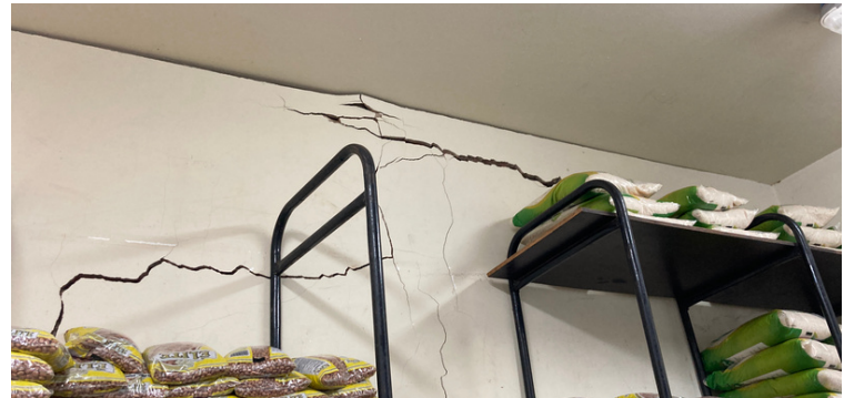
Foto 14 Rachaduras espessas no depósito da cozinha.