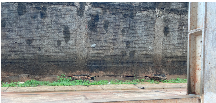
Foto 21 Muro próximo a quadra de esporte com risco de queda por conta do desnível do solo.