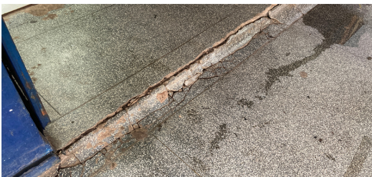
Foto 7 Desnível na entrada da cozinha causado pelo deslocamento do chão da escola.