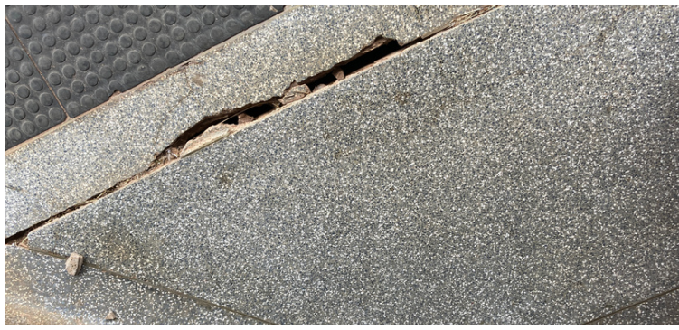
Foto 9 Piso cedendo no corredor da unidade escolar.