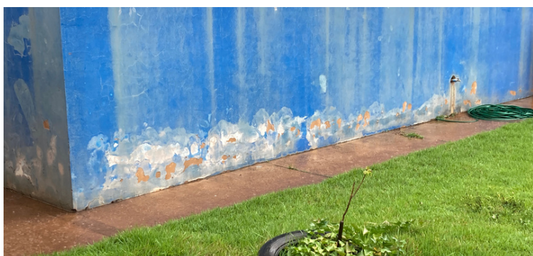
Foto 6 Pintura descascada na área externa da escola.