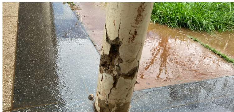
Foto 2 Estrutura de sustentação do corredor danificada, com ferragem aparente.