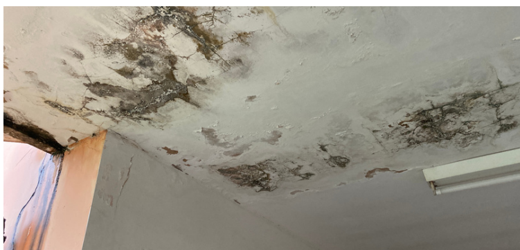
Foto 4 Infiltração com presença de mofo no corredor.