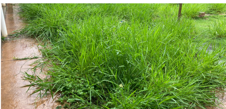
Foto 7 Área verde da escola com necessidade de manutenção.