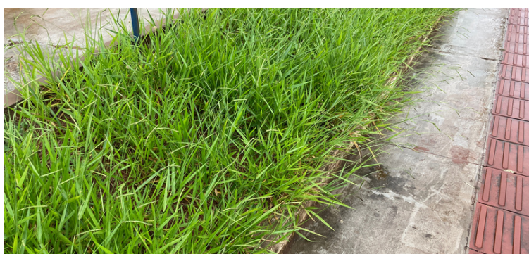
Foto 8 Área verde sem manutenção na entrada da escola.