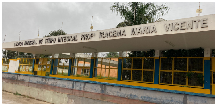
Foto 1 Fachada da Escola Municipal Prof. Iracema Maria Vicente.