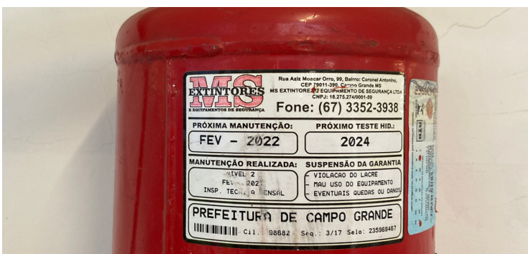
Foto 5 Extintor de incêndio com prazo de validade vencido.