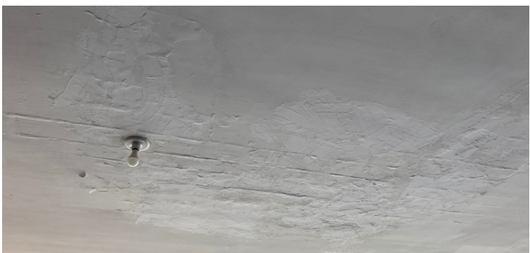
Foto 5 Infiltração no teto na sala de aula.