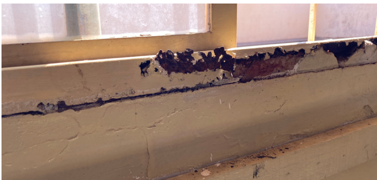
Foto 4 Batente da janela enferrujado e corroído.