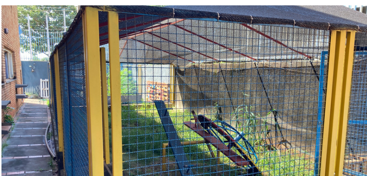
Foto 8 Parquinho interditado por falta de manutenção.