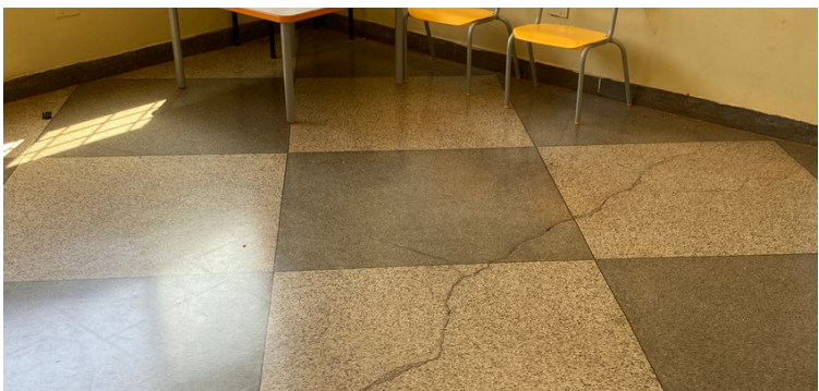
Foto 3 Rachadura em toda a extensão do piso na sala de aula.