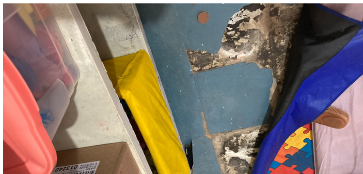
Foto 2 Piso danificado na sala de aula no segundo andar.