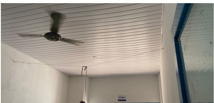
Foto 7 Ventilador em uma das salas de aula com baixa potência.