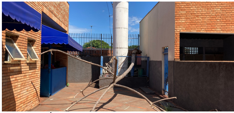
Foto 9 Árvore tombada na área dos fundos da escola.