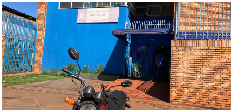
Foto 1 Fachada da EMEI Indubrasil.