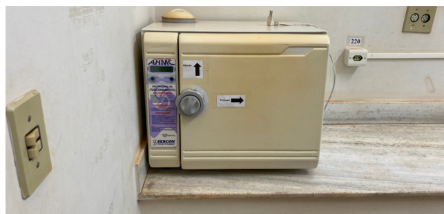
Foto 6 - Autoclave encontra-se estragada, necessitando do devido reparo