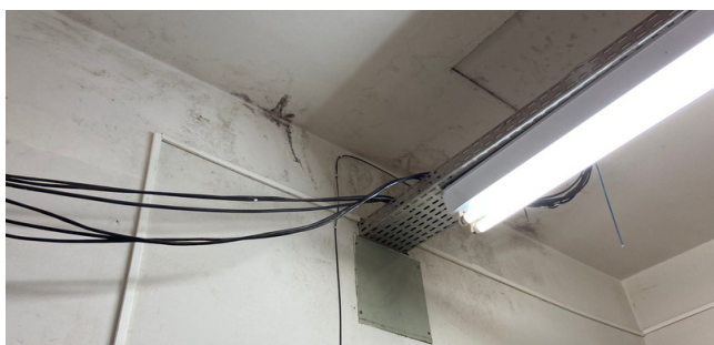
Foto 5 - Infiltrações encontradas em locais pontuais da unidade