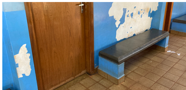
Foto 2 - Paredes com as pinturas avariadas, necessitando revitalização