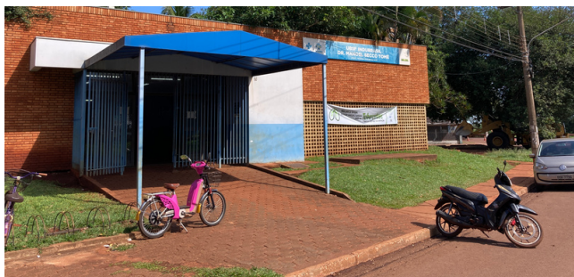
Foto 1 - Fachada da Unidade Básica de Saúde Familiar Drº Manoel Secco