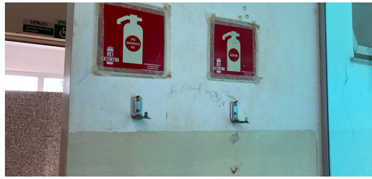
Foto 10 Falta de extintor de incêndio na recepção.