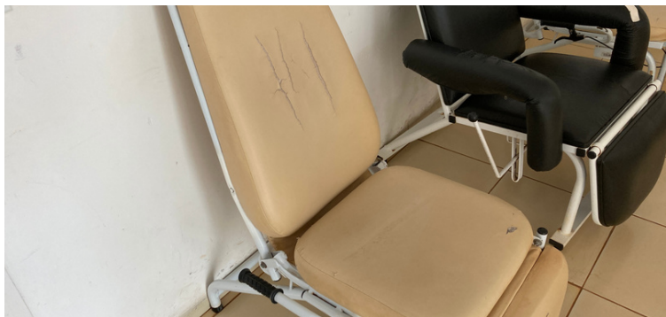
Foto 8 Cadeira rasgada na sala de medicação.