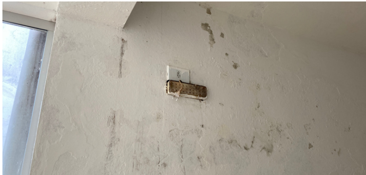
Foto 6 Infiltração na parede do corredor.