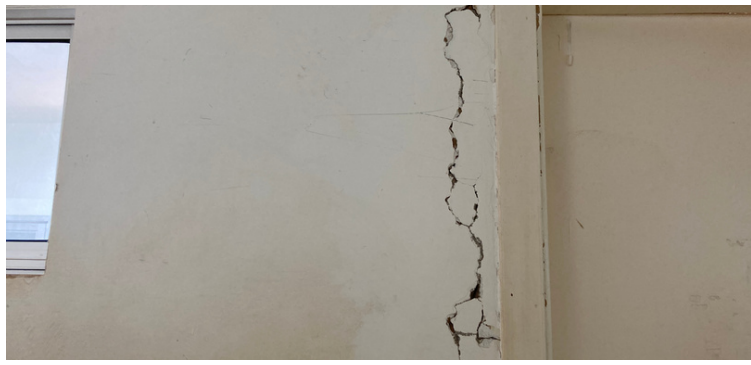
Foto 9 Rachadura próximo a porta de um dos consultórios.