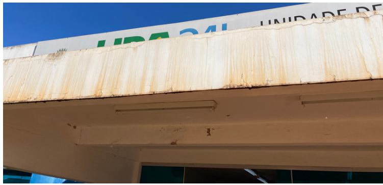
Foto 1 Infiltração na laje de cobertura da entrada da UPA - Santa Mônica.