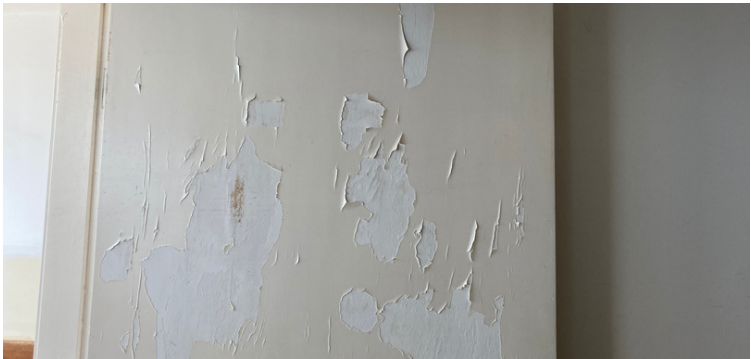
Foto 13 Porta em péssimo estado de conservação.