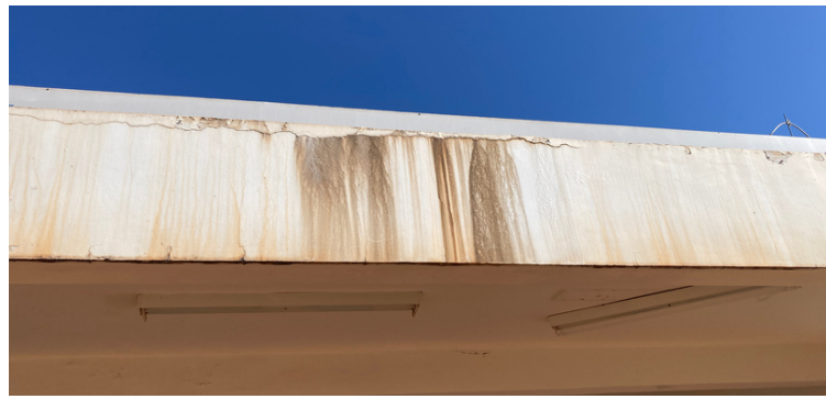
Foto 2 Infiltração na laje da unidade.