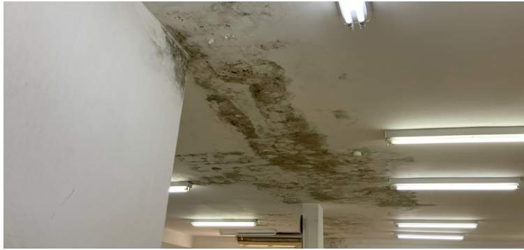
Foto 4 Infiltração com a presença de mofo na sala de observação.