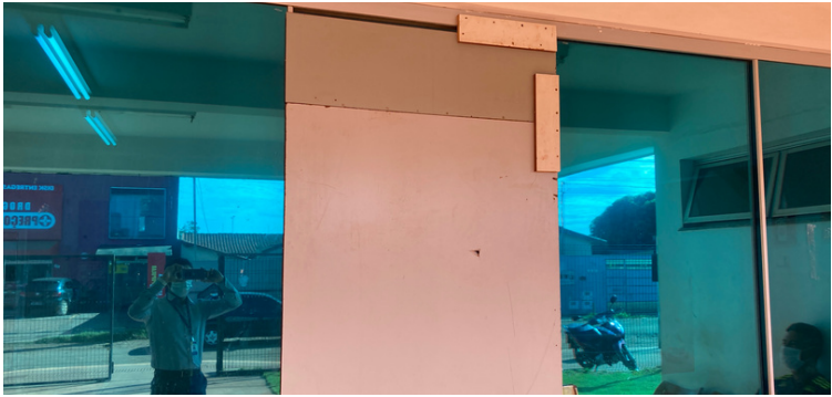
Foto 3 Tapume de proteção em local que o vidro foi danificado.