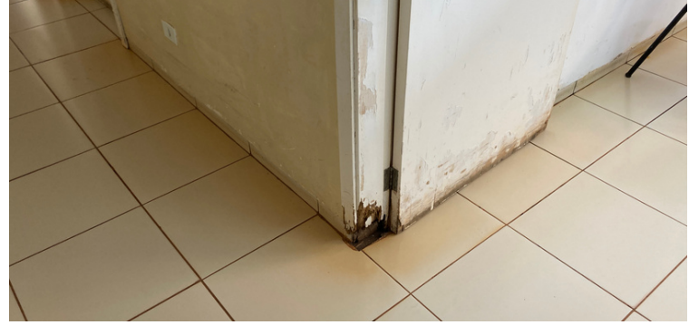
Foto 12 Batente da porta do consultório danificado.