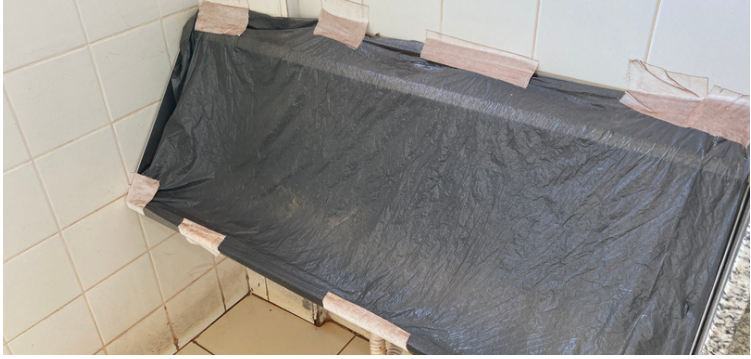
Foto 11 Mictório interditado no banheiro masculino.