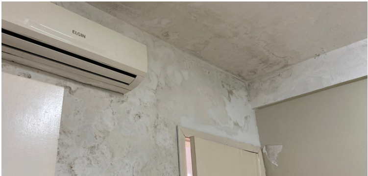
Foto 5 Infiltração na parede e teto em uma das salas.