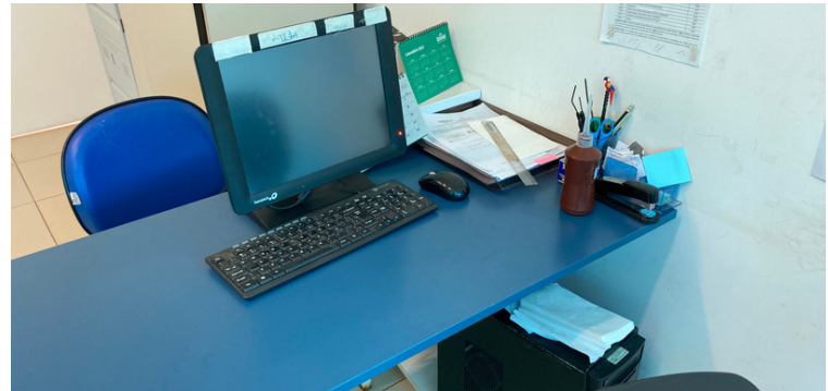
Foto 14 Computador antigo, apresentando lentidão.