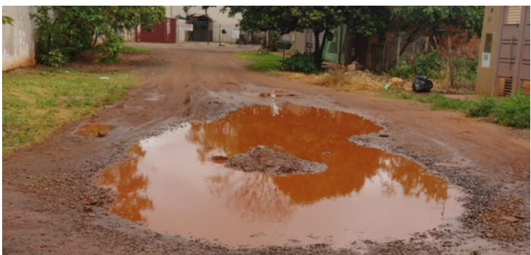
Foto 13 Rua de acesso à unidade de saúde alagada em dia de chuva, prejudicando o acesso de pedestres e veículos