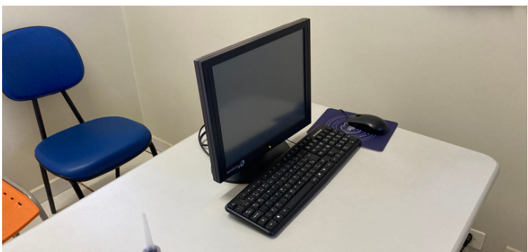
Foto 15 Computador do consultório médico antigo e lento