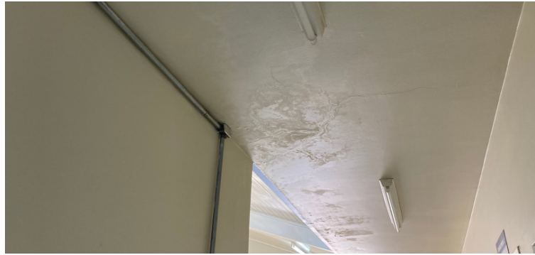
Foto 4 Infiltração no teto do corredor de acesso aos consultórios por falta de manutenção das calhas