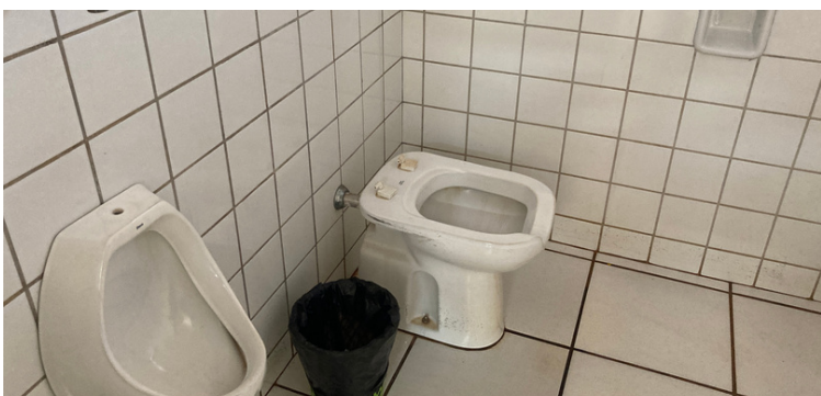
Foto 12 Vaso sanitário do banheiro masculino sem tampa e assento.