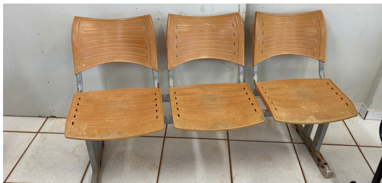
Foto 10 Cadeiras antigas e ressecadas, precisando serem substituídas