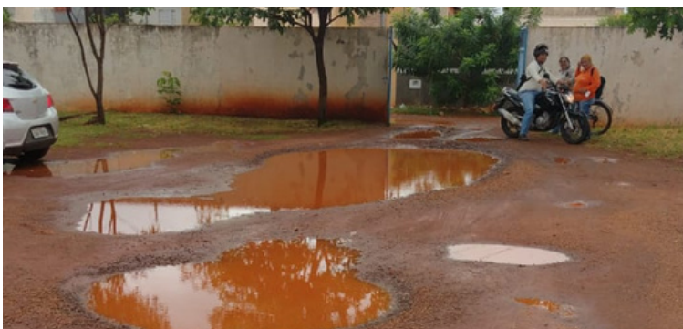
Foto 14 Estacionamento da unidade de saúde alagado após chover, sendo necessário a colocação de pedriscos