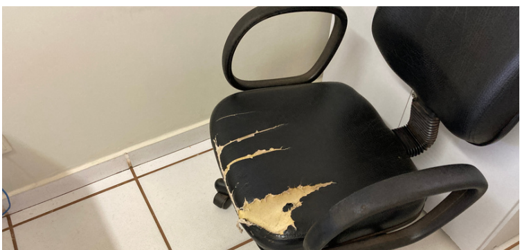
Foto 11 Cadeira do consultório médico rasgada