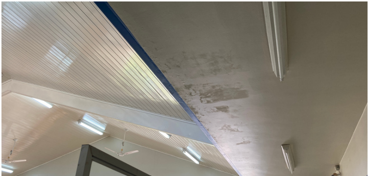
Foto 5 Infiltração no corredor da unidade de saúde