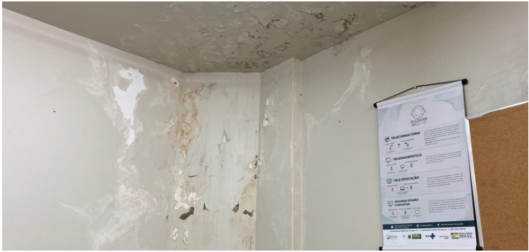
Foto 3 Infiltração no teto e parede da sala multiuso/auditório causada por falta de manutenção das calhas