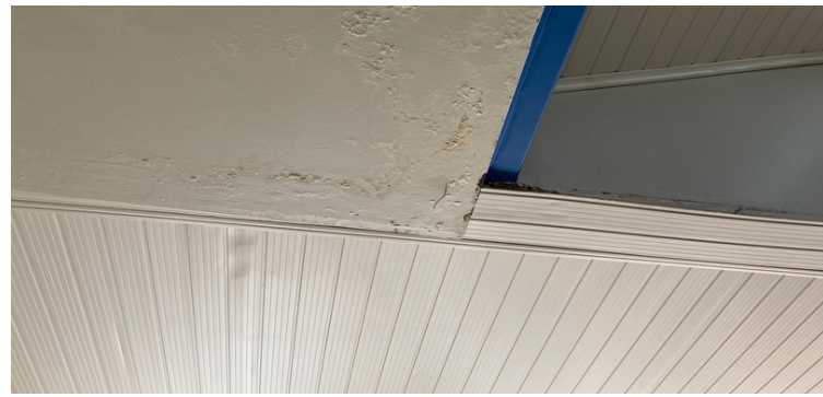
Foto 2 Infiltração no teto do corredor de acesso à recepção ocasionada por falta de manutenção das calhas da unidade de saúde