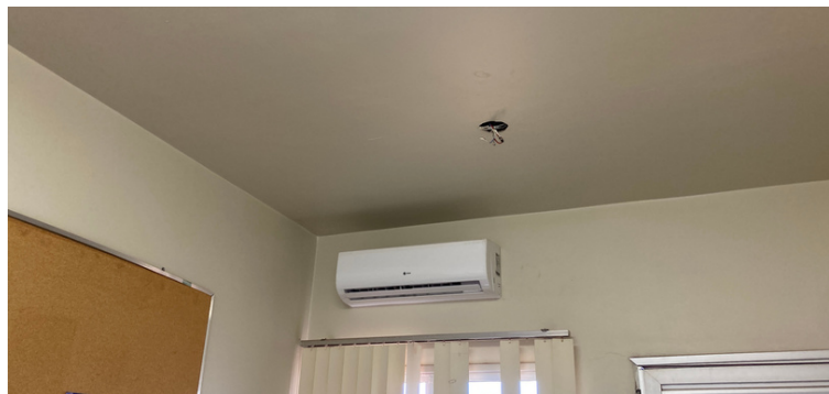
Foto 8 Consultório médico com ar condicionado novo, porém a rede elétrica não suporta que o aparelho funcione, ficando sem refrigeração.