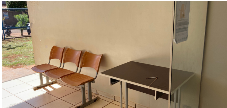
Foto 6 Porta da entrada principal faltando uma folha do vidro, impedindo o trancamento e causando insegurança