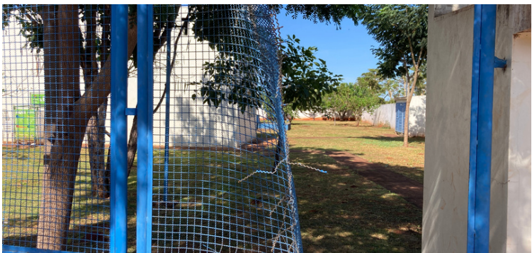
Foto 7 Grades de proteção da frente da unidade danificada, facilitando a entrada de pessoas não autorizadas