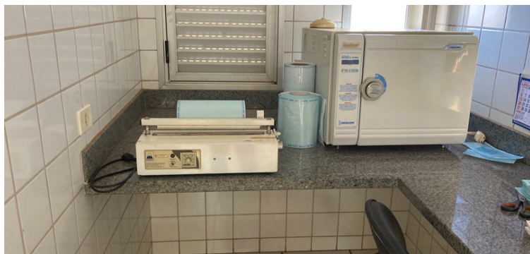
Foto 9 Autoclave e seladora estragadas por falta de manutenção desde outubro de 2021