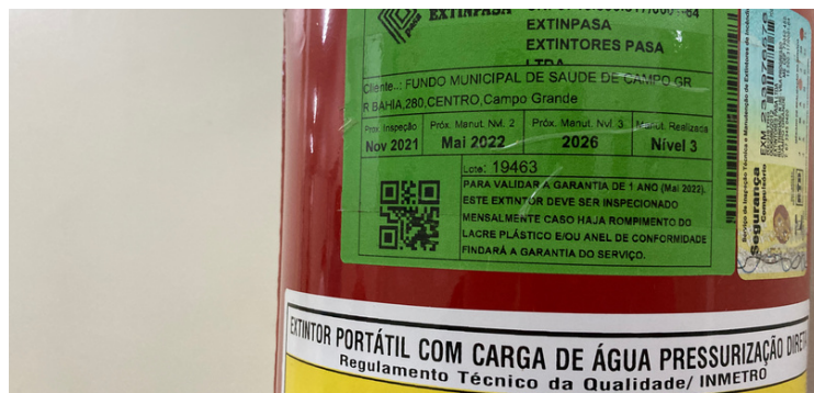
Foto 8 - Extintores validados, porém em pequena quantidade