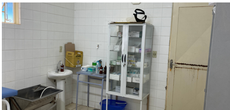
Foto 3 - Porta da sala de curativos repleta de ferrugem