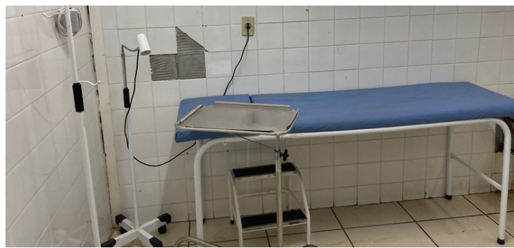
Foto 4 - Azulejos quebrados em um dos consultórios