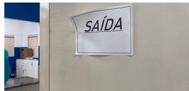
Foto 9 - Identificação da saída de emergência irregular