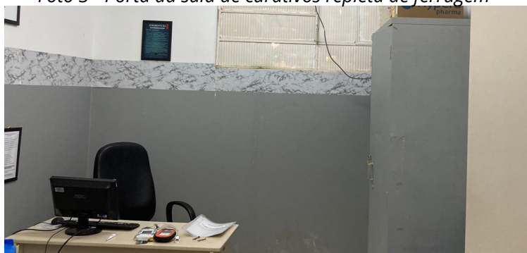
Foto 5 - Computadores, em geral, obsoletos