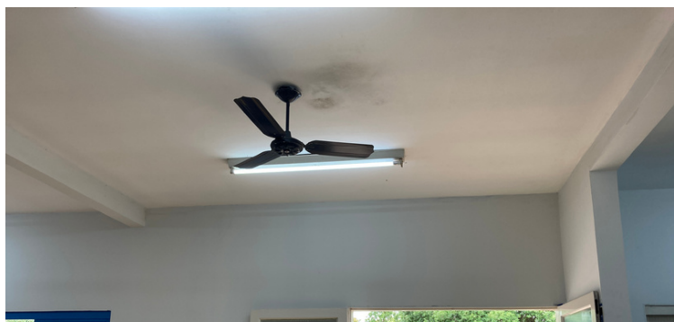
Foto 7 - Ventiladores inoperantes devido à falta de manutenção