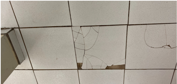
Foto 5 Piso na recepção quebrado.