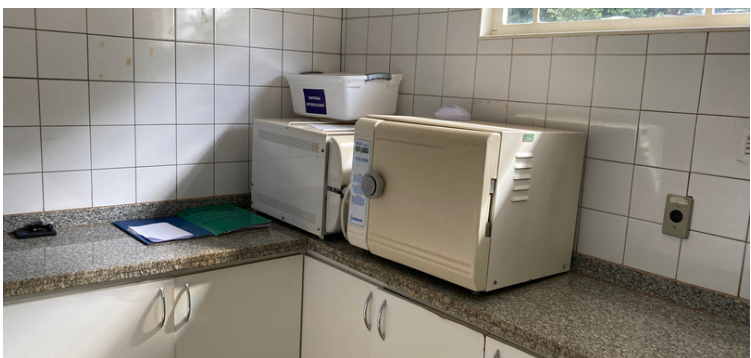
Foto 7 Autoclaves estragadas há mais de dois anos por falta de manutenção.