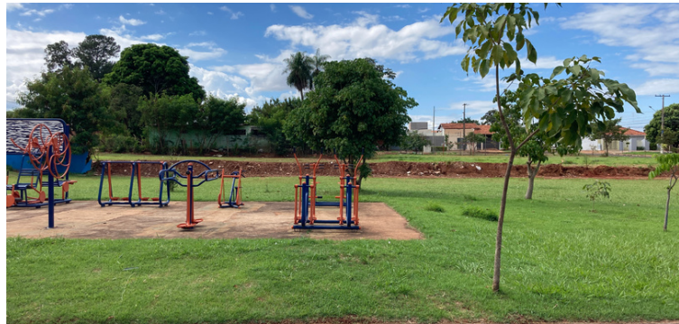
Foto 6 Parte do muro na parte dos fundos da unidade de saúde que caiu em 2019.