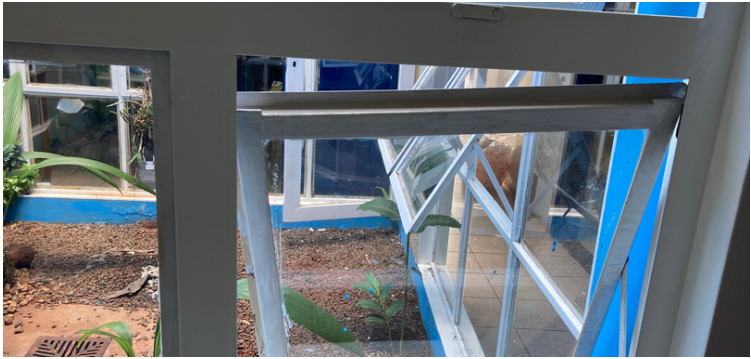
Foto 3 Janela no corredor danificada.