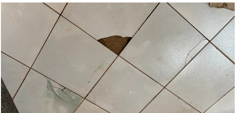
Foto 5 Piso quebrado no corredor de acesso aos consultórios.