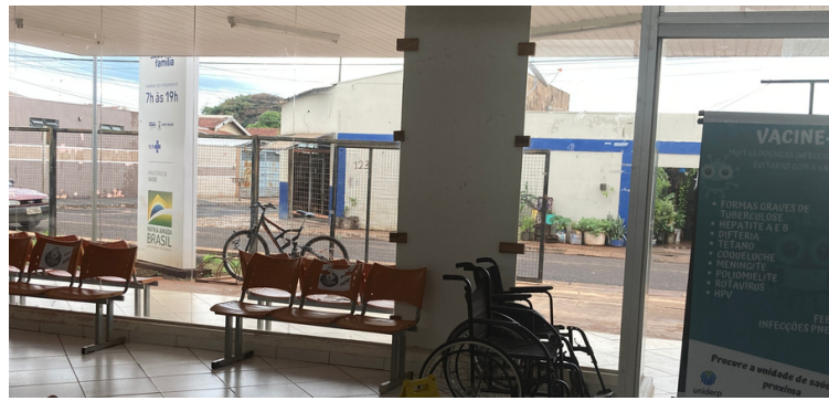
Foto 10 Tapume substituindo vidraça na recepção.