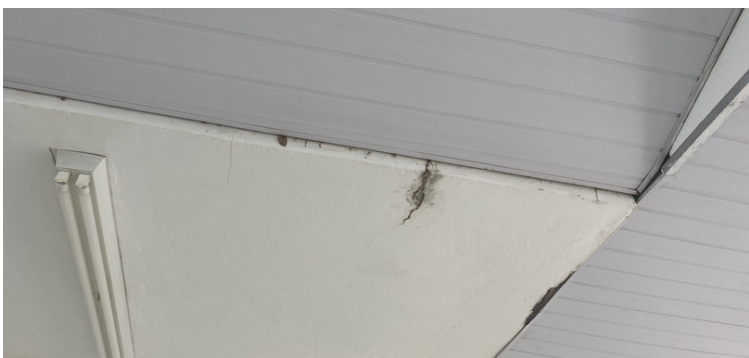
Foto 8 Rachadura causando infiltração na recepção próximo a sala de odontologia.