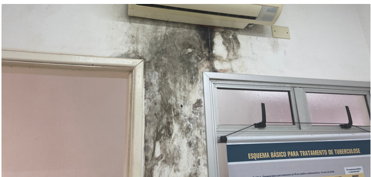
Foto 7 Infiltração grave na parede do consultório 3.