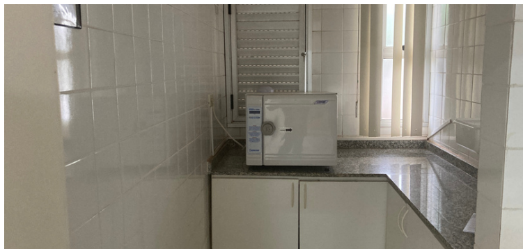
Foto 15 Autoclave estragada por falta de manutenção.