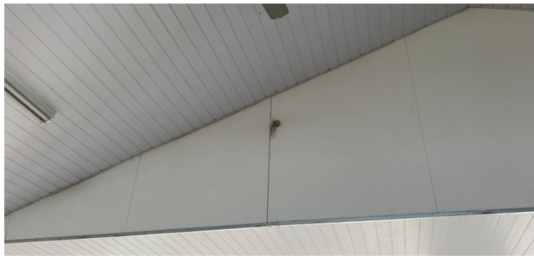
Foto 9 Rachaduras na estrutura da recepção.