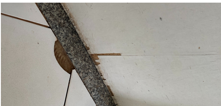
Foto 4 Piso quebrado próximo a porta do consultório 2.