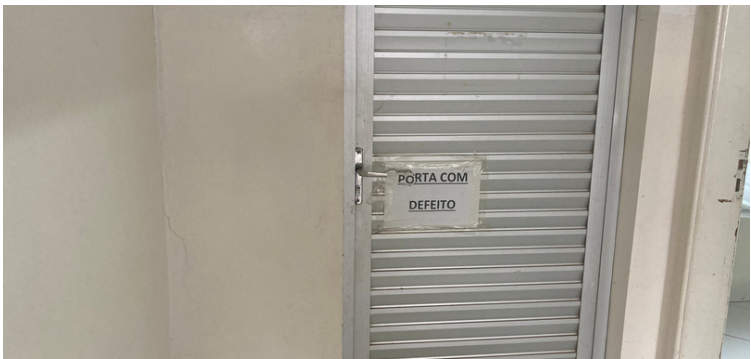
Foto 11 Porta com defeito no corredor lateral próximo a sala de esterilização.