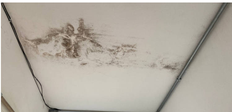
Foto 6 Infiltração no teto próximo a sala da gerência.