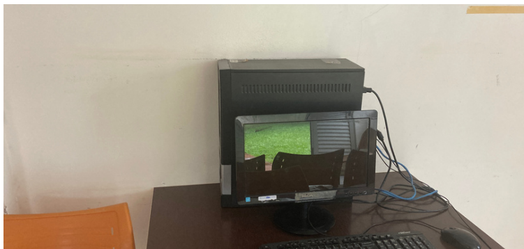
Foto 16 Computador antigo, apresentando lentidão.