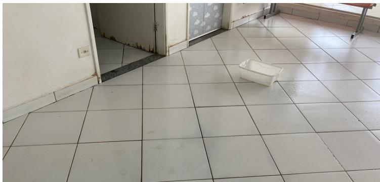
Foto 14 Bacia utilizada para armazenar a água que pingava do teto na recepção.