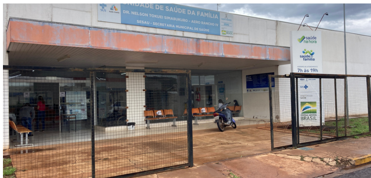
Foto 1 Fachada da Unidade de Saúde da Família Dr. Nelson Tokuei Simabukuro.