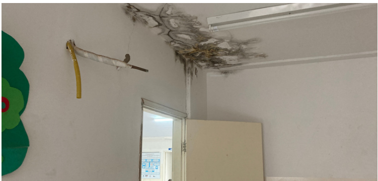
Foto 13 Infiltração próximo a porta do auditório.