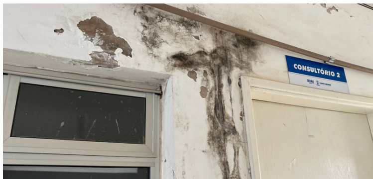
Foto 2 Infiltração com presença de mofo na parede do corredor.