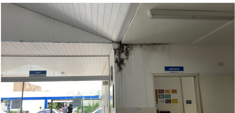
Foto 3 Infiltração com mofo na recepção ao lado do auditório.