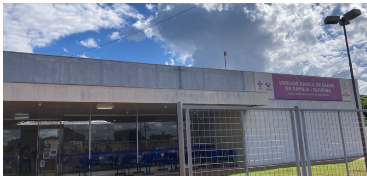
Foto 1 Fachada da unidade de saúde