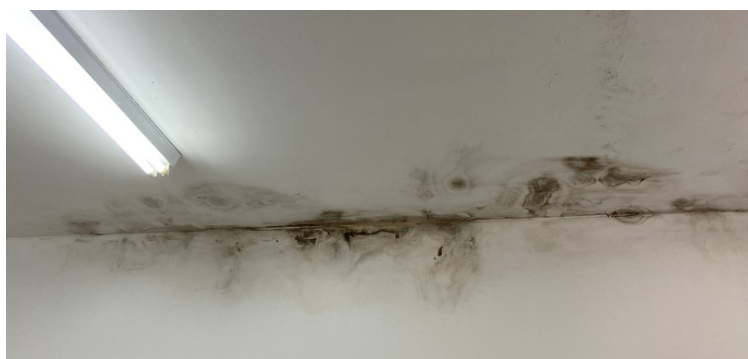
Foto 5 Infiltração no teto do auditório