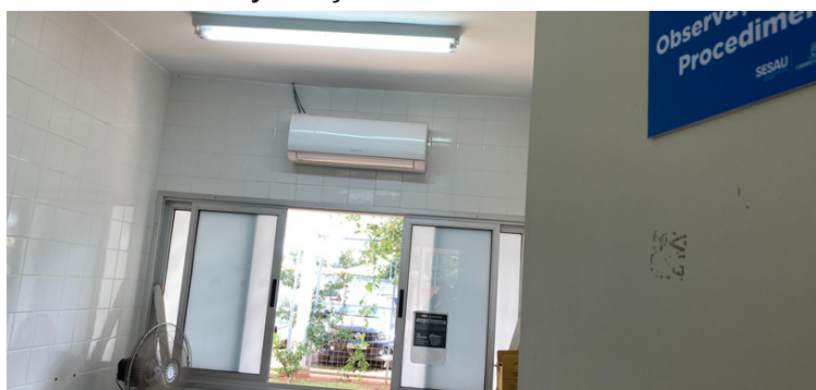
Foto 7 Ar-condicionado estragado na sala de observação