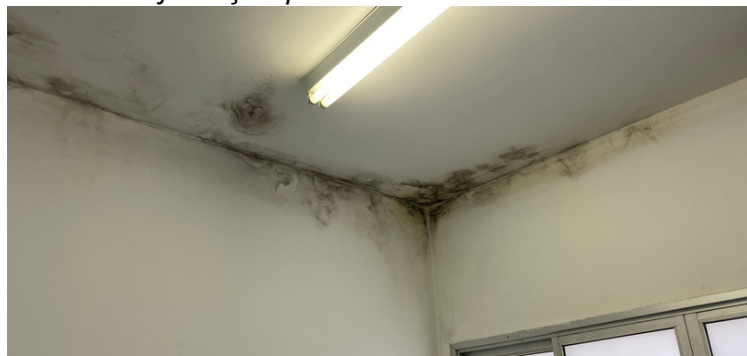
Foto 4 Infiltração no auditório