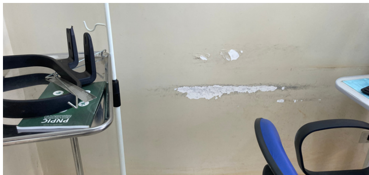
Foto 3 Parede do consultório descascando