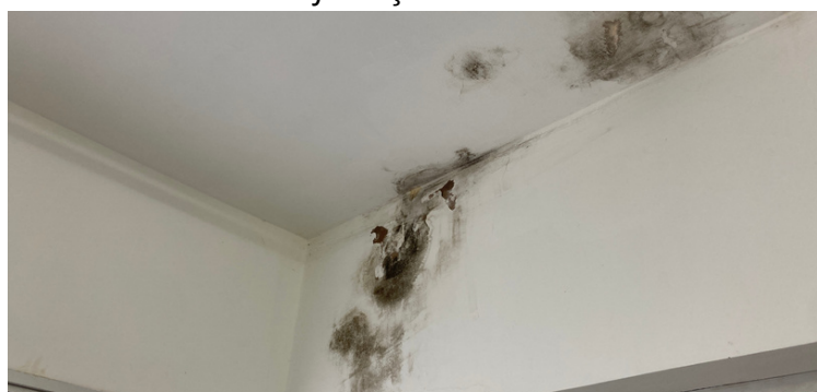
Foto 6 Infiltração na parede do auditório