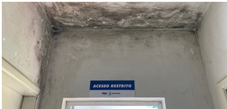
Foto 2 Infiltração próximo ao consultório médico