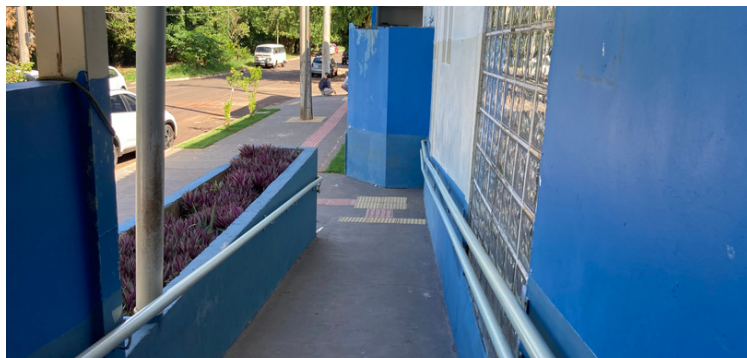
Foto 2 Rampa de acessibilidade