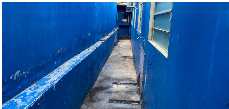
Foto 3 Corredor atrás da unidade