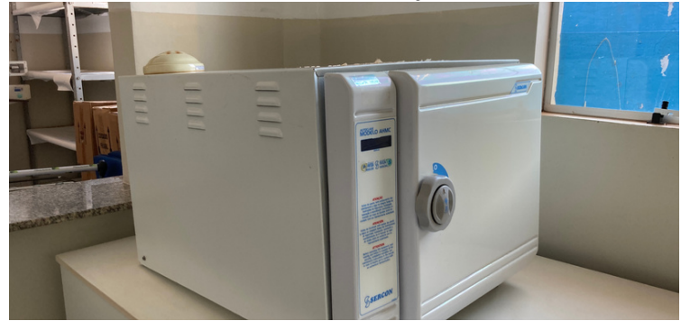
Foto 14 Autoclave quebrada