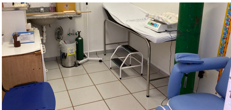
Foto 5 Sala de pediatria