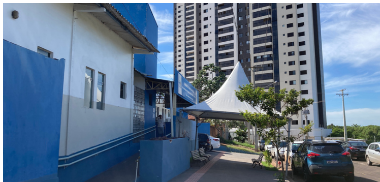
Foto 1 Entrada da unidade