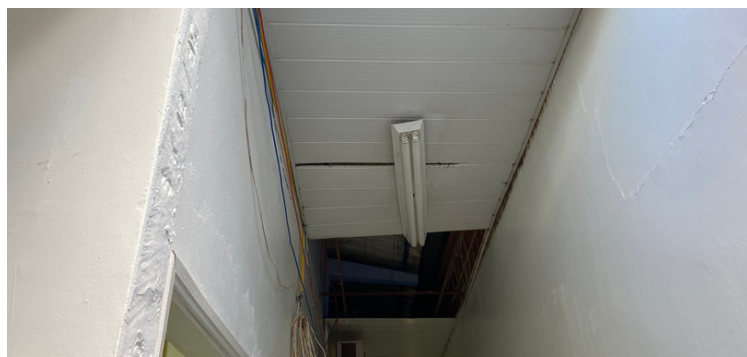
Foto 6 Teto sem forro