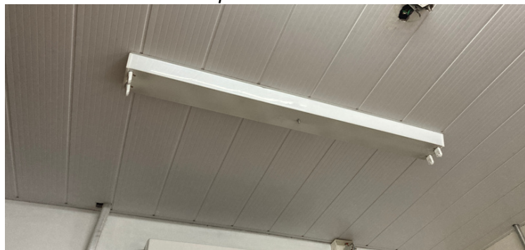
Foto 4 Falta de luminária