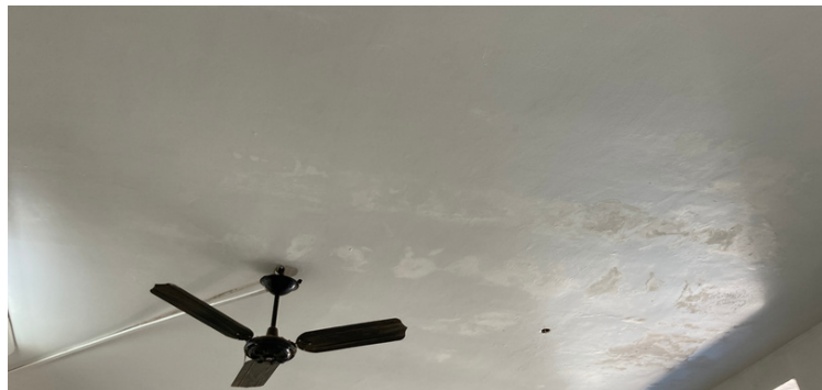
Foto 8 Infiltração