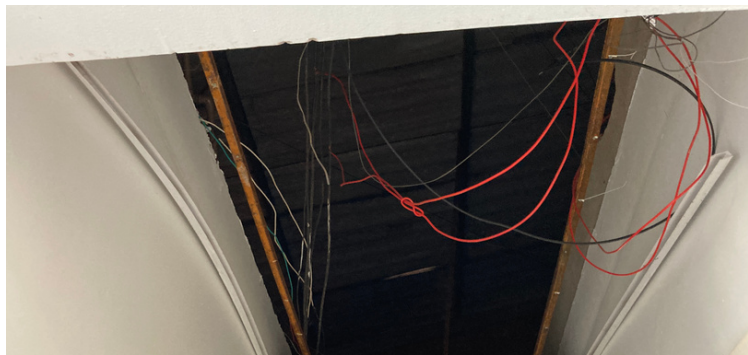
Foto 7 Fiação exposta