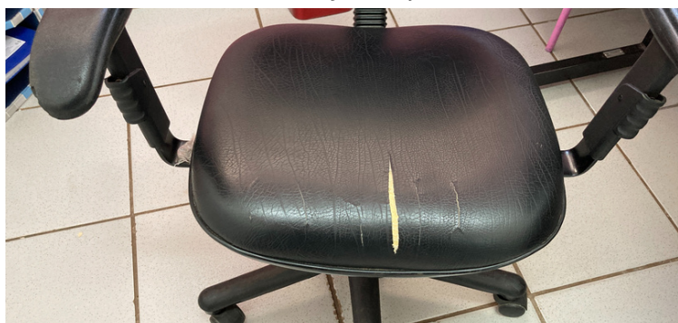
Foto 9 Cadeira desgastada