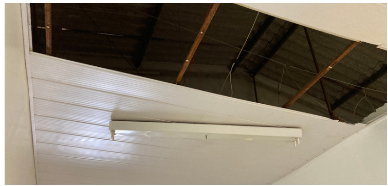
Foto 12 Teto sem forro