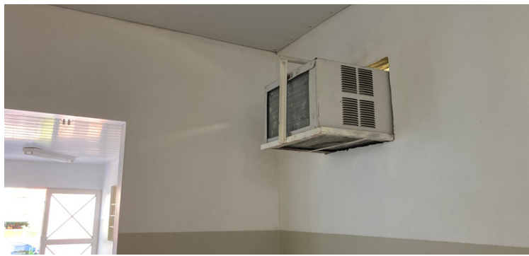
Foto 11 Ar-condicionado instalado incorretamente