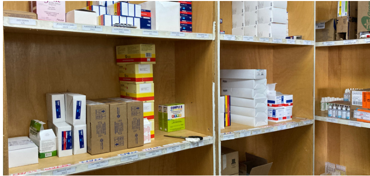
Foto 13 F3rmacia