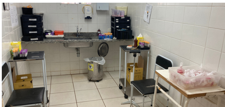
Foto 9 - Sala de coleta sem devida climatização