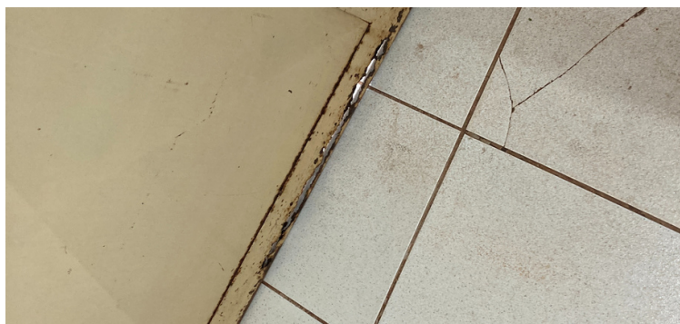
Foto 5 - Rachaduras nos pisos da unidade