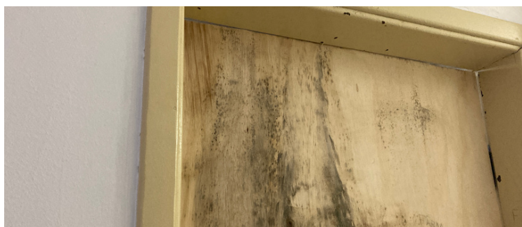
Foto 7 - Mofo na porta da farmácia