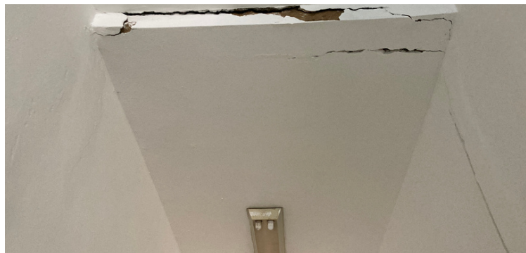
Foto 2 - Rachaduras nas dependências da UBS