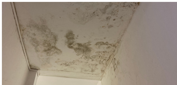
Foto 8 - Teto do corredor lateral à farmácia repleto de mofo