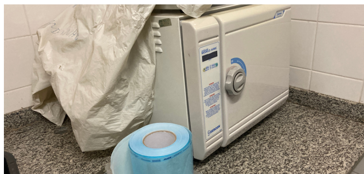
Foto 10 - Auto clave danificada