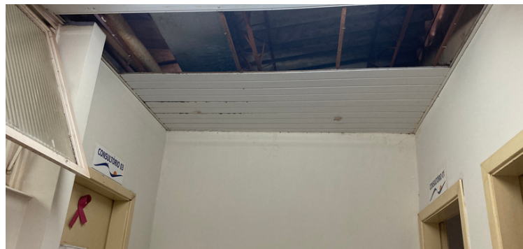
Foto 4 - Parte do forro da repartição comprometido