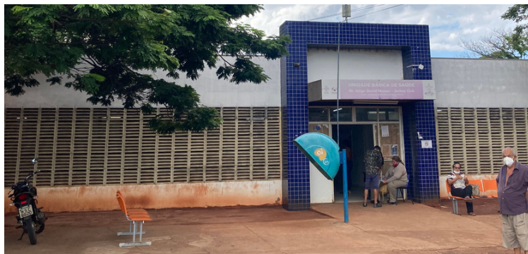
Foto 1 - Fachada da UBS necessitando ser revitalizada