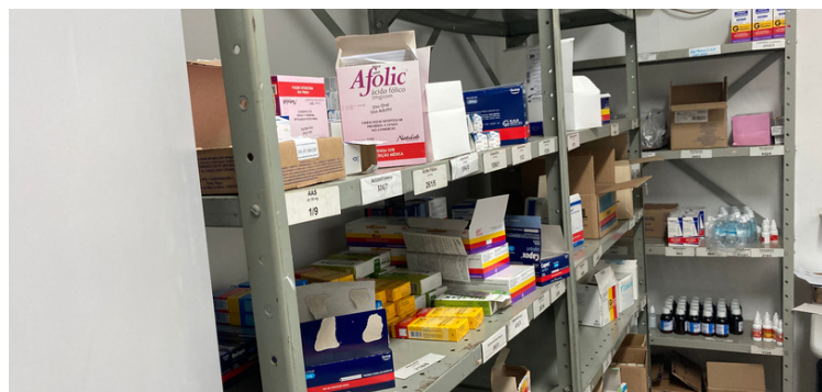
Foto 6 - Farmácia desprovida e insalubre