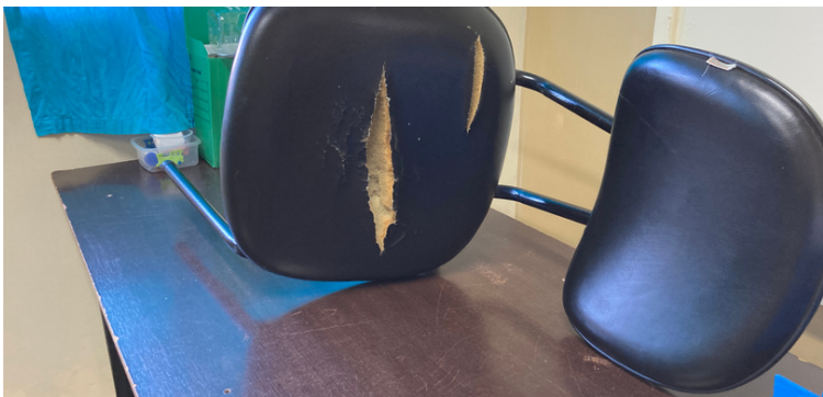
Foto 5 - Mobiliário da unidade necessitando de manutenção ou troca.