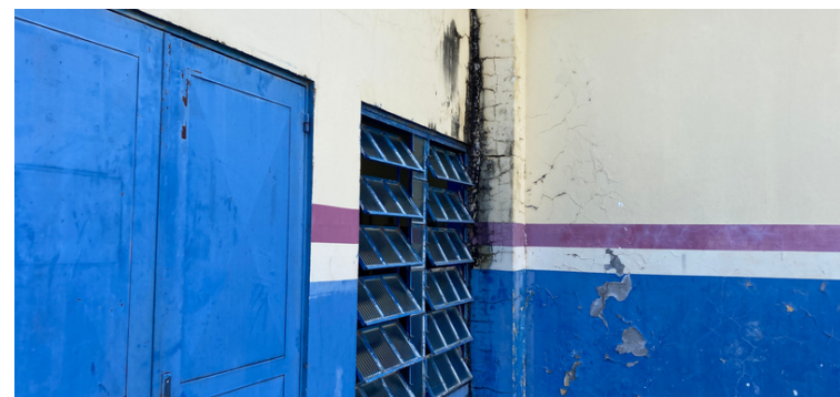
Foto 8 - Rachaduras e infiltrações em locais pontuais da unidade.