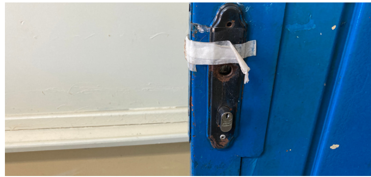
Foto 4 - Portas encontradas avariadas, sem as mínimas condições de uso.