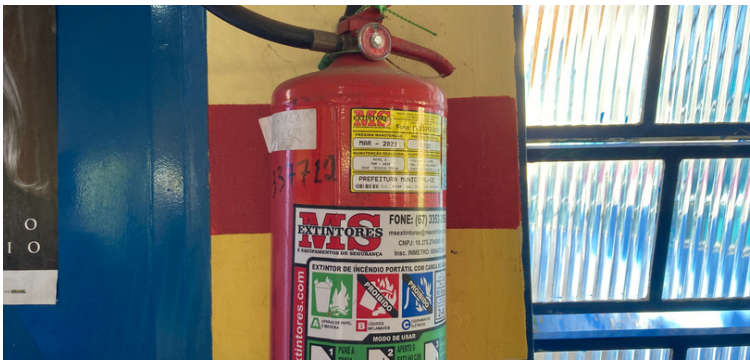
Foto 3 - Extintores com a data de validade vencida.