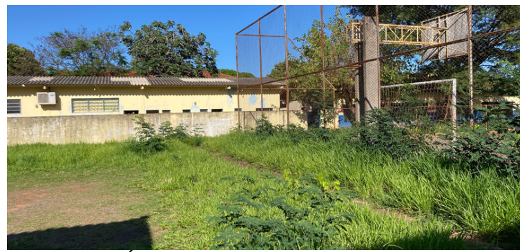
Foto 2 - Área verde do centro necessitando da devida manutenção.