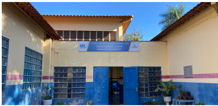
Foto 1 - Fachada do Cras Carlinda Pereira Contar.