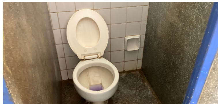
Foto 6 - Necessária manutenção dos banheiros.