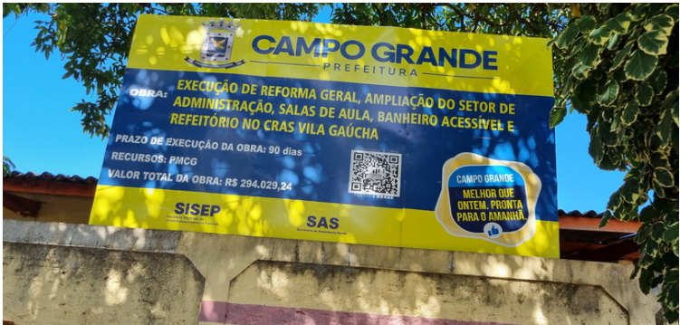
Foto 5 Placa com informações da referida obra.