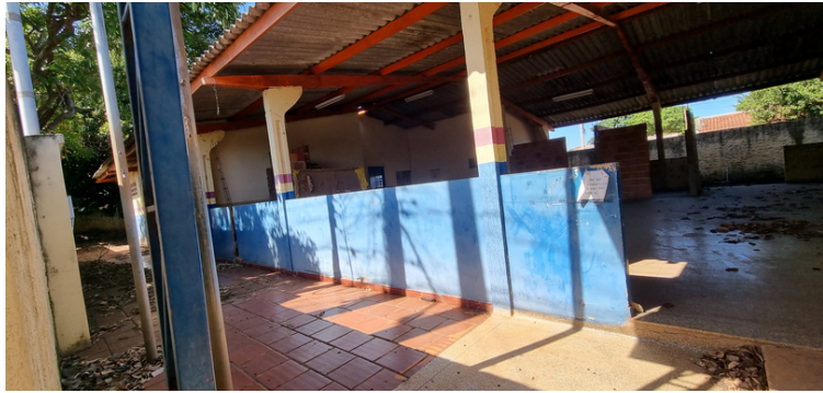
Foto 4 Parte dos fundos do CRAS desativado.