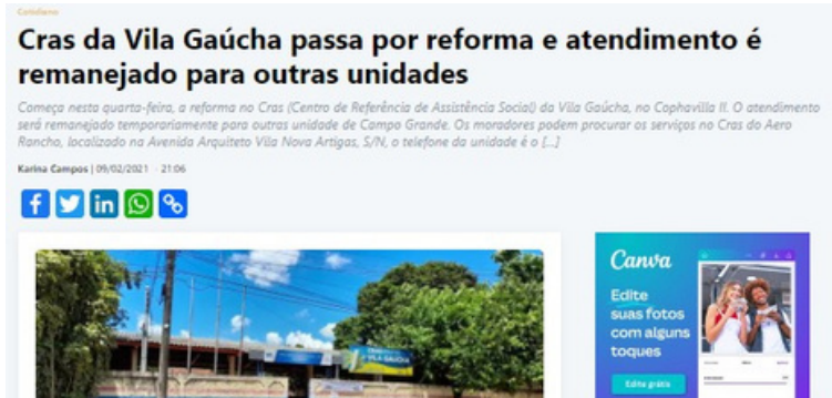
Foto 6 Notícia informando o início das obras no CRAS.