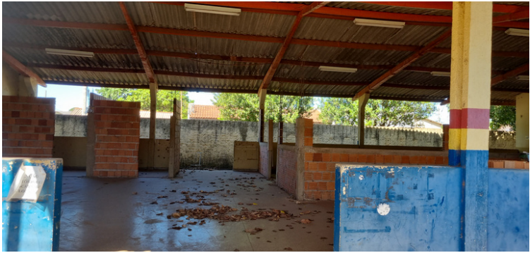
Foto 3 Parte interna da obra parada.