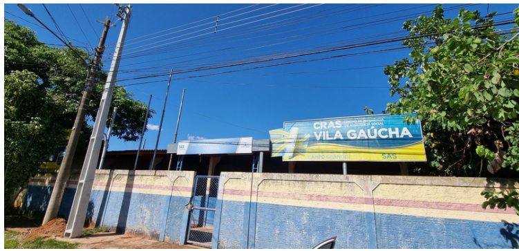
Foto 1 Fachada do CRAS Vila Gaúcha.