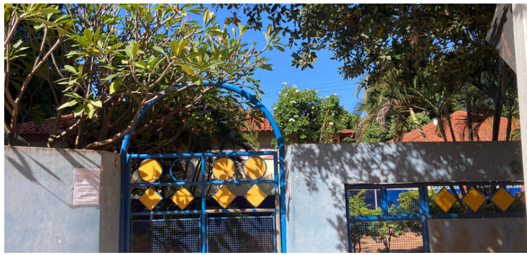
Foto 1 - Fachada do EMEI João Garcia Carvalho Filho.