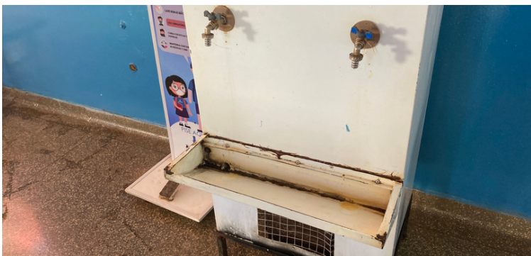
Foto 3 - Bebedouro oxidado totalmente insalubre.