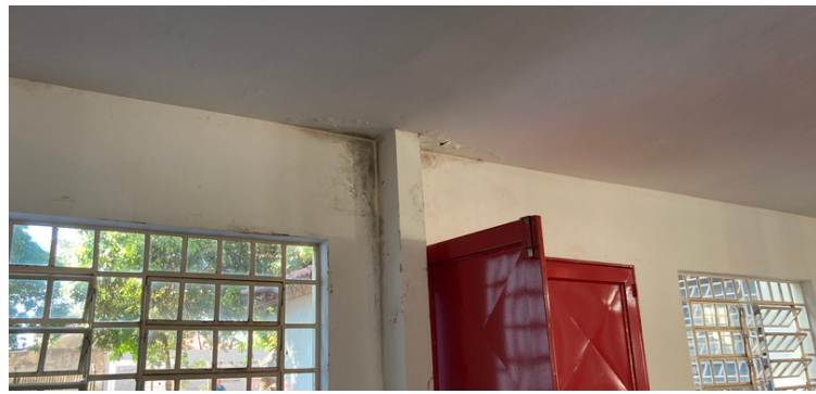
Foto 2 - Infiltrações em locais pontuais da unidade.