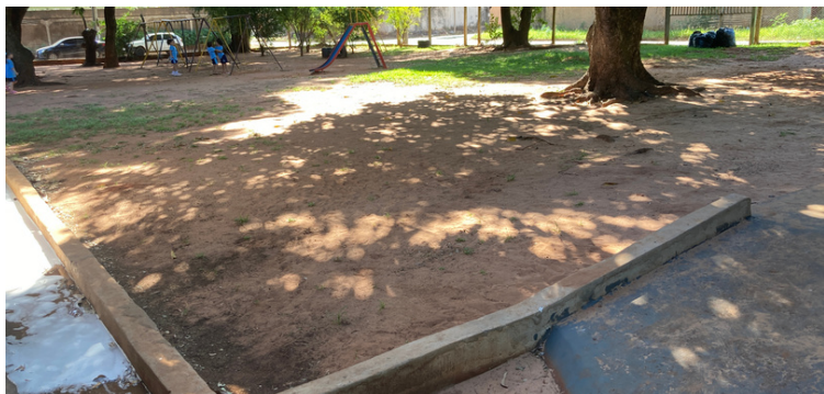
Foto 6 - Área de recreação infantil ampla e conservada.