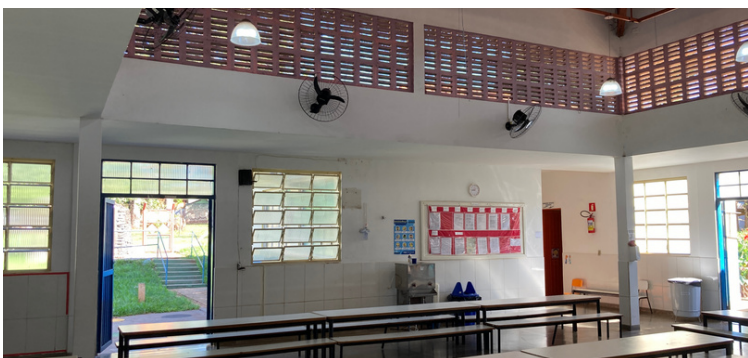
Foto 7 - Arquitetura do refeitório acarreta na entrada de água pluvial.