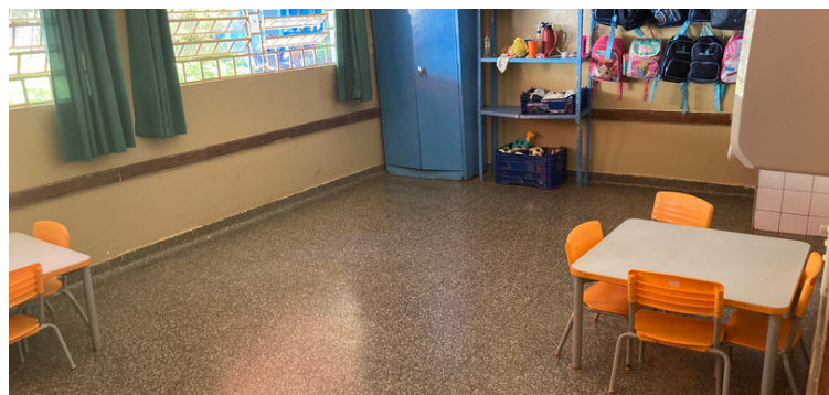
Foto 8 - Salas de aulas devidamente equipadas e climatizadas.