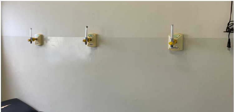
Foto 5 - Rede de oxigênio necessitando de manutenção.