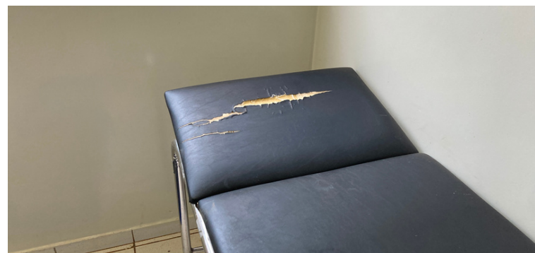
Foto 8 - Macas dos consultórios rasgadas precisando ser substituídas ou consertadas.