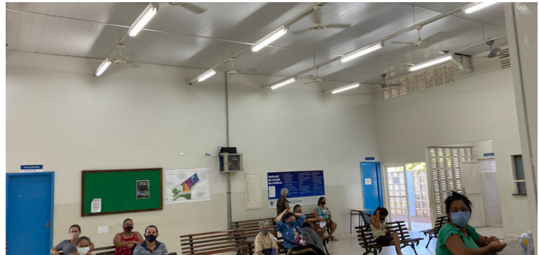
Foto 6 - Recepção da unidade necessitando de acomodações para os usuários.