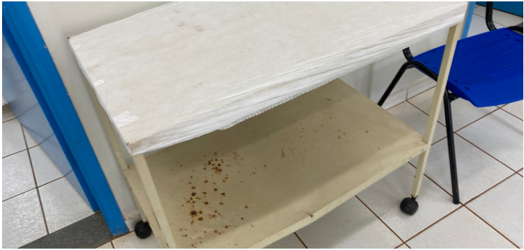
Foto 3 - Móveis da unidade enferrujados ou estragados.