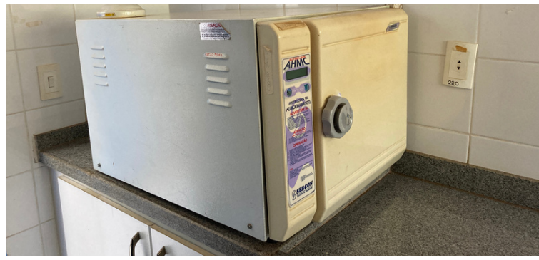
Foto 2 - Autoclave avariada há mais de dois anos.