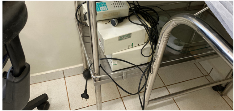
Foto 4 - Equipamentos médicos, como sonar e esfigmo, encontram-se avariados.