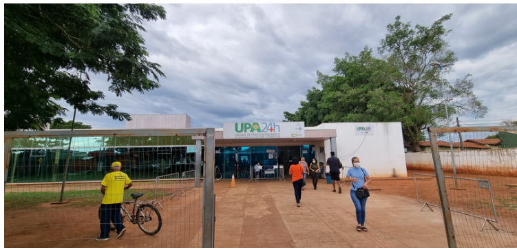
Foto 1 Fachada UPA Leblon.