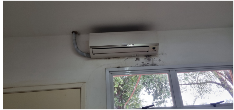
Foto 4 Infiltração com mofo na parede causada por vazamento no ar-condicionado.