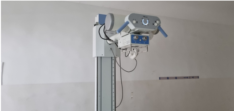
Foto 19 Aparelho de raio-X adquirido recentemente pela unidade.