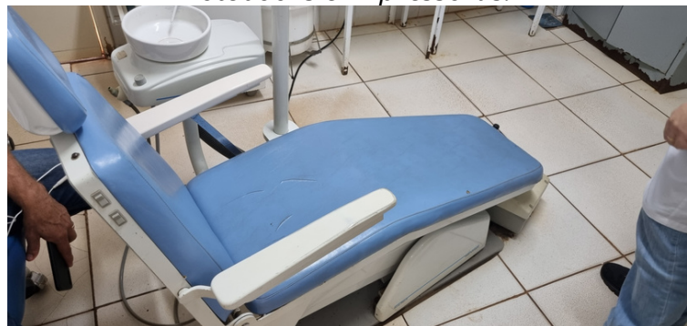
Foto 16 Cadeira odontológica antiga e enfrenta problemas com frequência.