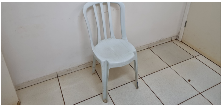
Foto 7 Cadeira onde o paciente é atendido no consultório médico.