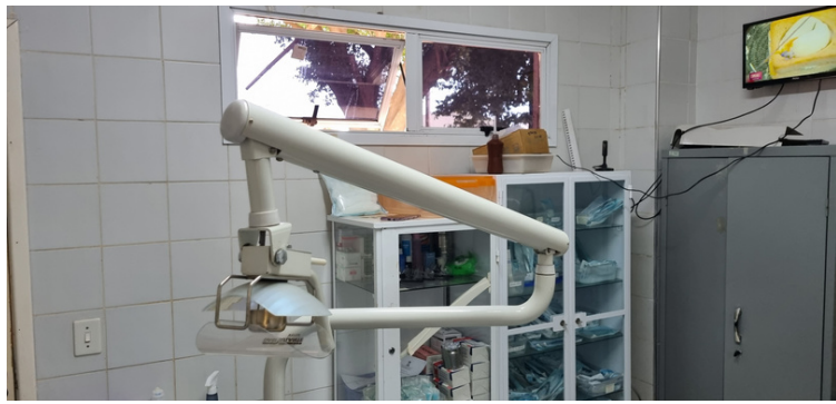
Foto 17 Sala da odontologia muito pequena, suportando apenas um atendimento por vez.