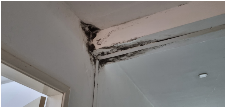
Foto 5 Infiltração próximo a coluna de sustentação no corredor da unidade.