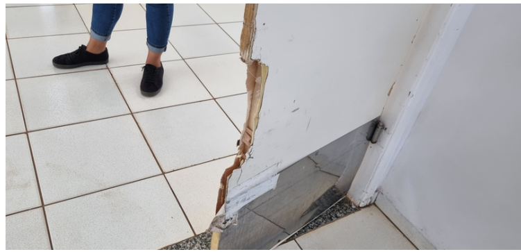
Foto 10 Portas das salas de emergência danificadas.