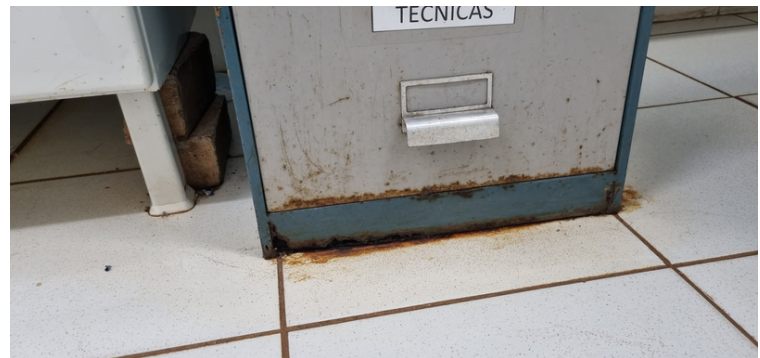
Foto 8 Armário enferrujado.