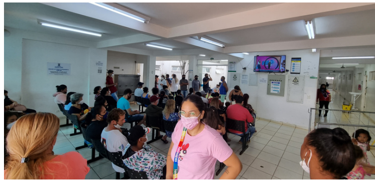
Foto 18 Recepção muito pequena diante da demanda de pacientes que a unidade atende.