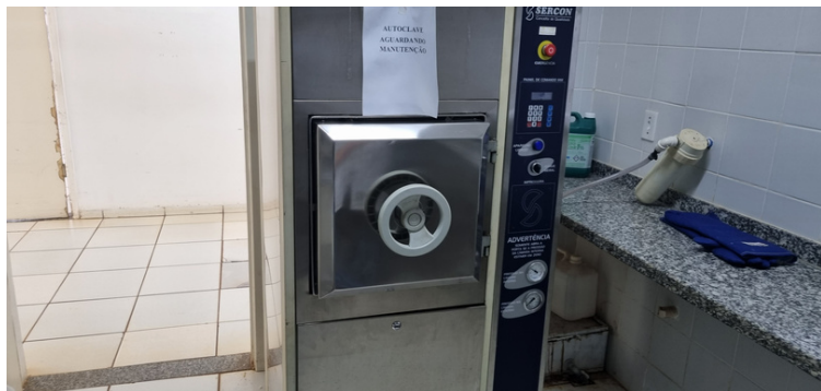
Foto 15 Autoclave estragada há mais de um ano.