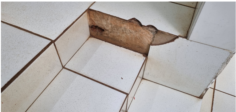
Foto 11 Pisos quebrados na sala de emergência.