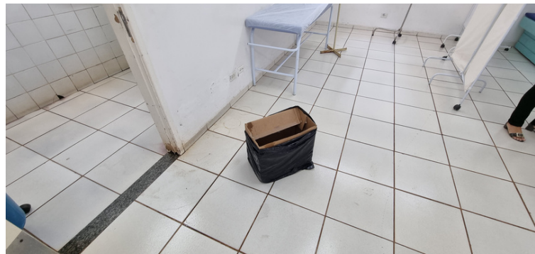
Foto 12 Goteiras na emergência adulta.