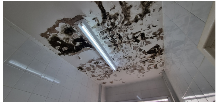
Foto 6 Infiltração com mofo na emergência pediátrica.