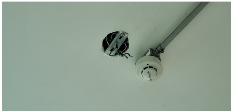
Foto 9 Fiação exposta no teto do corredor.