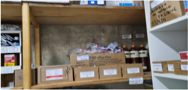
Foto 3 Mofo na parede da farmácia interna.