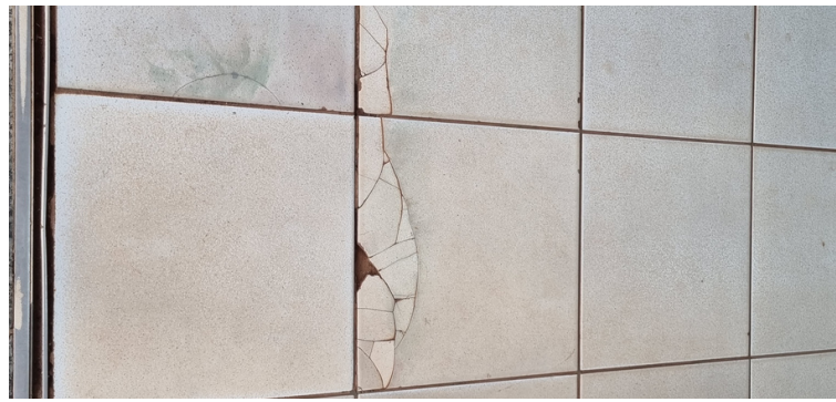
Foto 2 Piso quebrado na entrada da UPA.