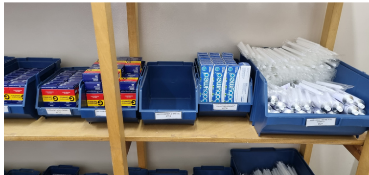
Foto 20 Prateleiras com falta de medicamentos na farmácia.