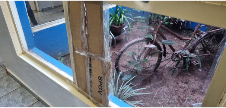
Foto 3 Vidro da janela quebrado.