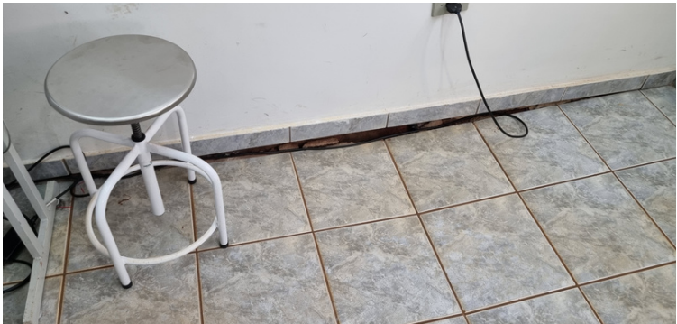
Foto 13 Piso do consultório cedendo, causando uma fenda entre a parede e o piso.