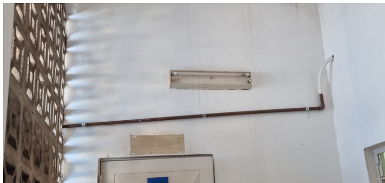
Foto 15 Luminária sem lâmpada na entrada da unidade.