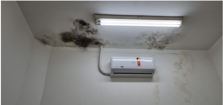
Foto 11 Infiltração na parede e teto da farmácia com a presença de fungos.