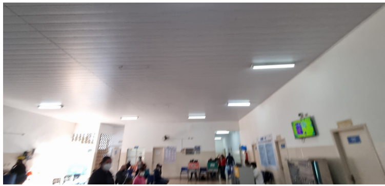
Foto 17 Recepção carente de iluminação.