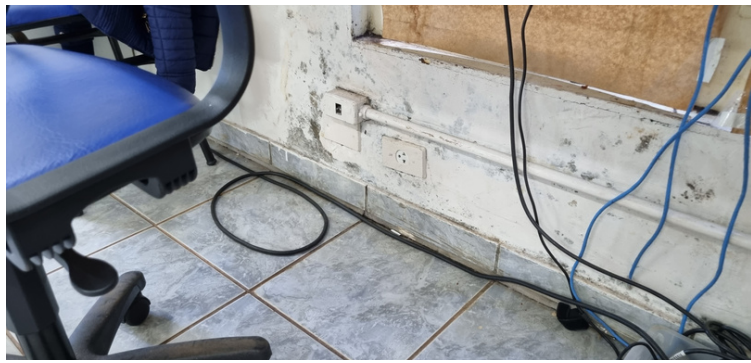
Foto 9 Infiltração na parede da sala de odontologia.