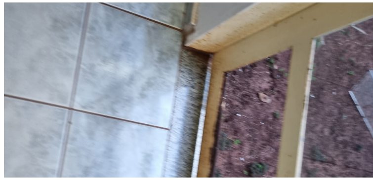
Foto 2 Porta do corredor com o vidro quebrado e com ferrugem.