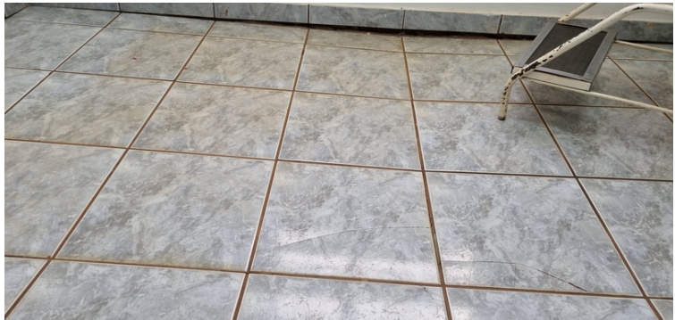
Foto 14 Piso cedendo em uma das salas da unidade.