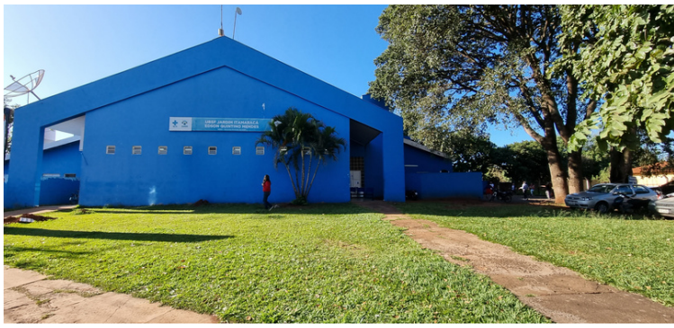
Foto 1 Fachada da Unidade de Saúde da Família Edson Quintino Mendes - Jardim Itamaracá.