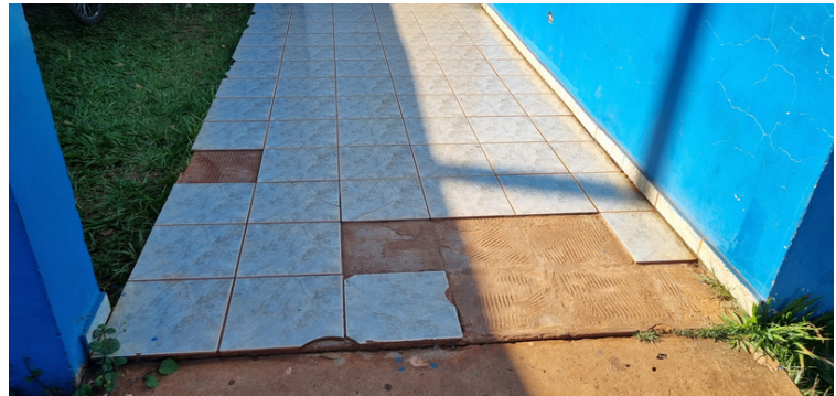
Foto 6 Pisos danificados na entrada da unidade de saúde.