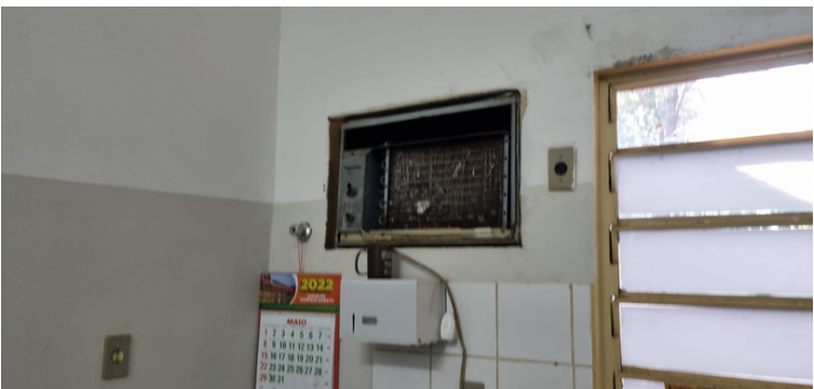
Foto 7 Ar-condicionado do consultório antigo e sem funcionar.