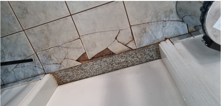
Foto 5 Pisos quebrados na entrada do consultório.