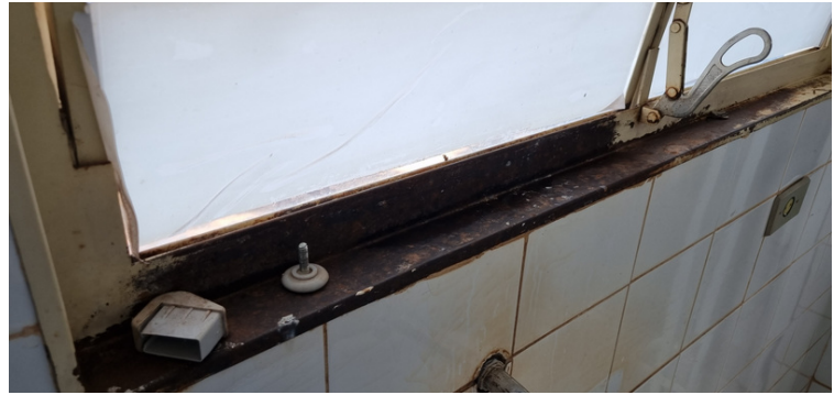
Foto 4 Janela enferrujada.