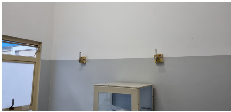
Foto 18 Oxigênio da sala de inalação sem funcionar.