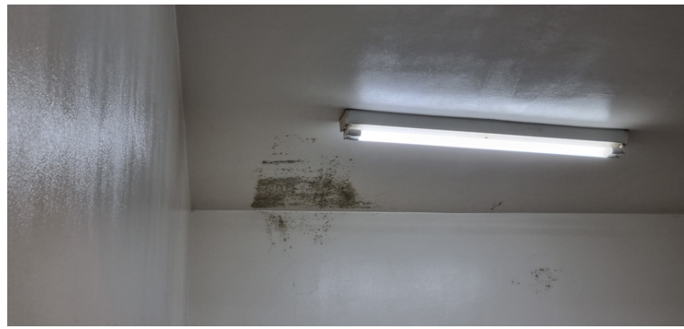
Foto 10 Infiltração com mofo no teto da sala de odontologia.