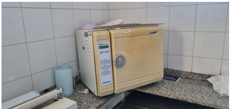
Foto 16 Autoclave estragada há anos.