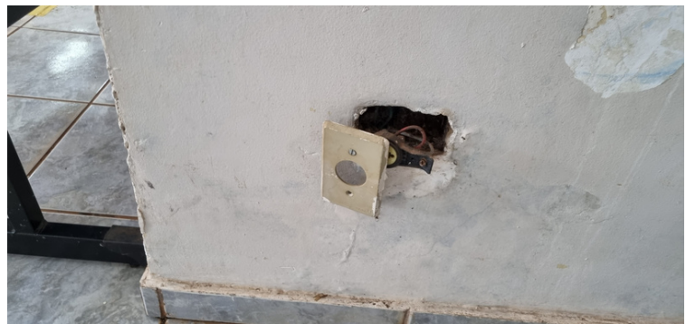
Foto 8 Tomada com fiação exposta na recepção.