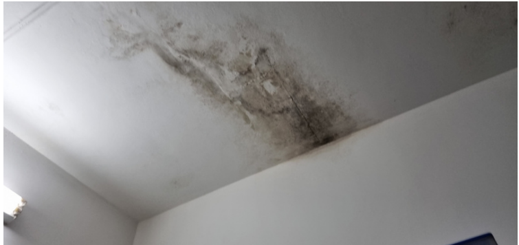
Foto 12 Infiltração com mofo em uma das salas de atendimento.