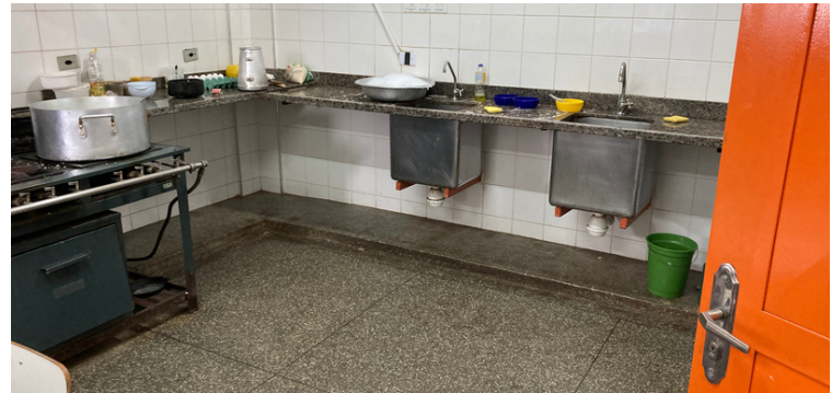
Foto 6 Necessidade da instalação de armários na cozinha.