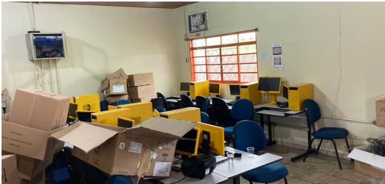
Foto 5 Sala de informática em desuso, devido à falta de técnico para ministrar aulas.