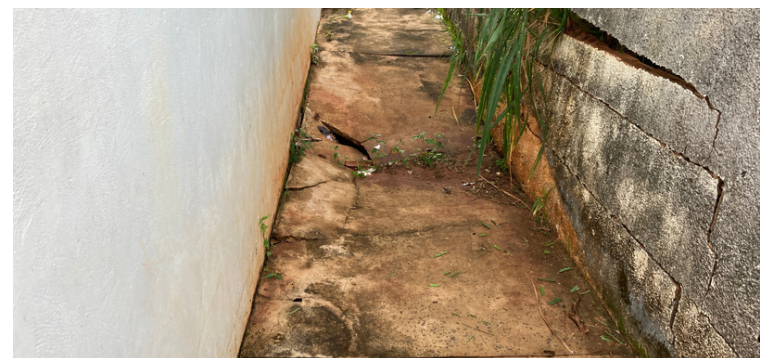
Foto 8 Muro e piso da escola com extensas rachaduras e quebraduras, com risco de desabamento.