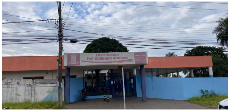
Foto 1 Fachada da EM Virgílio Alves de Campos.