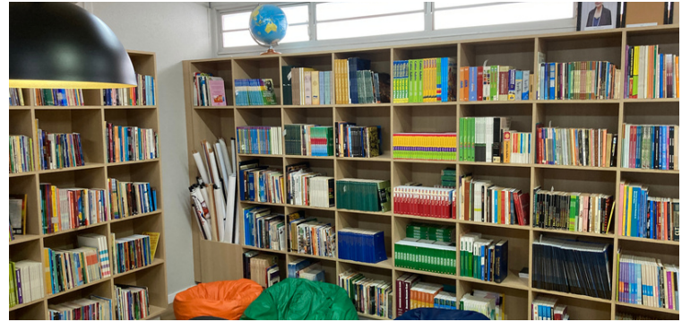
Foto 12 Biblioteca equipada e satisfatoriamente atrativa.