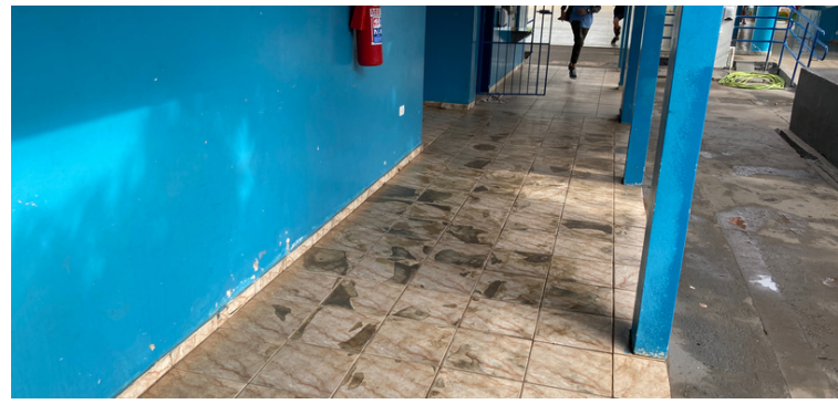
Foto 2 Pisos manchados, trincados ou quebrados.