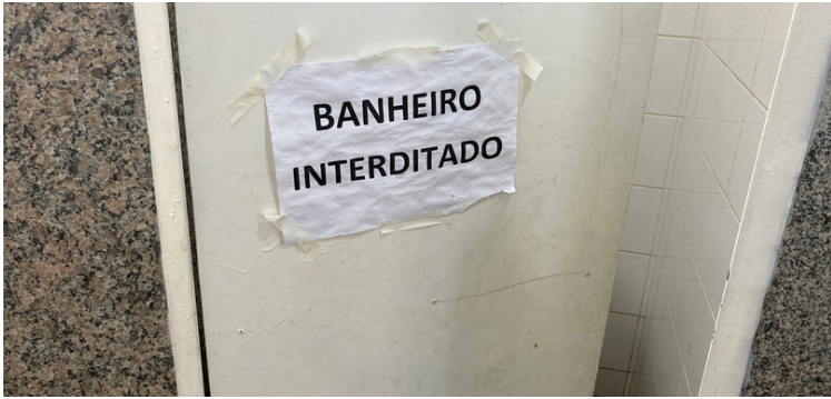
Foto 11 Ausência de manutenção no banheiro destinado aos alunos.