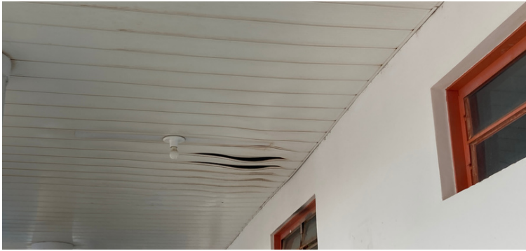
Foto 3 Forro deteriorado, resultado de infiltração.