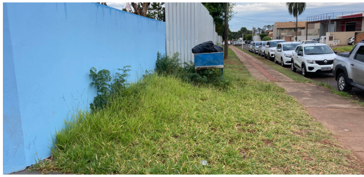
Foto 9 Precisão de manutenção na área verde em frente à instituição.