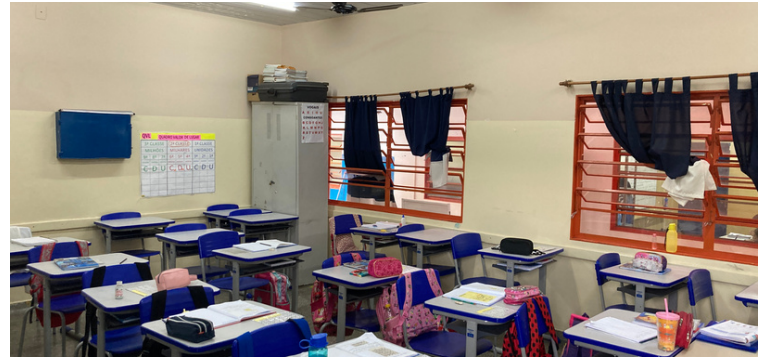
Foto 4 Salas de aulas sem climatização adequada.