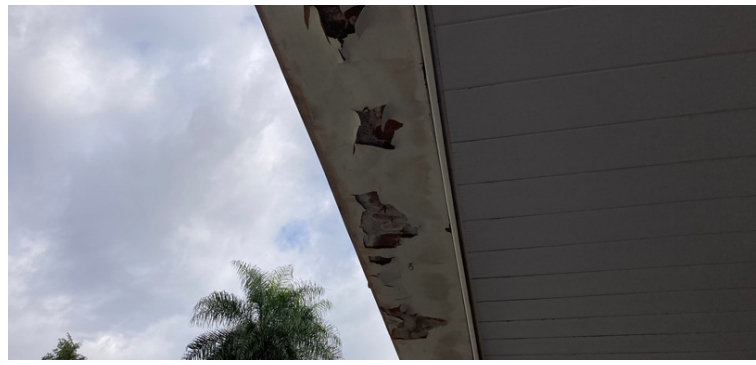
Foto 10 Focos de infiltração pelas dependências da escola.