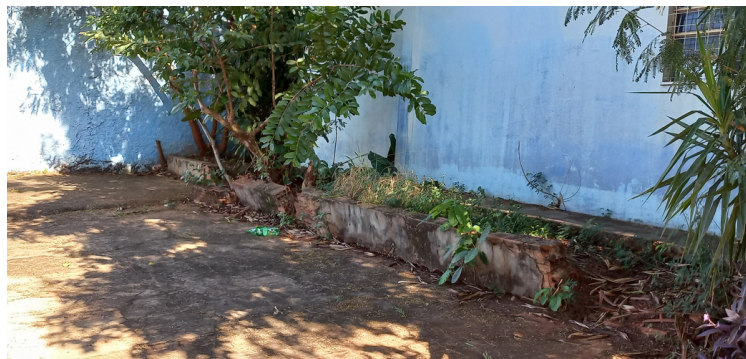
Foto 12 Canteiro localizado na parte posterior da instituição, na precisão de reforma e manutenção.