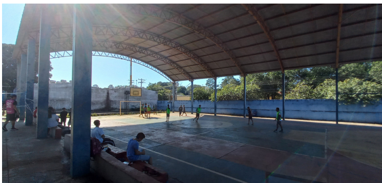
Foto 14 Quadra esportiva para melhor utilização, necessita de reparos e revitalização.