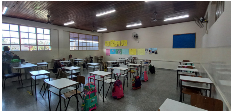
Foto 10 Salas de aulas devidamente climatizadas, bem iluminadas e mobiliadas.