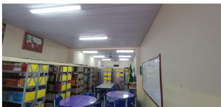
Foto 8 Biblioteca com acervo organizado, aconchegante e digitalmente catalogada.