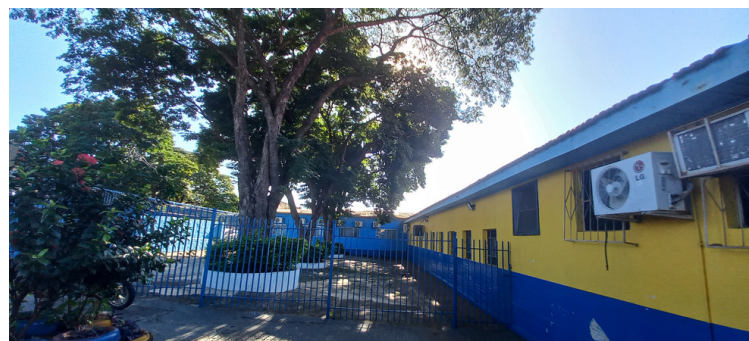
Foto 3 Árvores localizadas na área frontal da escola, precisam de poda e/ou extração.