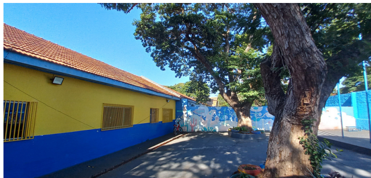
Foto 2 Árvores condenadas, com iminente risco de queda sobre a estrutura da unidade.