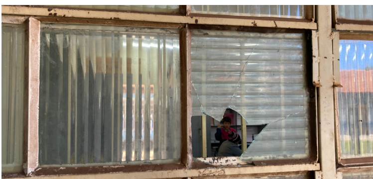
Foto 7 Vidros quebrados ou ausentes.