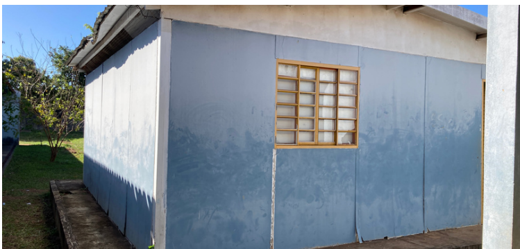
Foto 5 Salas de aulas extremamente pequenas e com condições térmicas inadequadas.