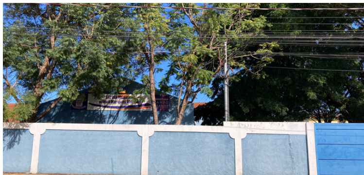
Foto 1 Fachada da EM Prof. a Arlene Marques Almeida.