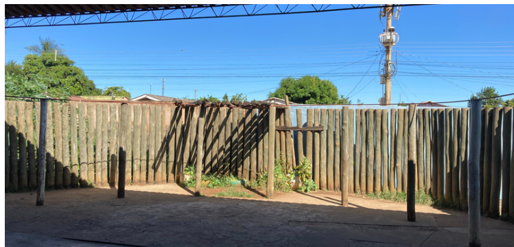
Foto 2 Área no setor infantil, destinada para a construção de parquinho.