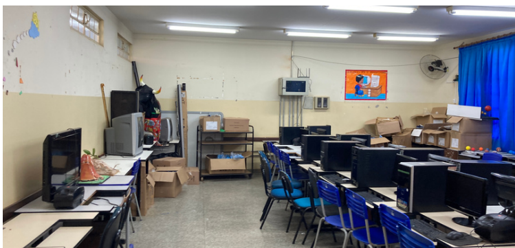
Foto 4 Sala de informática equipada com computadores excessivamente obsoletos.