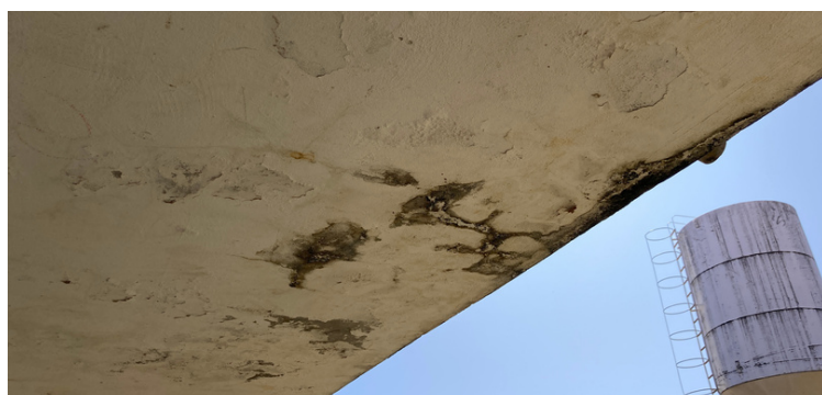
Foto 8 Infiltrações ocorrendo em locais pontuais da instituição.