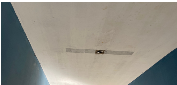
Foto 6 Iluminação necessitando de manutenção.