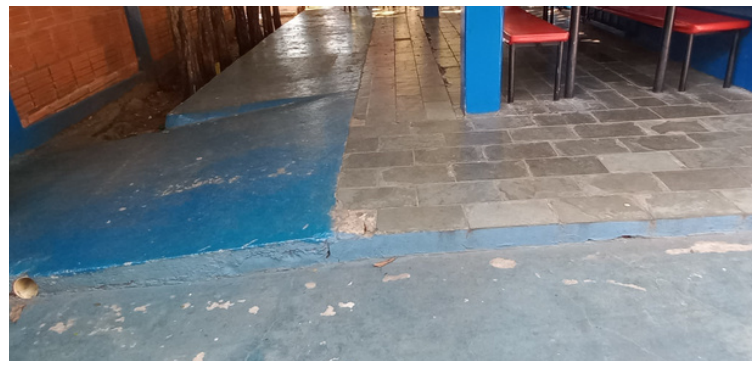
Foto 2 Piso do pátio da escola desnivelado.