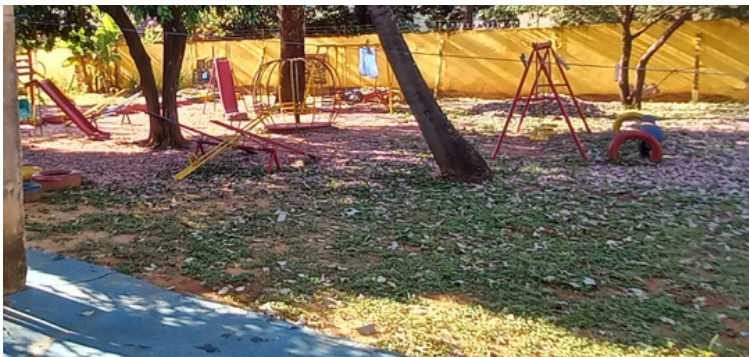
Foto 5 Parque infantil necessitando de revitalização.