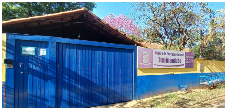
Foto 1 Fachada da EMEI Tupinambás.