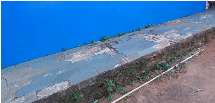
Foto 3 Calçada desgastada e sem rebaixamento.