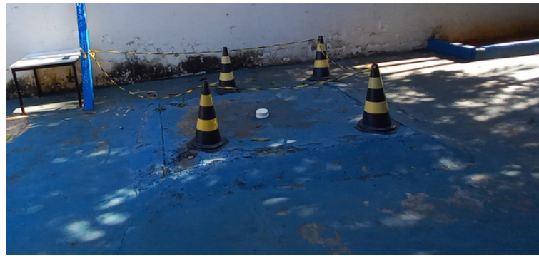
Foto 4 Fossa instalada no pátio de brincadeiras.