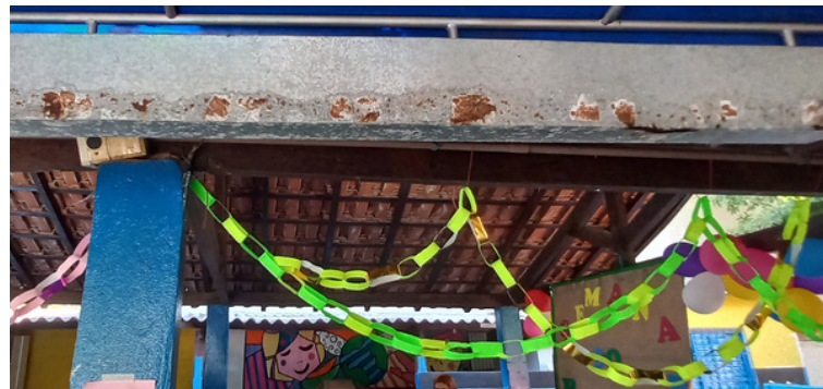
Foto 6 Calha do telhado enferrujada.