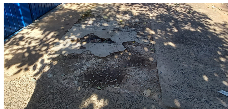
Foto 8 Entrada do portão principal, a calçada encontra-se muito danificada .