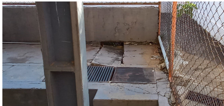
Foto 11 Tampa do ralo quebrada no pátio da escola.