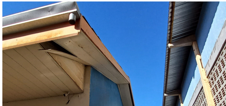
Foto 12 Forro solto e caindo.