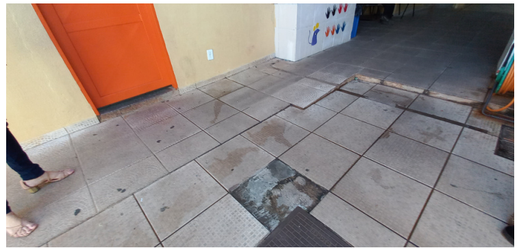
Foto 2 Piso quebrado, desnivelado e escorregadio.