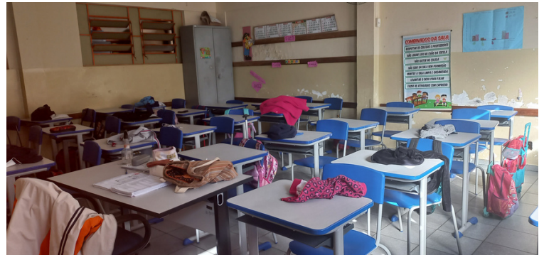
Foto 6 Salas de aula sem climatização.