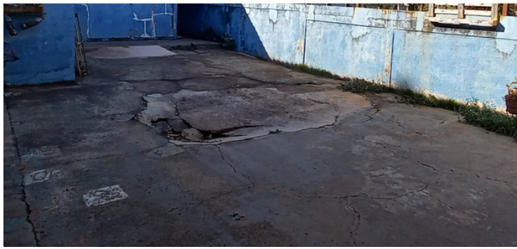
Foto 9 Buraco na calçada causado pela umidade do solo.