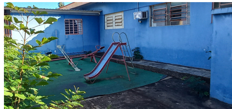
Foto 14 Parque Infantil desativado.