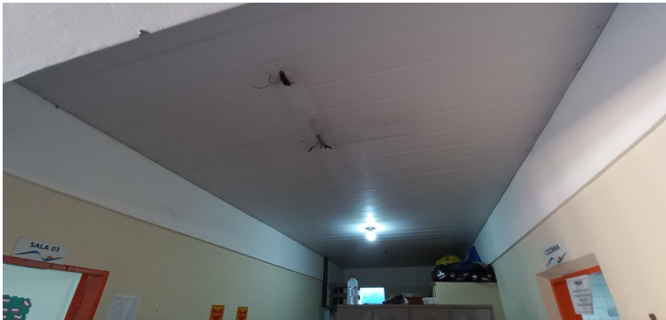
Foto 5 Corredores com falta de iluminação .