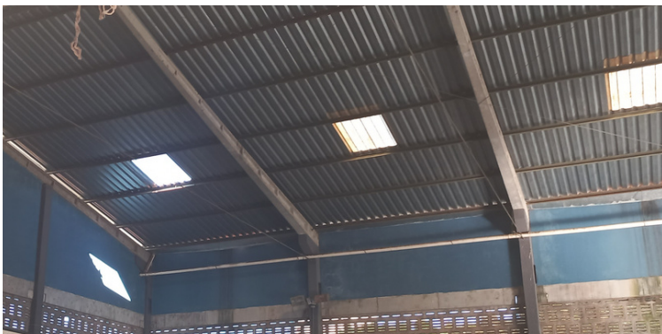
Foto 7 Cobertura da quadra de esporte com telhas faltando.