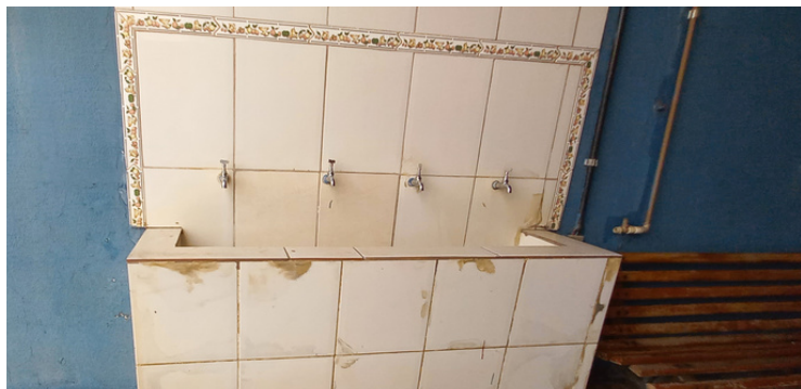
Foto 13 Lavatório inativo com vazamento.