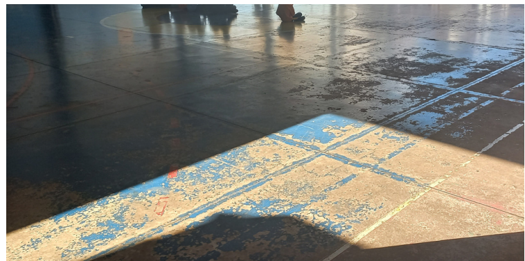
Foto 8 Quadra de esporte com pintura desgastada.