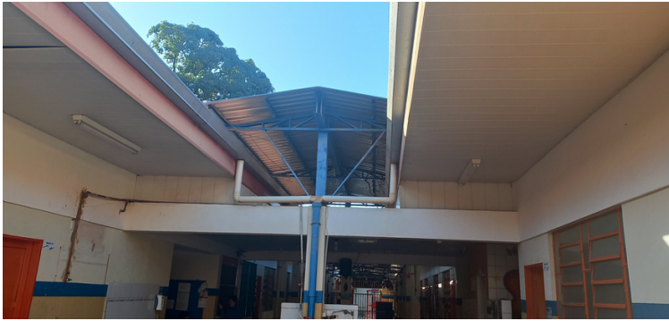
Foto 3 Calha ineficiente para vazão das águas das chuvas.