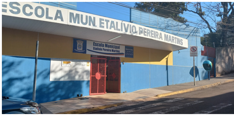
Foto 1 Necessidade de faixa de pedestre elevada.