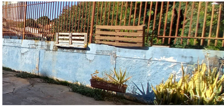
Foto 10 Muro com estrutura comprometida.