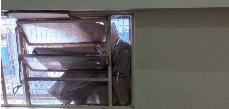
Foto 3 Solução improvisada para evitar a entrada de chuva pela janela.