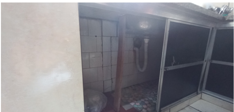
Foto 11 Pia sendo amparada por pedaço de madeira para não despencar .