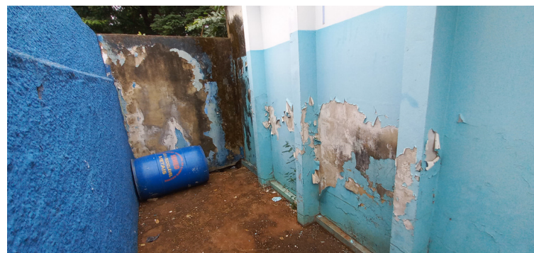
Foto 8 Muro evidentemente comprometido.