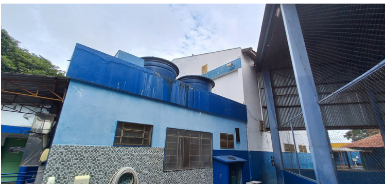
Foto 14 Caixas d'água sobre a cozinha apresentam-se com vazamento.