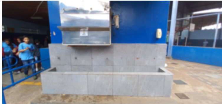
Foto 6 Bebedouros sem torneiras e depredados.