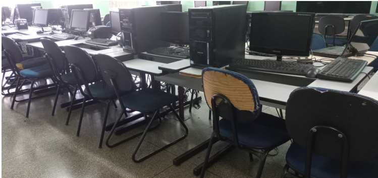
Foto 5 Móveis destinados aos discentes consideravelmente deteriorados.