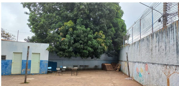
Foto 16 Árvores disposta no terreno ao lado da unidade, prejudicando a sustentação do muro.