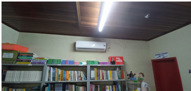
Foto 9 Biblioteca afetada por infiltração incorrendo em dano aos livros.