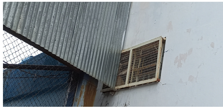
Foto 2 Proteção metálica contra chuva, canaliza água para o interior da escola.