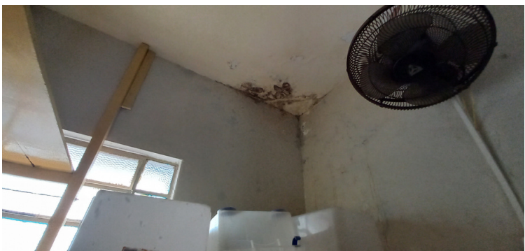
Foto 13 Despensa de alimentos repleta de mofo na iminência de contaminar os alimentos.