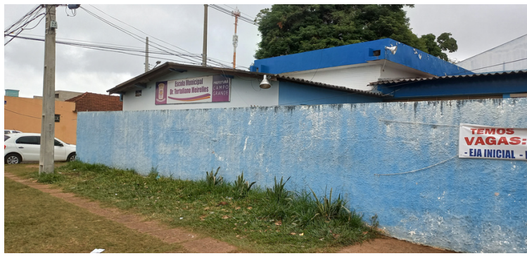
Foto 1 Fachada da EM Dr. Tertuliano Meirelles