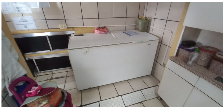
Foto 10 Freezer usado para armazenamento de comida encontra-se desregulado.