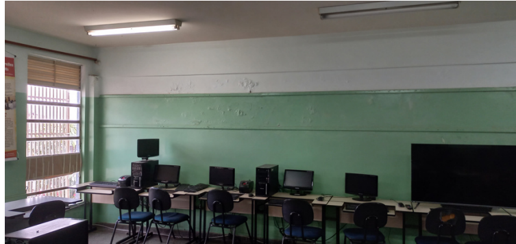
Foto 4 Infiltrações ocorrendo em locais pontuais da instituição.