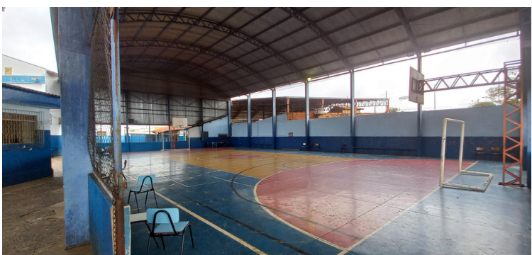
Foto 15 Quadra esportiva necessitando de revitalização e manutenção em geral.