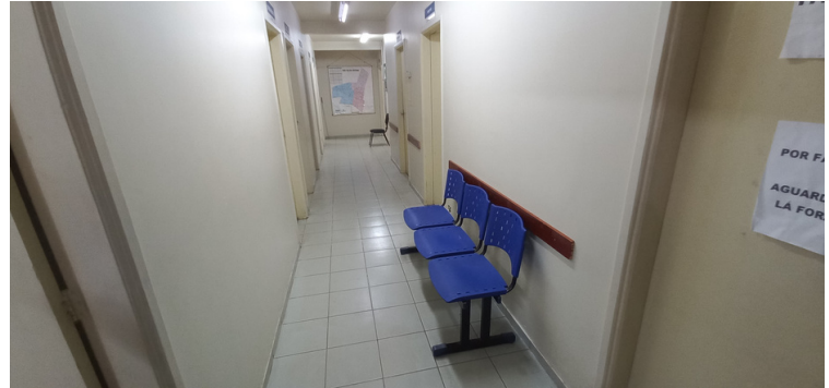
Foto 4 Corredor de acesso aos consultórios.