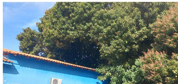
Foto 8 Árvores carecem de poda.