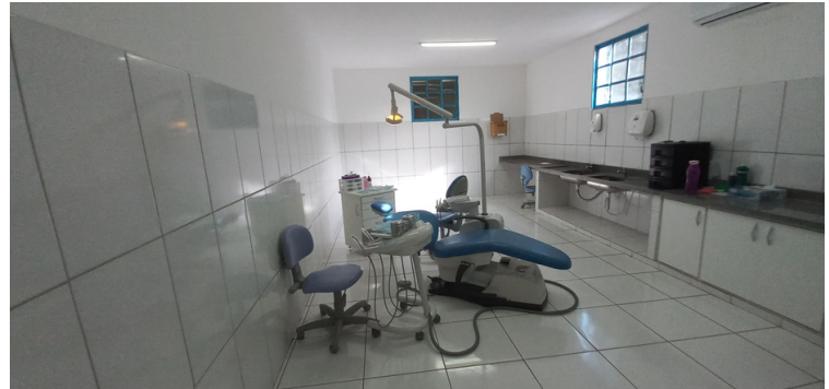
Foto 6 Consultório odontológico faltando cadeiras para atendimento.