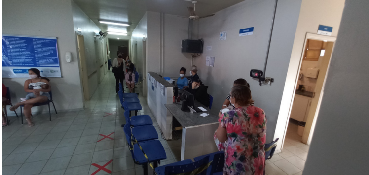
Foto 3 Recepção da unidade.