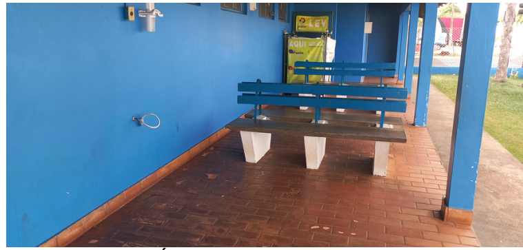
Foto 2 Área de espera dos pacientes.