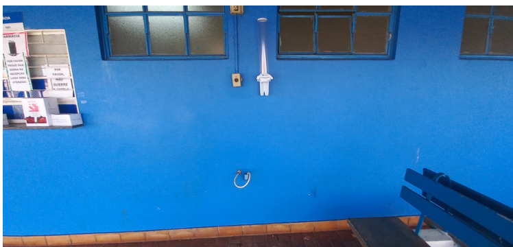
Foto 7 Bebedouro foi furtado.