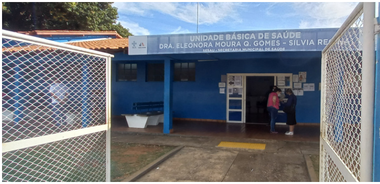
Foto 1 Fachada UBS Dra. Eleonora Moura Q. Gomes.