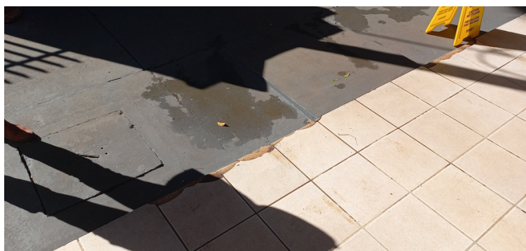
Foto 7 Pisos rachados ou quebrados em determinados locais da unidade.