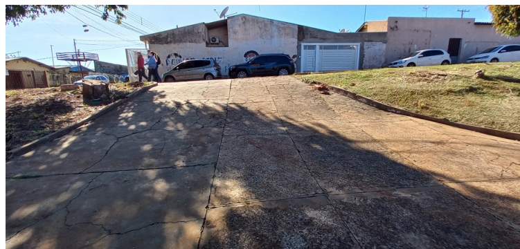
Foto 2 Acesso frontal inadequado, isento da devida acessibilidade.