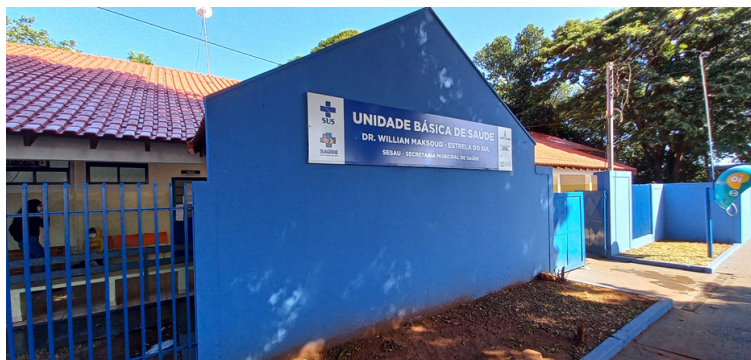
Foto 1 Fachada da Unidade Básica de Saúde Dr. Willian Maksoud.