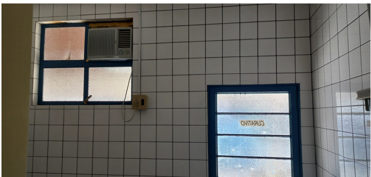
Foto 3 Ar condicionados obsoletos, ineficazes