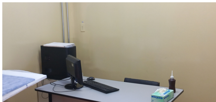
Foto 6 Computadores obsoletos e insuficientes.