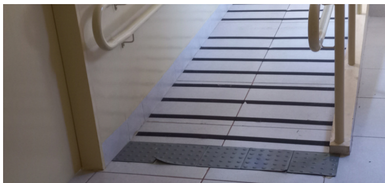
Foto 5 Rampa de acesso à sala de odontologia avariada.