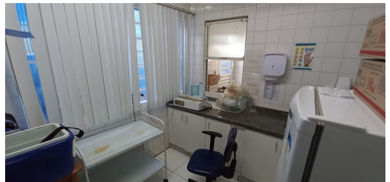
Foto 8 Sala de esterilização adequadamente equipada e estruturada.