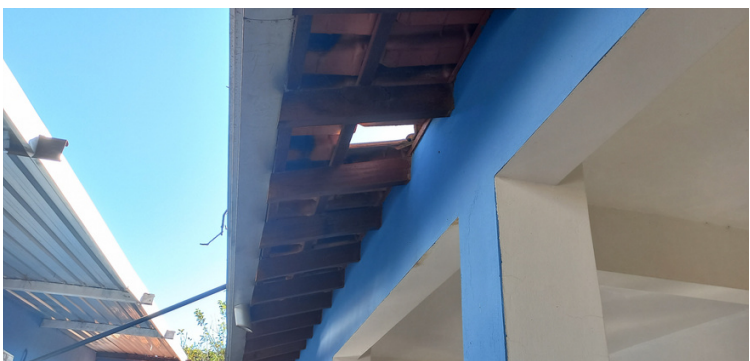
Foto 11 Precisão da substituição de telhas quebradas.