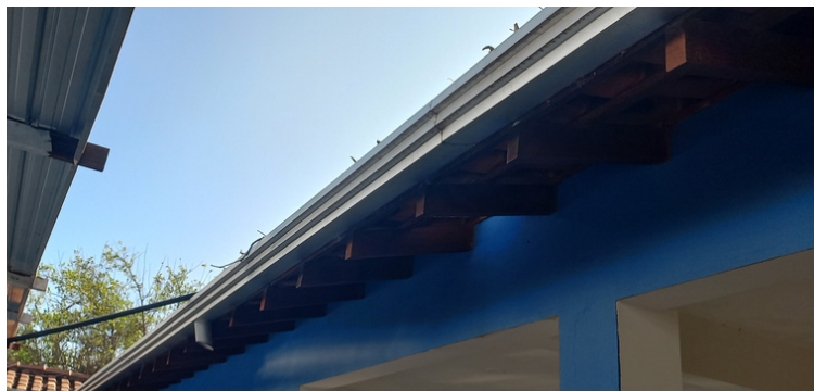
Foto 9 Calhas constantemente obstruídas por folhas, ocorrendo extravasamento de água.