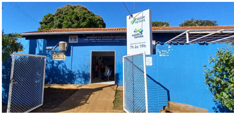
Foto 1 Fachada da UBSF Dr.ª Sumie Ikeda Rodrigues