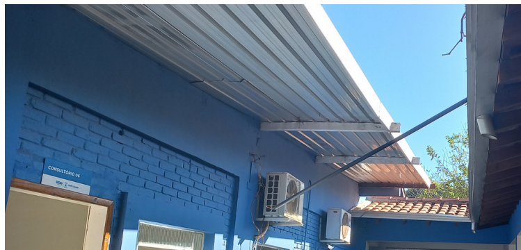
Foto 10 Necessidade da completa cobertura entre os blocos na parte posterior da unidade.