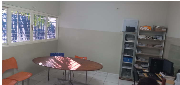
Foto 4 Sala de reuniões utilizada pelos agentes de saúde, em razão de não possuírem local específico.