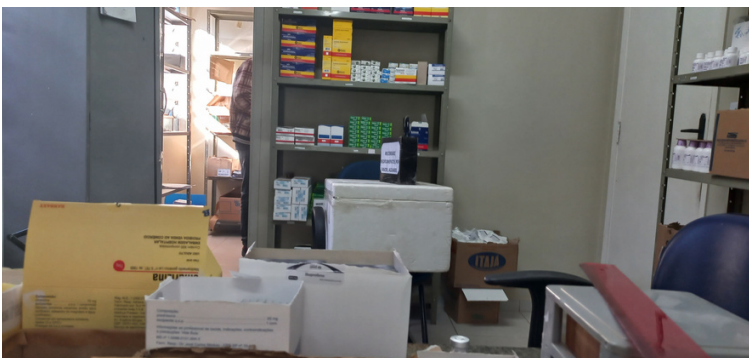
Foto 7 Farmácia devidamente abastecida.