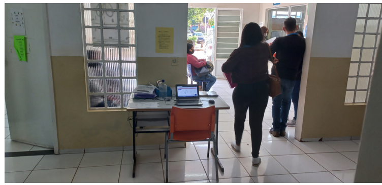
Foto 2 Acolhimento isento de confortabilidade e privacidade.