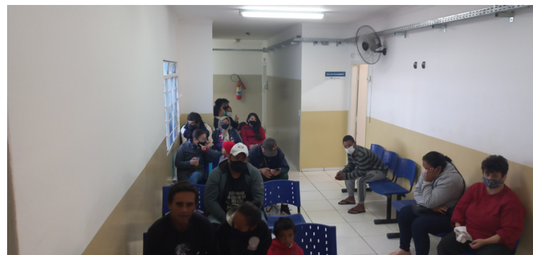
Foto 14 Recepção, apesar de estruturalmente pequena, devidamente mobiliada e acolhedora.