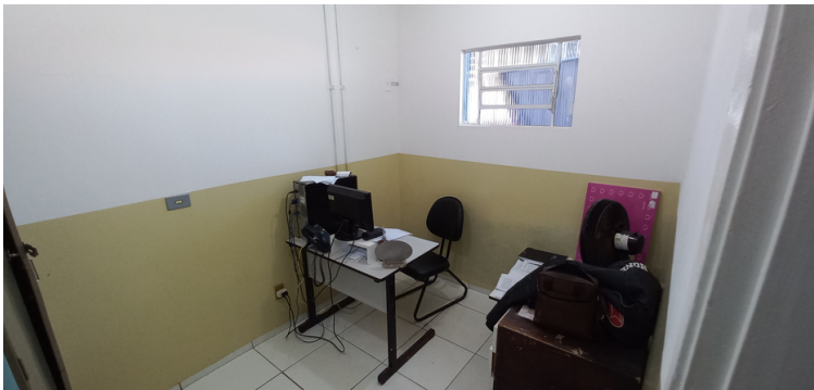
Foto 3 Determinados consultórios sem a devida climatização.