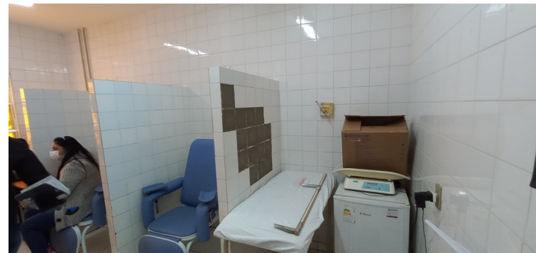
Foto 6 Consultório com revestimento danificado.