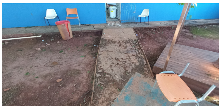
Foto 12 Rampa de acesso para consultório, expressivamente irregular.