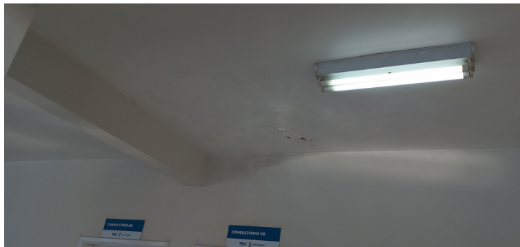
Foto 5 Locais pontuais da unidade com manchas no teto, resultado de infiltrações já resolvidas.