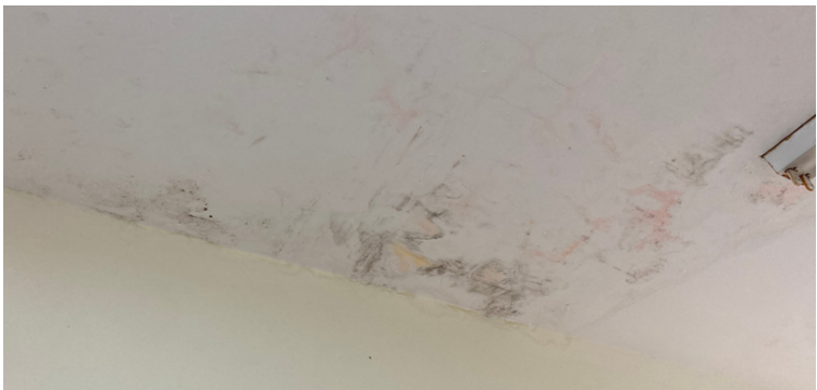
Foto 3 Infiltrações na recepção próximo a sala da odontologia.