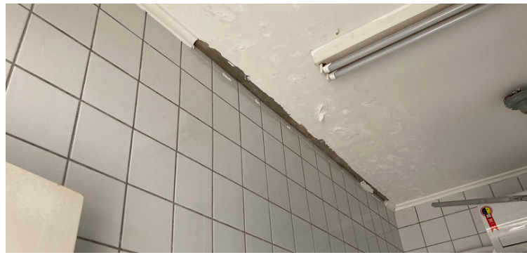
Foto 2 Moldura rodadeto da sala de laboratório danificado por conta de infiltrações.