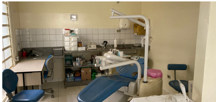
Foto 4 Odontologia desativada por falta de servidores.