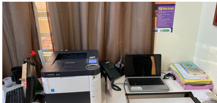
Foto 6 Servidores utilizam seus notebooks particulares para suprir a defasagem de equipamentos.