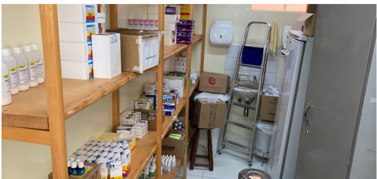
Foto 7 Farmácia sem distribuição de medicamentos controlados por falta de farmacêutico.