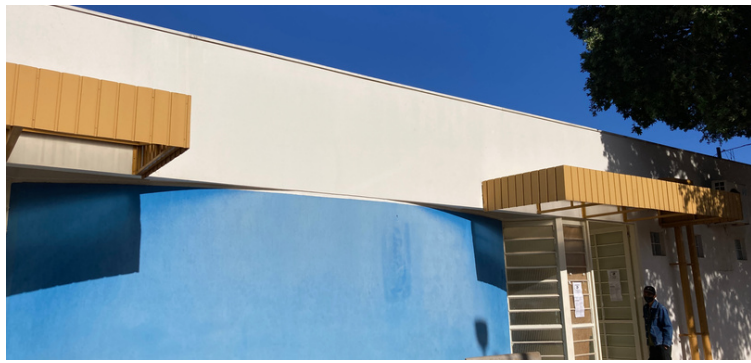
Foto 1 Fachada da Unidade de Saúde da Família Dr Olympio Leme Cavalheiro.