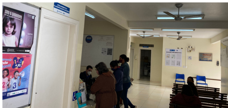
Foto 8 Recepção da unidade de saúde.