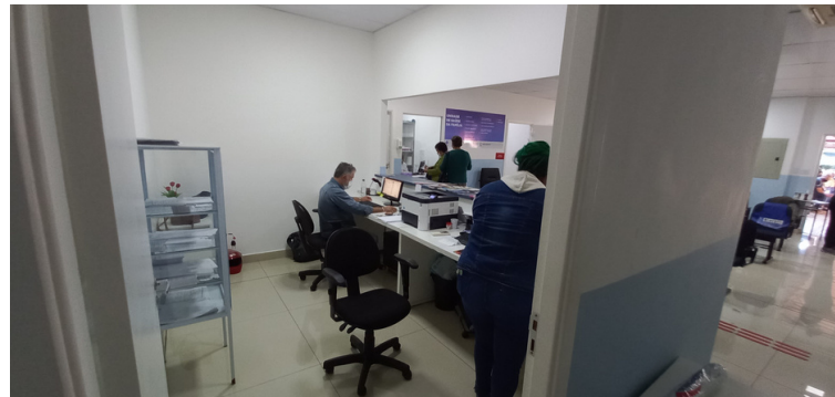
Foto 4 Setor administrativo adequadamente mobiliado e estruturado.