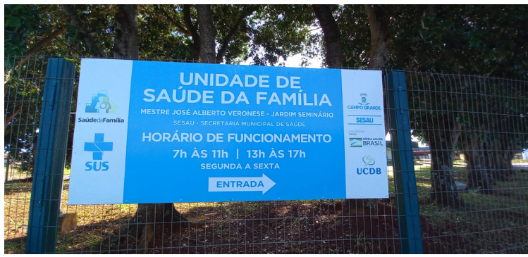
Foto 1 Fachada da Unidade de Saúde da Família Mestres José Alberto Veronese - Jardim Seminário