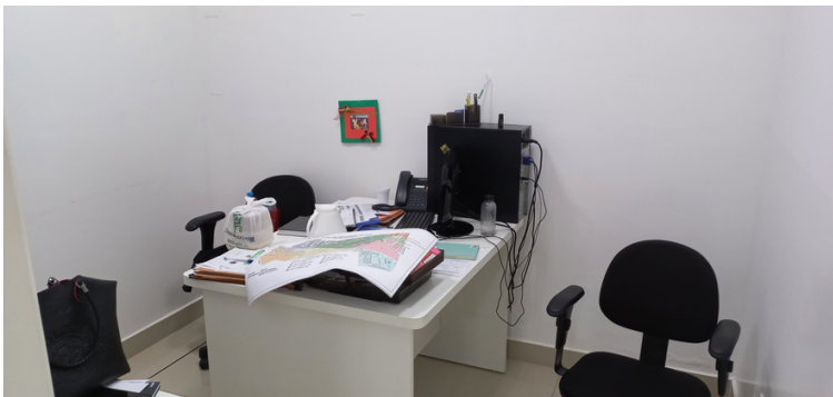
Foto 5 Unidade satisfatoriamente informatizada, com quantitativo de computadores suficiente e rede de internet compatível.