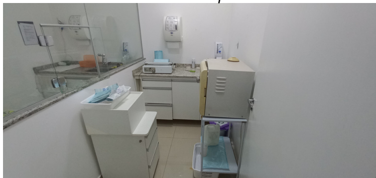
Foto 7 Sala de esterilização de materiais completa.