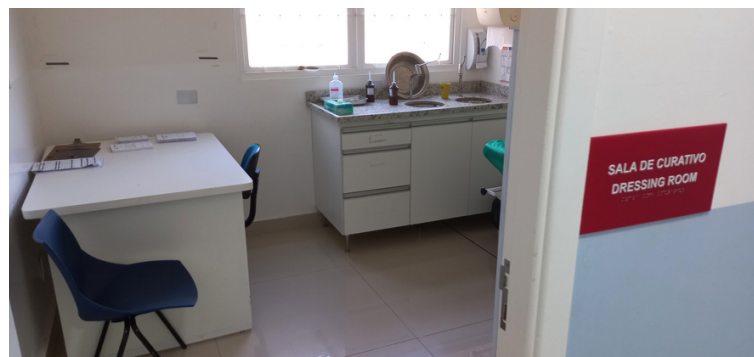
Foto 6 Consultórios adequadamente equipados e bem estruturados.