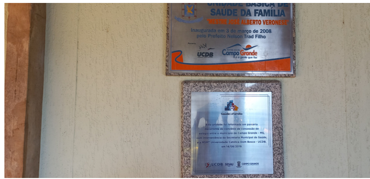
Foto 2 A USF é resultado do convênio firmado entre a UCDB e SESAU.