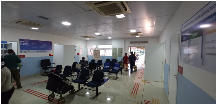
Foto 3 Recepção acolhedora, organizada e devidamente climatizada.