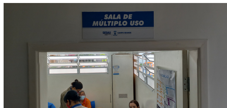
Foto 8 - Sala multiuso destinada aos agentes comunitários de saúde.