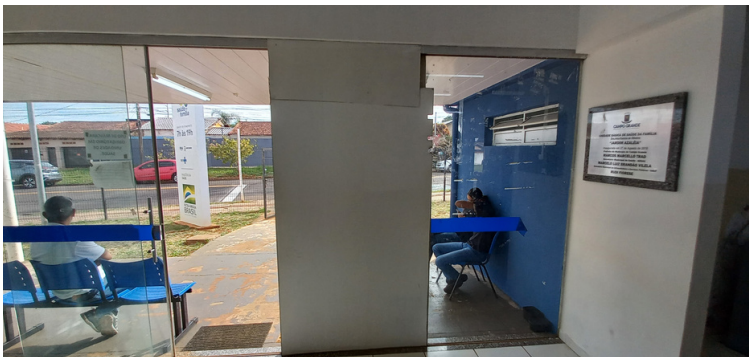
Foto 5 - Porta de vidro quebrada há mais de seis meses sem o devido conserto.