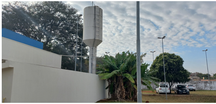
Foto 17 - Caixa d'água em desuso.