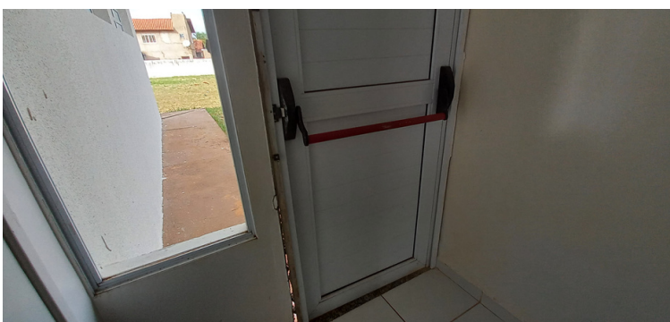
Foto 7 - Porta de emergência estragada sem a devida funcionalidade.