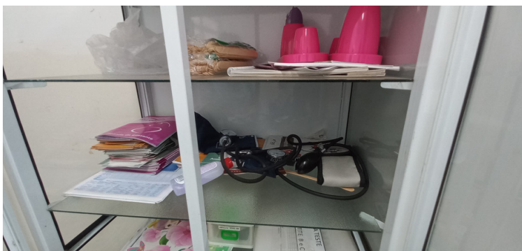
Foto 12 - Equipamentos médicos, tais como esfigma e sonar, encontram-se estragados.