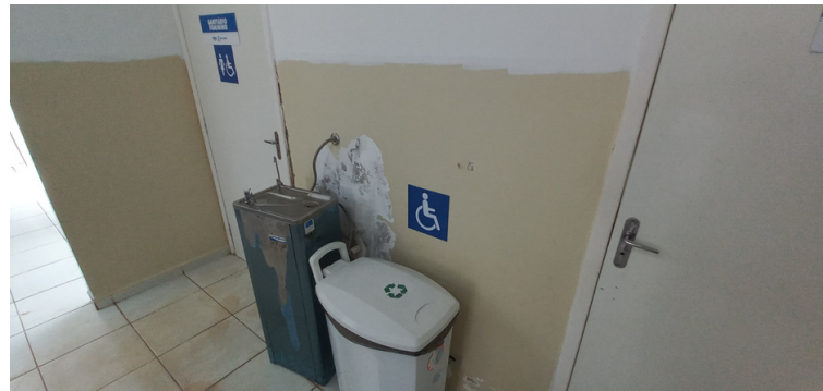
Foto 4 - Bebedouro extremamente arcaico e com infiltração em sua instalação.