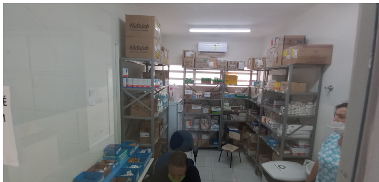
Foto 9 - Farmácia com falta de determinados medicamentos e sem farmacêutico.