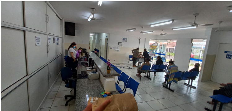
Foto 3 - Ventiladores instalados na recepção encontram-se avariados.