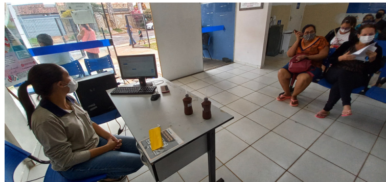
Foto 6 - Acolhimento e recepção prejudicados devido à ineficiência de computador e internet.