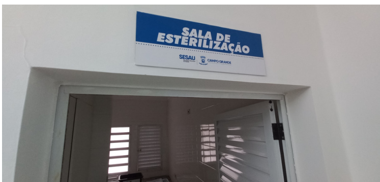
Foto 14 - Setor de esterilização com autoclave e seladora estragados.