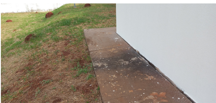
Foto 15 - Calçamento com a estrutura prejudicada devido à erosão no terreno.