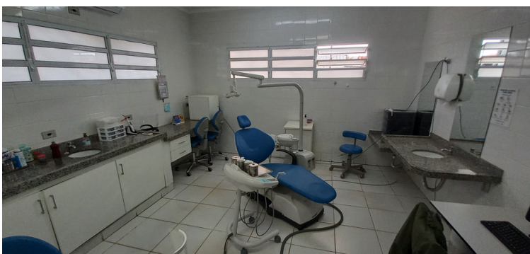
Foto 13 - Setor odontológico sem computador e com problema de impermeabilização no forro.