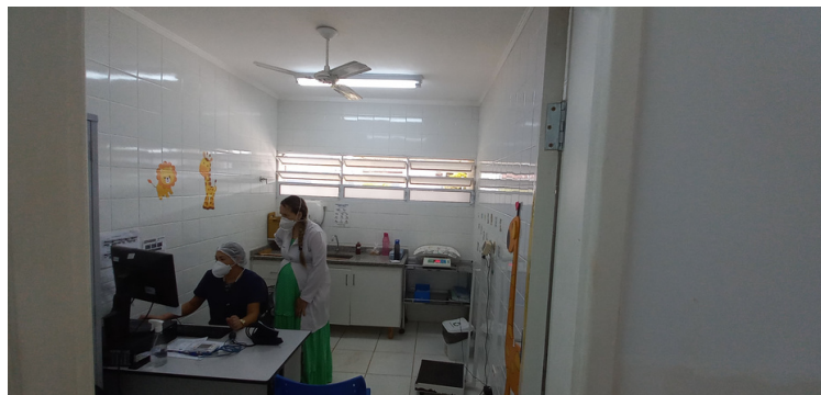
Foto 10 - Consultórios e salas sem a devida climatização.