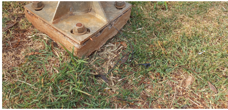
Foto 18 - Fiação dos postes na área externa rompida, restando na ausência de iluminação no local.