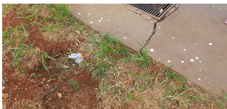
Foto 16 - Rede de esgotamento irregular.