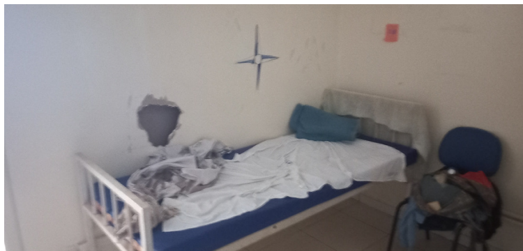
Foto 9 Determinados locais necessitando de reparos devido a avarias ocasionadas por pacientes em surto.