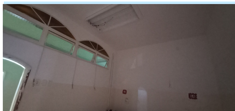
Foto 8 Quartos dos pacientes ausentes da devida climatização e iluminação.