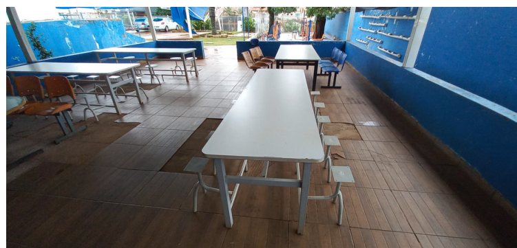
Foto 14 Refeitório com o mobiliário avariado e assoalho ausente de alguns pisos.