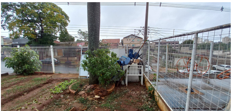
Foto 15 Descarte de objetos disposto de forma irregular na parte posterior da unidade.