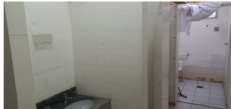
Foto 6 Banheiros necessitando de manutenção.