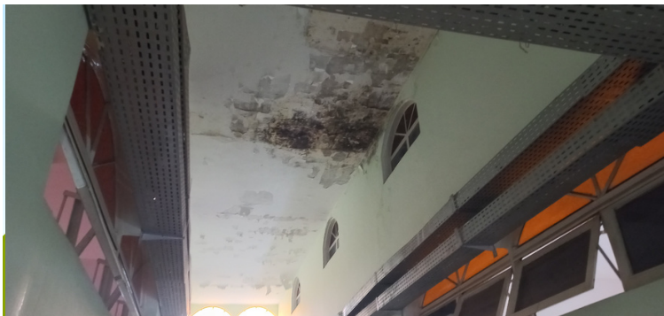
Foto 5 Excesso de mofo na paredes.