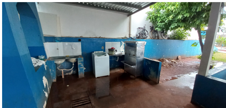
Foto 12 Apenas um bebedouro, localizado na parte posterior da unidade.