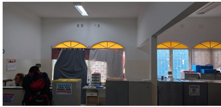
Foto 2 Recepção improvisada, delimitada por armários e umas das janelas com os vidros quebrados.