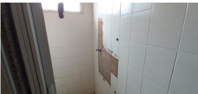
Foto 7 Azulejos, no banheiro, se desprendendo da parede.