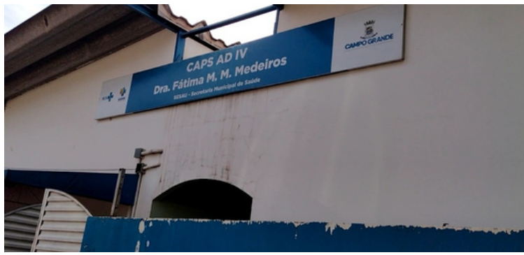
Foto 1 Fachada do Centro de Atenção Psicossocial Álcool e Drogas III "Fátima M. Medeiros"