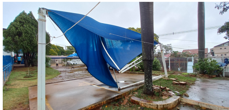
Foto 16 Toldo danificado por tempestade.