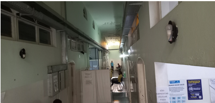
Foto 3 Iluminação precária por toda a extensão da unidade.