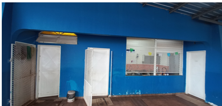
Foto 13 Cozinha provida e bem estruturada.