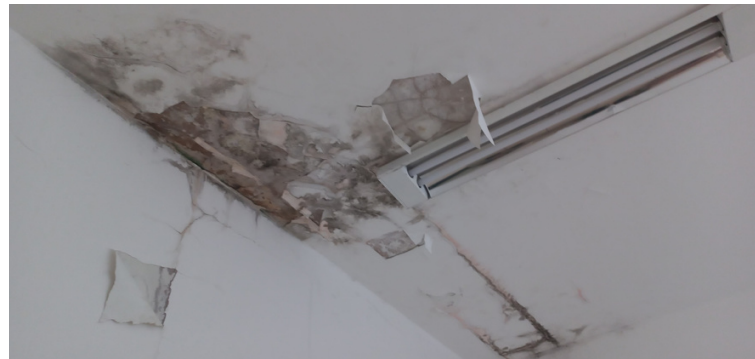
Foto 4 Telhado com irregularidades incorrendo em infiltrações.