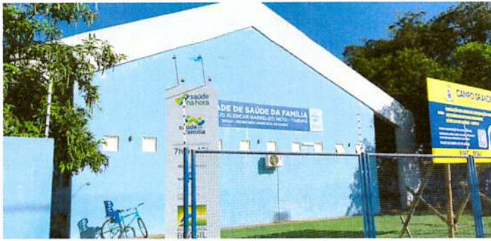
Foto 1 - Fachada da UBSF Drº Emílio Alencar Garbeloti Neto