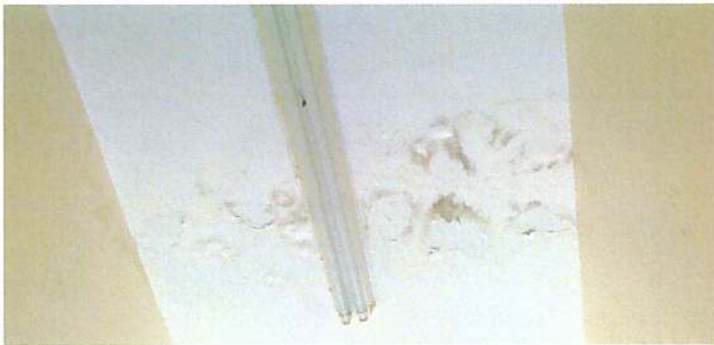
Foto 3 - Teto da unidade repleto de mofo