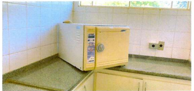
Foto 6 - Autoclave necessitando de manutenção