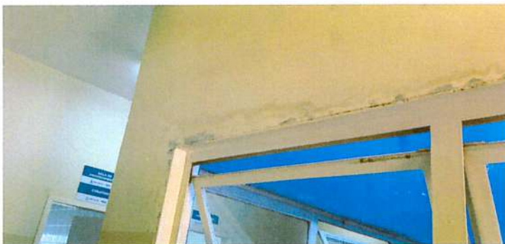
Foto 5 - Esquadrias avariadas devido à infiltrações