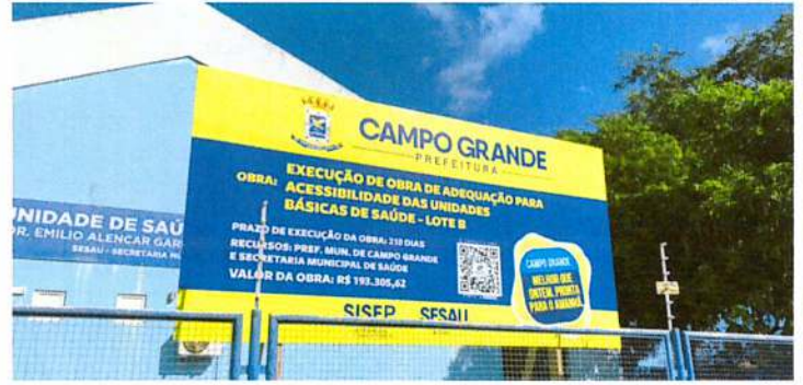
Foto 2 - Informativo de futura obra para adequação à acessibilidade e manutenção da unidade