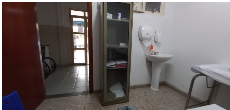
Foto 9 - Armário, alocado em um dos consultórios, corroído pela ferrugem.