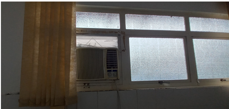
Foto 5 - Aparelhos de ar condicionado obsoletos, deficientes em gerar adequada climatização.