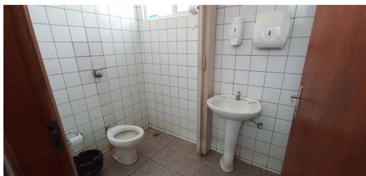
Foto 10 - Ausência de banheiro para uso de PCD's.