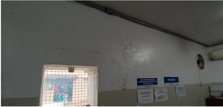
Foto 3 - Recepção acometida por manchas, bolhas e mofo, devido às infiltrações.