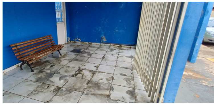
Foto 2 - Piso da área frontal mofado.