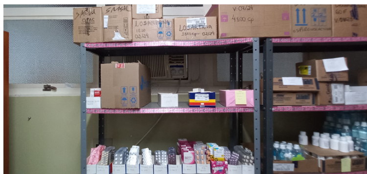
Foto 12 - Farmácia faltante de uma adequada climatização.