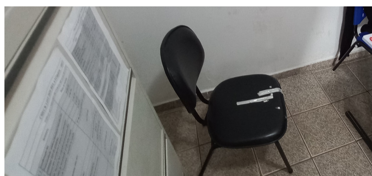
Foto 8 - Mobiliários desgastados ou avariados.