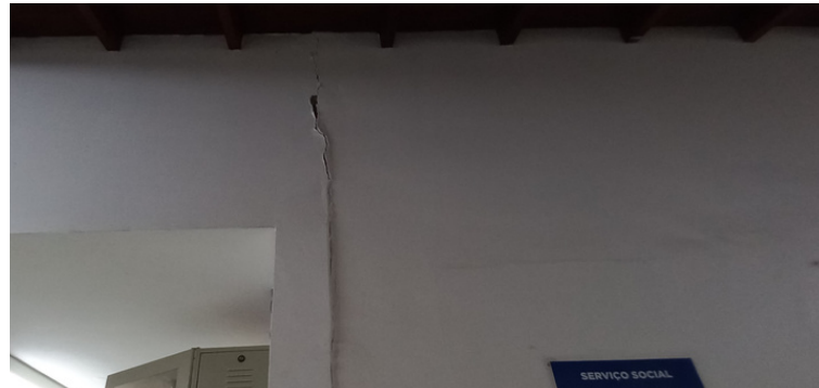
Foto 4 - Rachaduras ocorrem em locais pontuais da unidade.