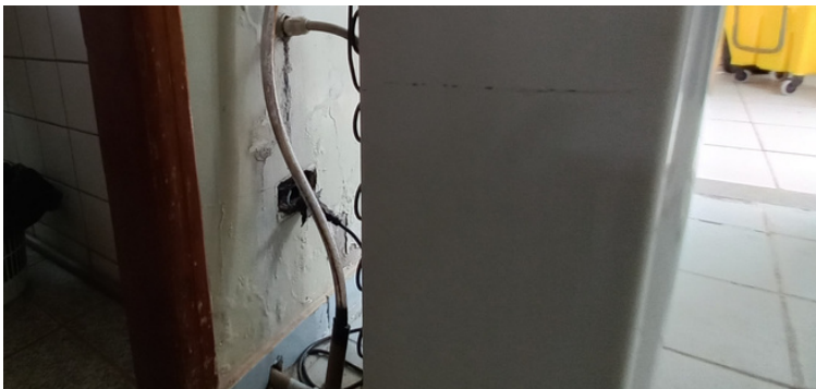
Foto 11 - Bebedouro com a rede hidráulica danificada, incorrendo em infiltração e mofo.