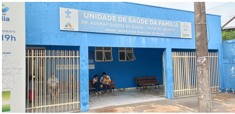
Foto 1 - Fachada da Unidade de Saúde da Família Dr. Ademar de Souza - Mata do Jacinto.