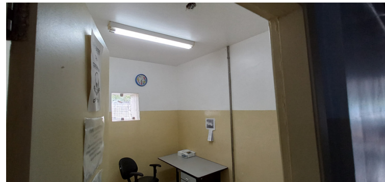
Foto 6 - Sala de curativo ausente de qualquer equipamento de arrefecimento.