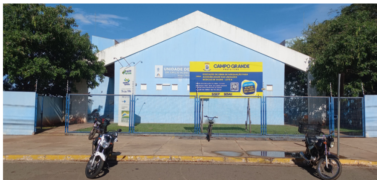
Foto 1 - Fachada da USF Dr. Alfredo Neder - Coophavilla II