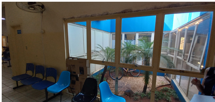
Foto 3 - Esquadrias de portas e janelas corroídas pela ferrugem.