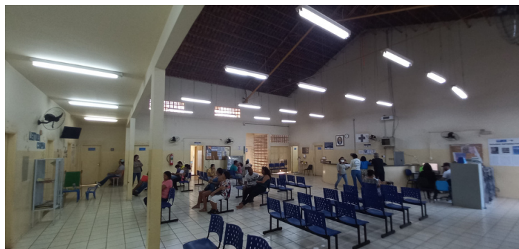
Foto 2 - Recepção desprovida de adequada climatização.