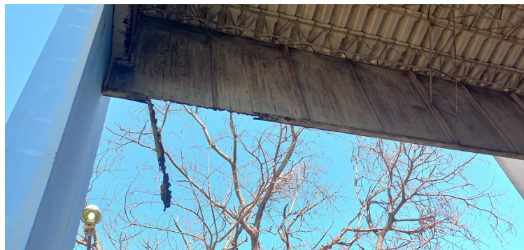
Foto 8 - Cobertura metálica deteriorada.