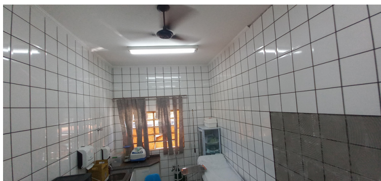
Foto 7 - Revestimento de consultórios com o descolamento de azulejos.