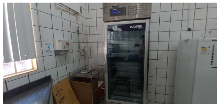
Foto 6 - Câmara fria avariada, impossibilitando o adequado armazenamento dos imunizantes.