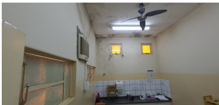
Foto 5 - Infiltrações e mofo comprometendo determinadas salas e consultórios.