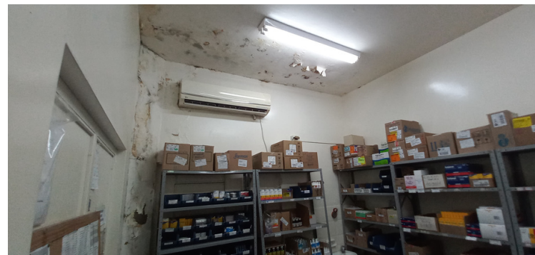
Foto 4 - Farmácia acometida severamente por infiltração e mofo.