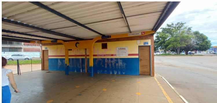
Foto 11 - Pichações por toda a extensão do terminal.