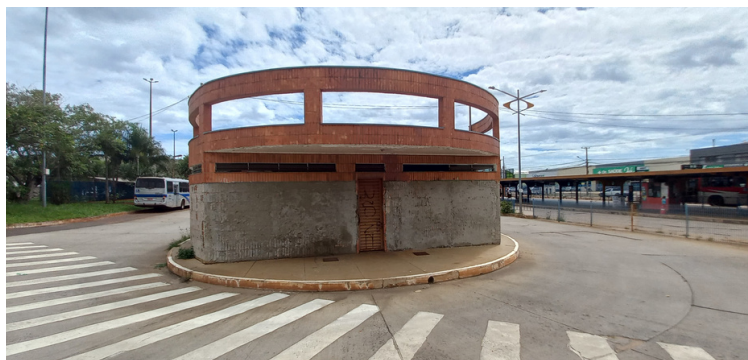
Foto 2 - Estrutura de uma das fachadas, sem revestimento.