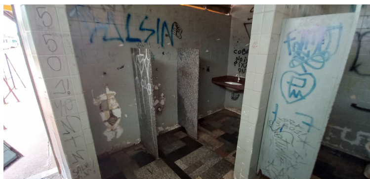
Foto 10 - Sanitário destituído de mictórios.