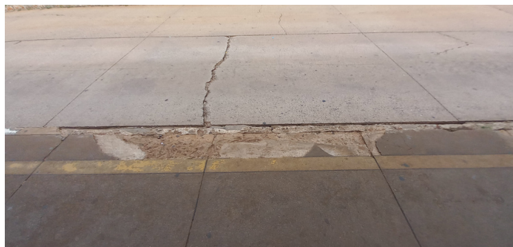
Foto 14 - Plataforma de embarque e desembarque de passageiros, danificada em determinados locais.