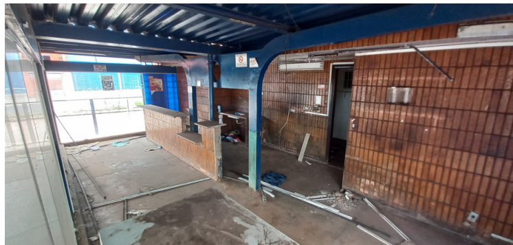
Foto 12 - Recinto sem utilização, repleto de objetos inservíveis e entulhos.