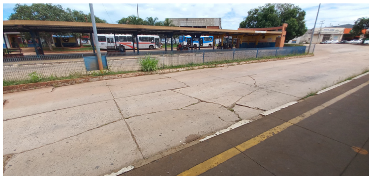
Foto 13 - Pavimento onde trafegam os ônibus, expõe extensas rachaduras.