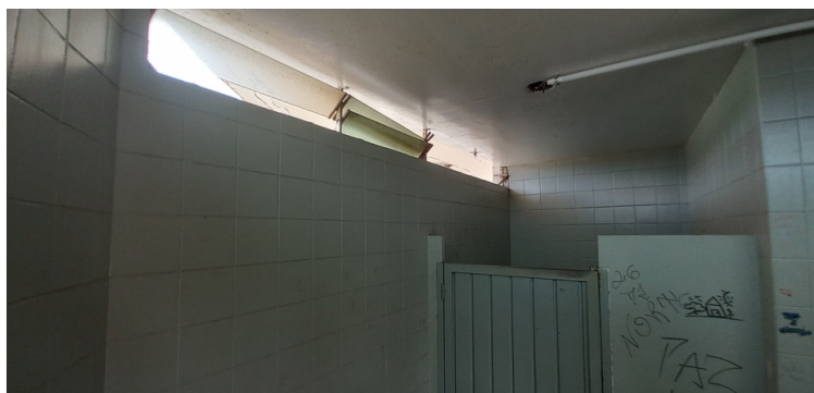
Foto 8 - Vidros quebradas e paredes danificadas nos sanitários.