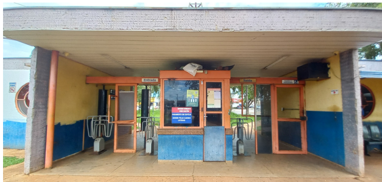
Foto 3 - Entrada principal sem revestimento e esquadrias metálicas corroídas pela ferrugem.