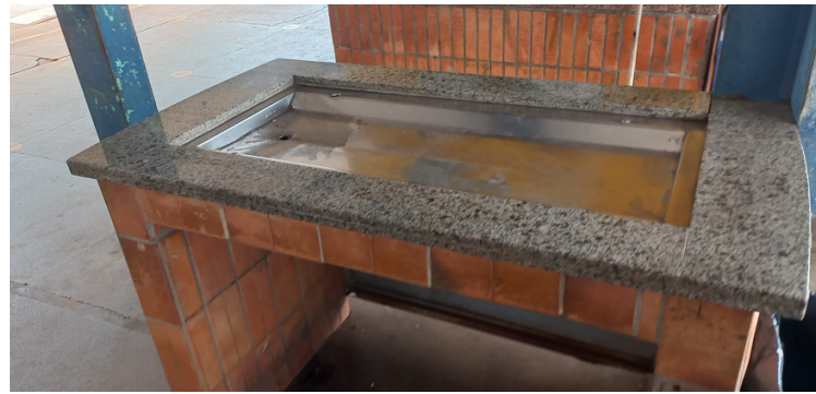
Foto 6 - Somente um bebedouro no local e encontra-se avariado.