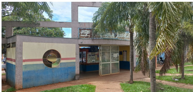
Foto 1 - Entrada principal do Terminal General Osório.