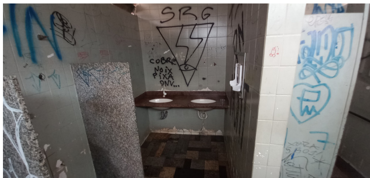
Foto 9 - Banheiro masculino completamente depredado.