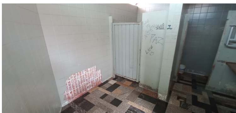
Foto 7 - Banheiro feminino sem as mínimas condições de higiene.