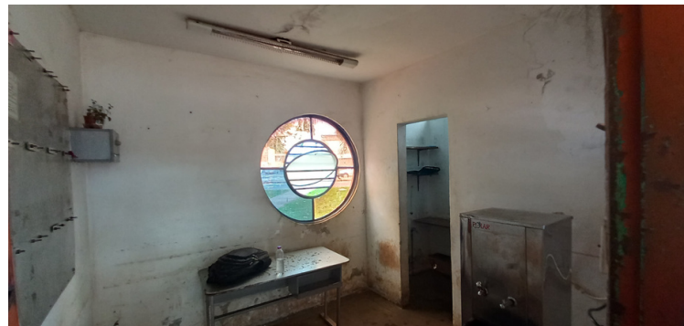
Foto 4 - Sala do administrativo deveras comprometida por infiltrações, mofo e destituída de mobiliário.