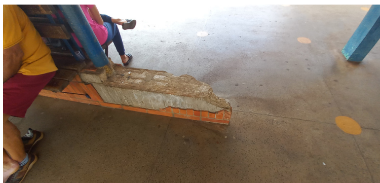
Foto 5 - Bancos depredados.