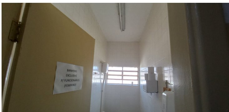
Foto 5 - A repartição carece de revisão na rede elétrica.