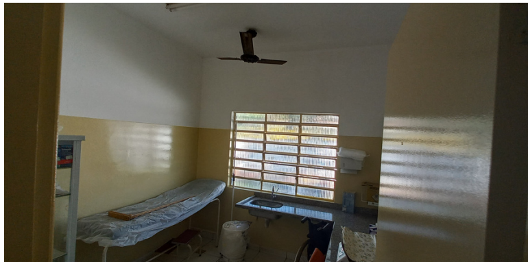
Foto 4 - Falta de apropriado sistema de climatização na unidade.