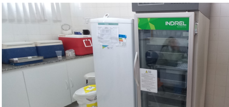
Foto 6 - Câmara fria da sala de vacinas aguardando reparo.