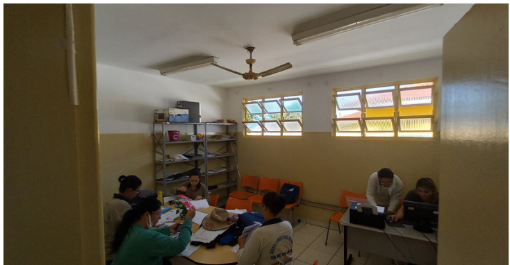
Foto 3 - Auditório utilizado pelos ACS com falta de equipamentos de informática.