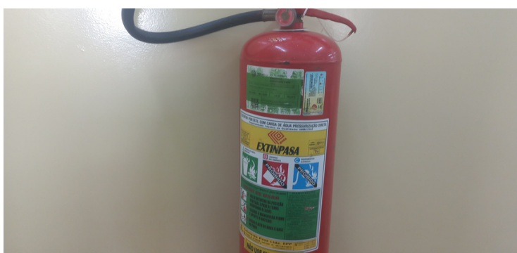
Foto 7 - Extintores com data expirada, esperando recarga.