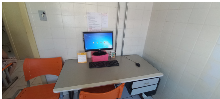
Foto 2 - Equipamentos da unidade com de informática obsoletos, morosos e em número insuficiente.