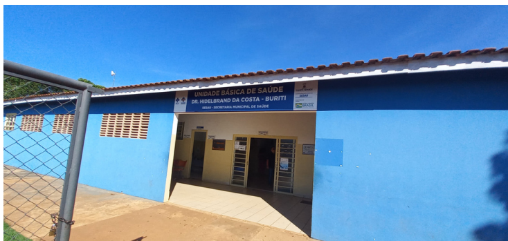
Foto 1 - Fachada da USF Dr. Ivan Hildebrando da Costa, Buriti.