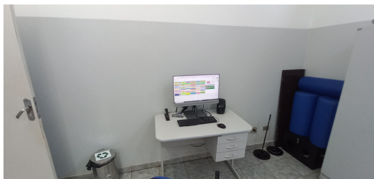
Foto 8 - Sala dos agentes comunitários de saúde, sem devida climatização e insatisfatoriamente mobiliada.