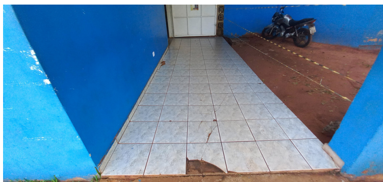
Foto 7 - Assoalho na parte frontal da unidade, constante de pisos trincados e quebrados, possibilitando a ocorrência de intercorrências.