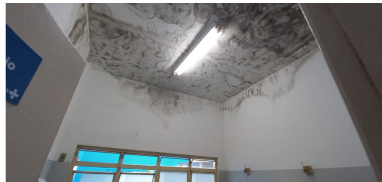
Foto 4 - Consultório absolutamente insalubre, repleto de mofo, prejudicial a servidores e usuários.