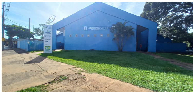
Foto 1 - Fachada da USF Dr. Edson Quintino Mendes - Jardim Itamaracá.