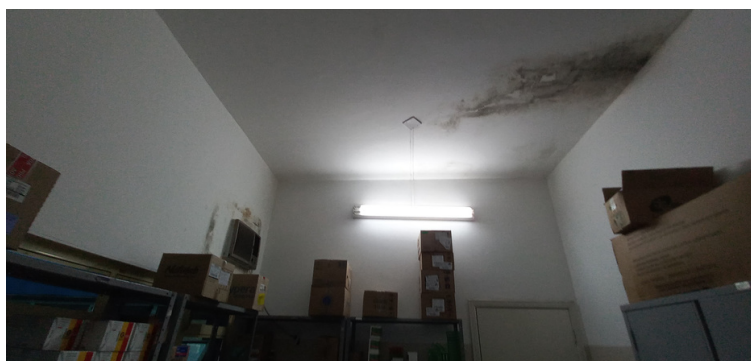
Foto 5 - Farmácia estruturalmente prejudica pela ocorrência de vazamento de água pluvial, infiltrações e alastramento de mofo.