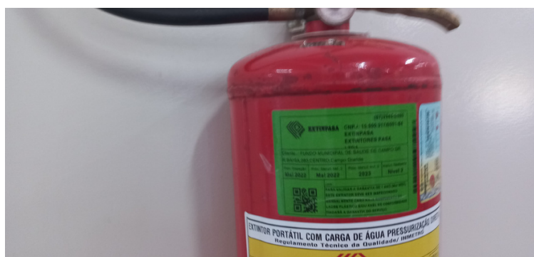
Foto 6 - Extintores dispostos pela unidade, com a data de validade expirada.