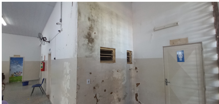
Foto 3 - Locais pontuais da unidade, acometidos por severas infiltrações e proliferação de mofo.