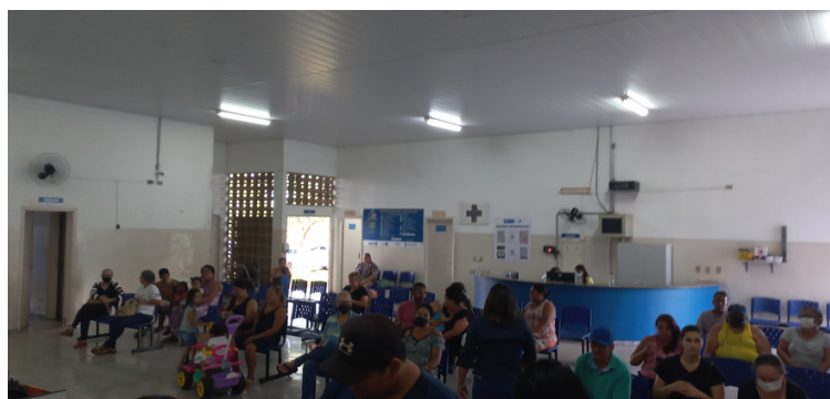
Foto 2 - Recepção desprovida de adequada climatização.