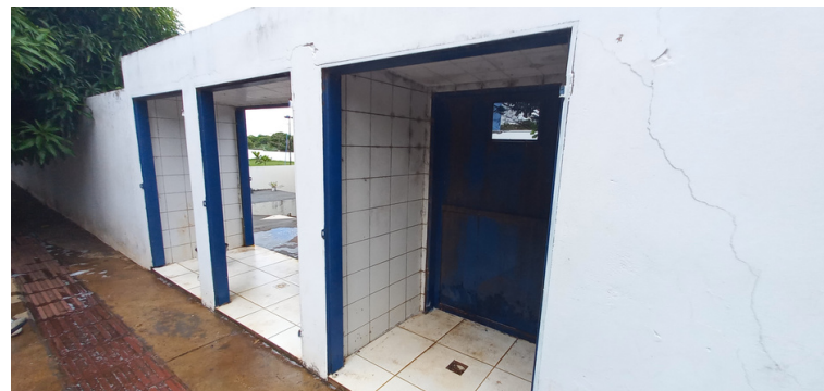
Foto 8 - Depósito de lixo sem portas, pois foram furtadas.