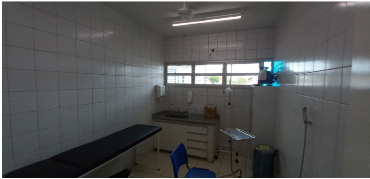
Foto 3 - Sala sem climatização apropriada.