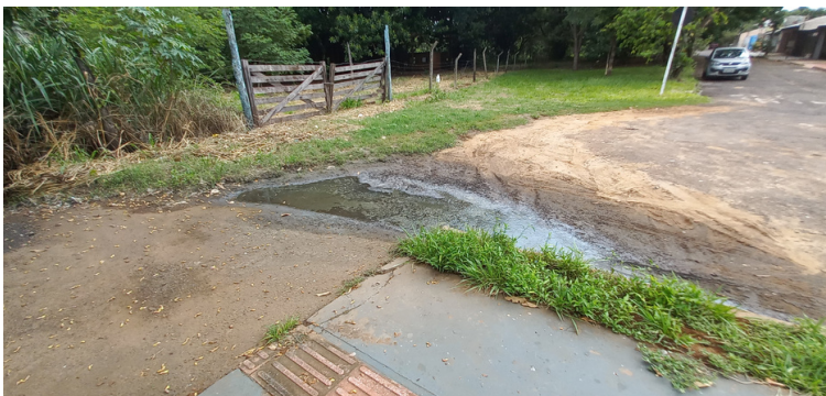
Foto 7 - Bueiro exalando mau odor na frente da unidade de saúde.