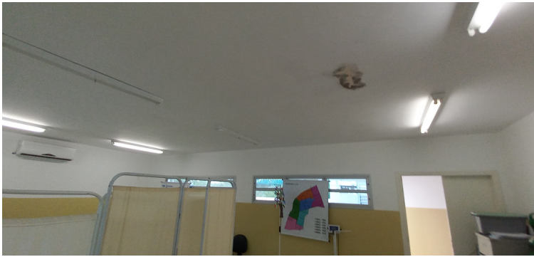
Foto 5 - Locais pontuais com mofo evidente.