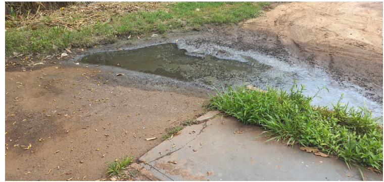
Foto 6 - Bueiro em frente a repartição com dejetos humanos.