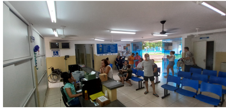
Foto 4 - Recepção com ventiladores avariados.