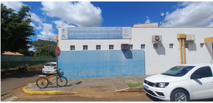
Foto 1 - Fachada da USF Dr. Olímpio Cavalheiro.