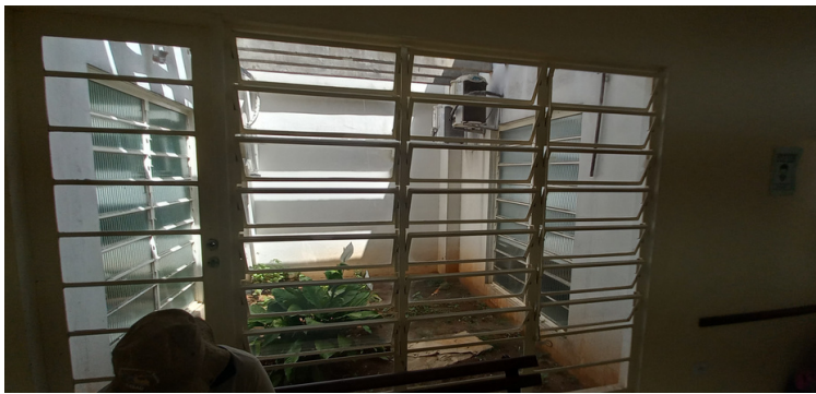
Foto 5 - Espaço que poderiam ser construídas duas salas demandadas pela unidade.