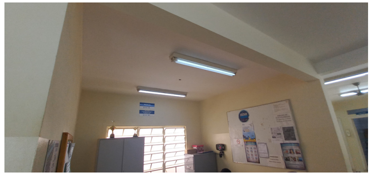
Foto 2 - Recepção sem climatização adequada.