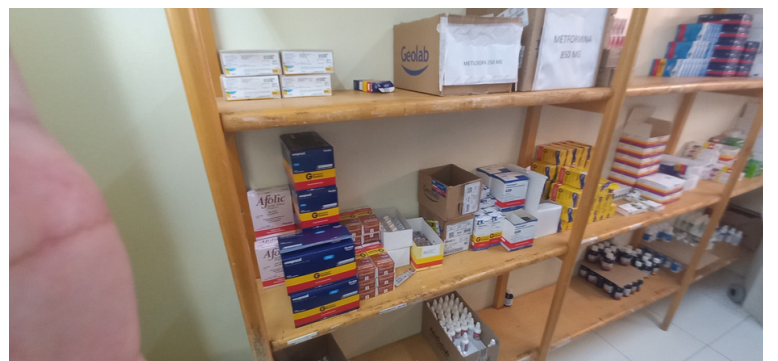
Foto 8 - Farmácia com medicamentos faltantes.