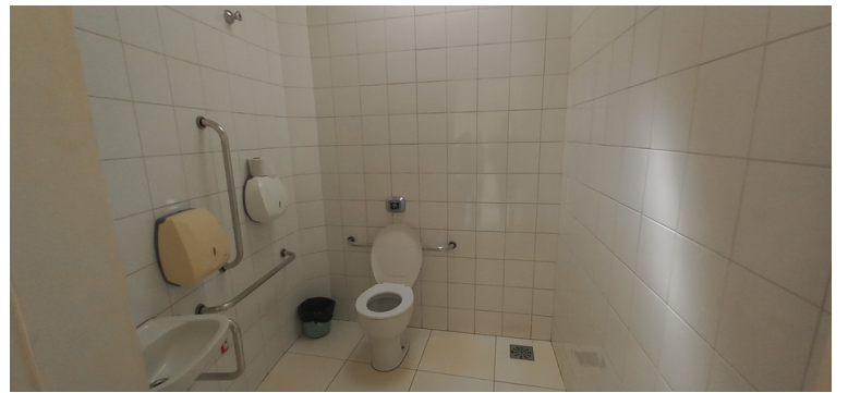
Foto 6 - Banheiros destinados ao uso do público em geral, limpo e com acessibilidade.