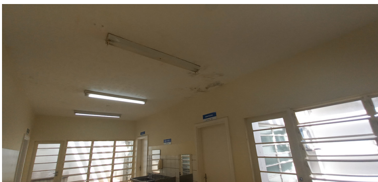
Foto 7 - Corredor pintura desgastada, com infiltração e mofo.