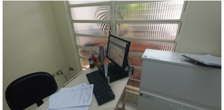
Foto 4 - Consultório com equipamentos de informática obsoletos.