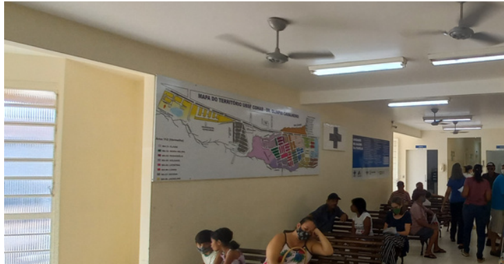
Foto 3 - Recepção com ventiladores apenas para espera dos usuários.